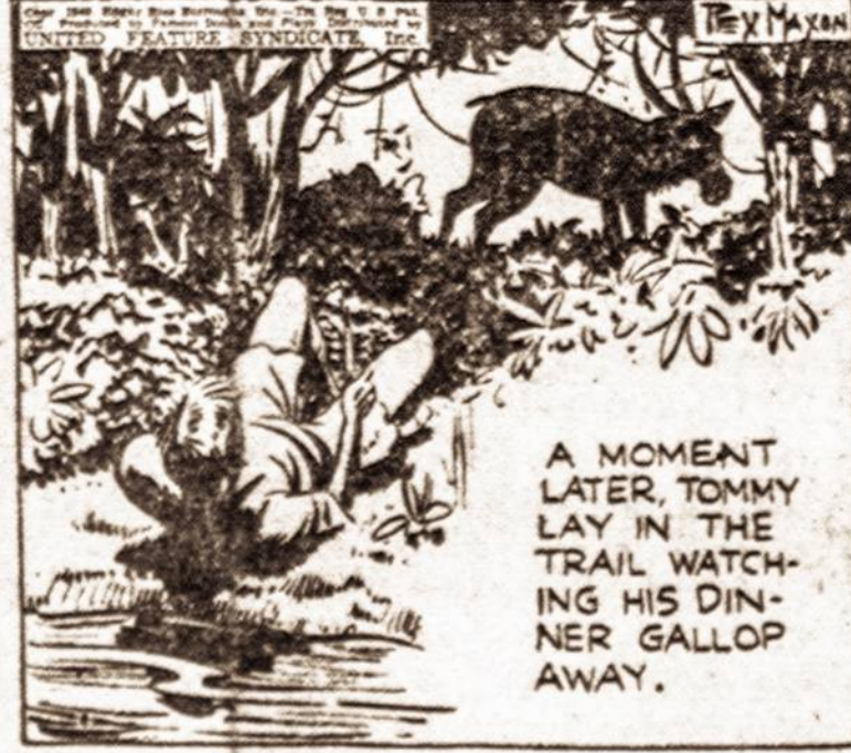
A MOMENT LATER, TOMMY LAY IN THE TRAIL WATCHING HIS DINNER GALLOP AWAY.

Tommy jautėsi labai nusilpęs nuo alkio, bet jis vis dėl to pajėgė įsilipti į nedidelį medų. Jis neužilpo, pamatė jauną laukinį ožį atelnantį į jo pusę.