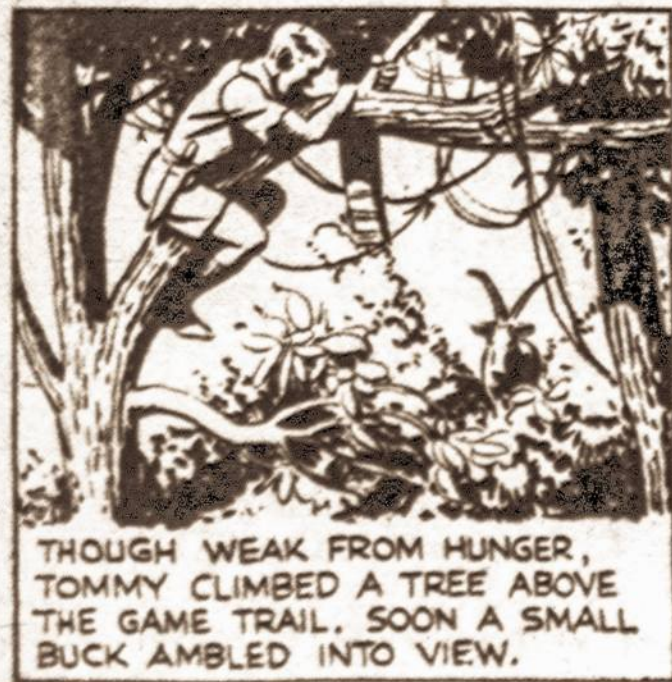
THOUGH WEAK FROM HUNGER, TOMMY CLIMBED A TREE ABOVE THE GAME TRAIL, SOON A SMALL BUCK AMBLED INTO VIEW.