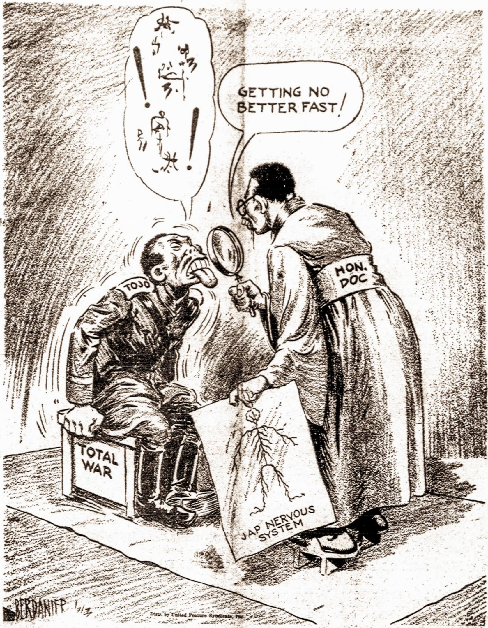
KADA LIEZUVIO RODYMAS REISKIA NETOLIMĄ GALĄ

Nėra abejonės, kad tada, kai Vienybė minės 60 metų sukaktį, tai Lietuva vėl bus laisva ir nepriklausoma.