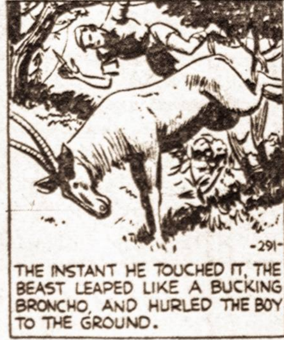
THE INSTANT HE TOUCHED IT, THE BEAST LEAPED LIKE A BUCKING BRONCHO, AND HURLED THE BOY TO THE GROUND.