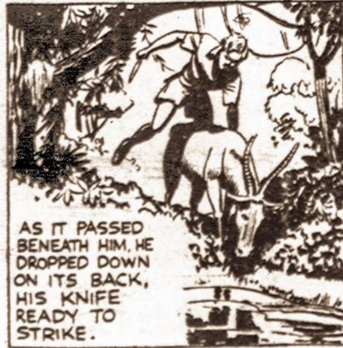
AS IT PASSED BENEATH HIM, HE DROPPED DOWN ON ITS BACK, HIS KNIFE READY TO STRIKE.