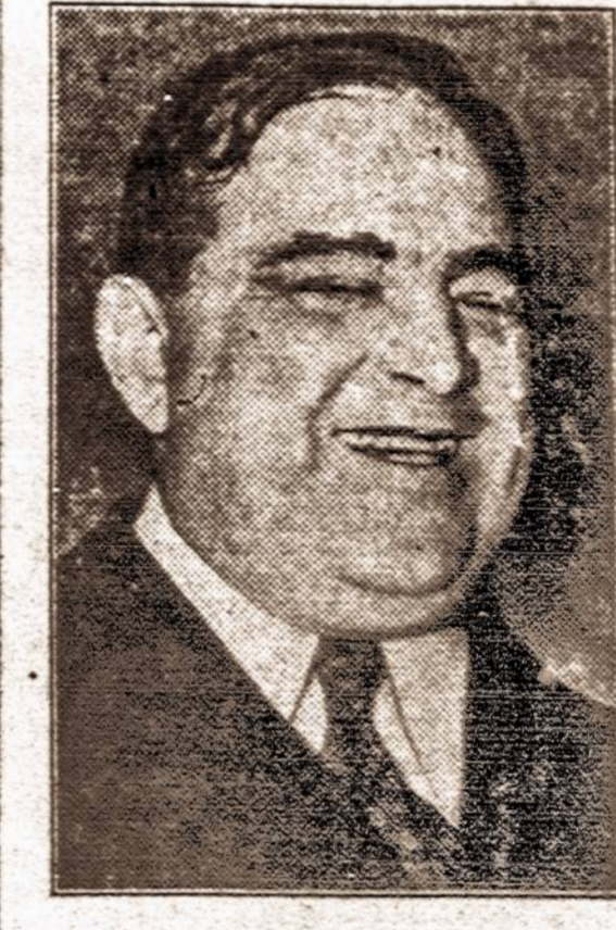
F. H. LA GUARDIA

Po seimo, visi delegatai vyksta į masinį Lietuvos nepriklausomybės minėjimą. Labor Lyceum, 947-9 Willoughby Ave., Brooklyn, N. Y., kur 4 val. p. p. prasidės kalbos ir koncertinė iškilmių dalis.