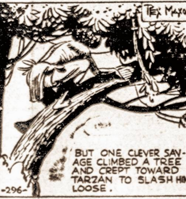
BUT ONE CLEVER SAVAGE CLIMBED A TREE AND CREEPT TOWARD TARZAN TO SLASH HIM LOOSE.

Atsipeikėjęs Butawa kareivis greit pašoko, tikėdamasis merginą nutraukti žemyn už kojų. Bet Tarzanas, tai matydamas, laukinę merginą dar ankščiau iškėlė ir paskui ją visai paleido.