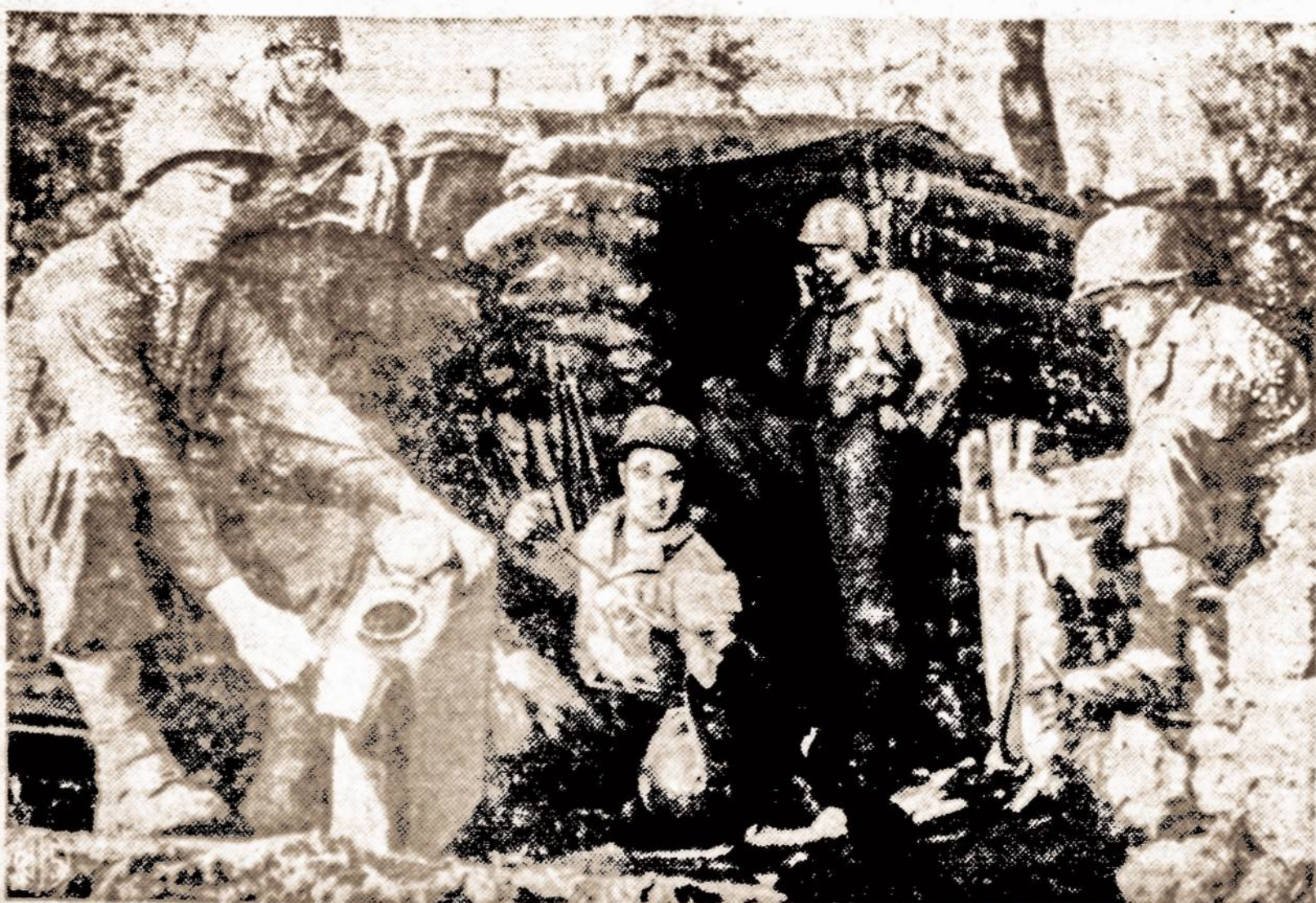
Mūsų kariai puolė metu, fronto.

Seimas prasidėjo ir baigėsi Amerikos ir Lietuvos himnais. Delegatai skirstėsi puikiausioje nuotaikoje, tvirtai tikėdami, kad šio seimo nutarimai bus įvykdyti. Po seimo sesijų, įvyko Lietuvos nepriklausomybės sukakties minėjimas ir koncertas, triumfaliai apvainikavęs Amerikos Lietuvių Seimo pasisekimą.