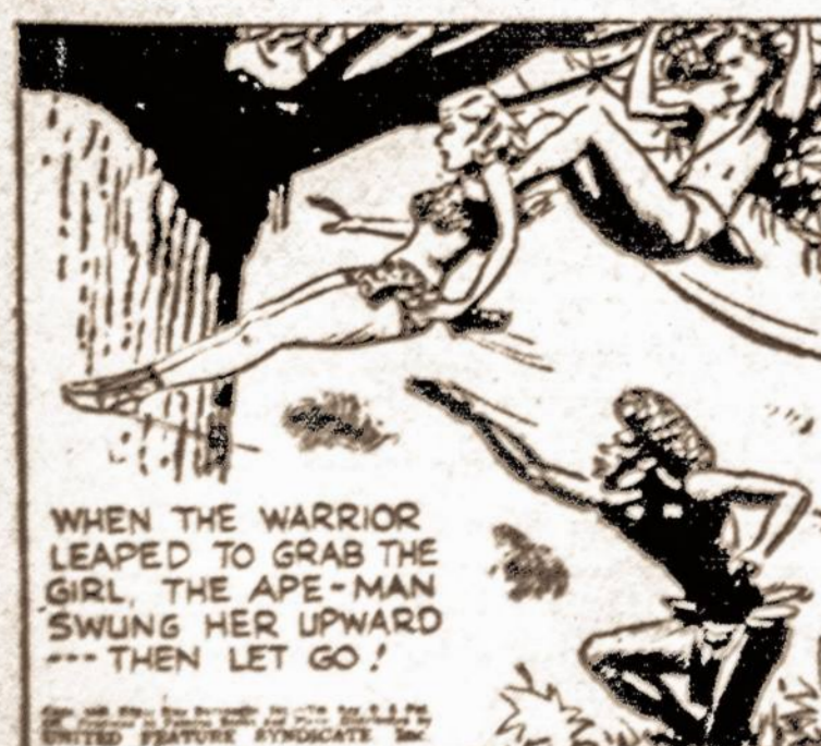
WHEN THE WARRIOR LEAPED TO GRAB THE GIRL, THE APE-MAN SWUNG HER FORWARD --- THEN LET GO!