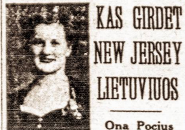
KAS GIRDET NEW JERSEY LIETUVIUS

Taupykite riebalus karo reikalams. Kai susirenka svaras ar daugiau, nuneškite mė-ininkui.