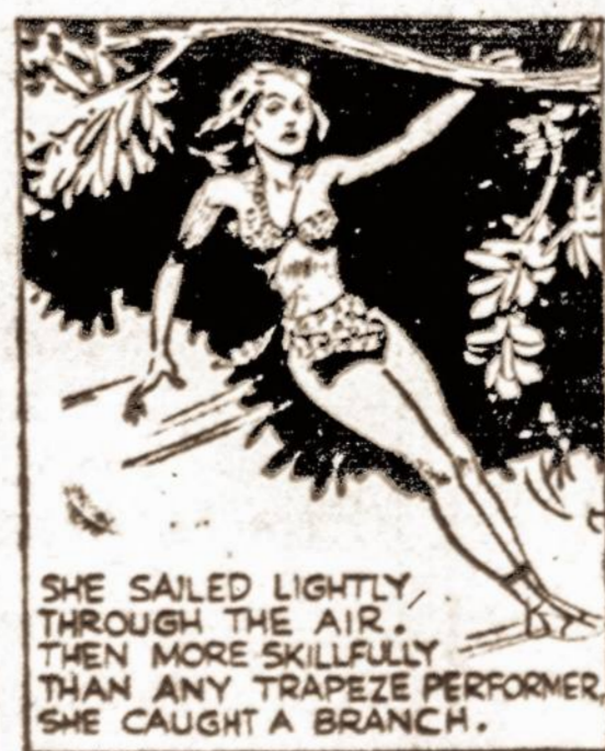
SHE SAILED LIGHTLY THROUGH THE AIR --- THEN MORE SKILLFULLY THAN ANY TRAPEZE PERFORMER, SHE CAUGHT A BRANCH.