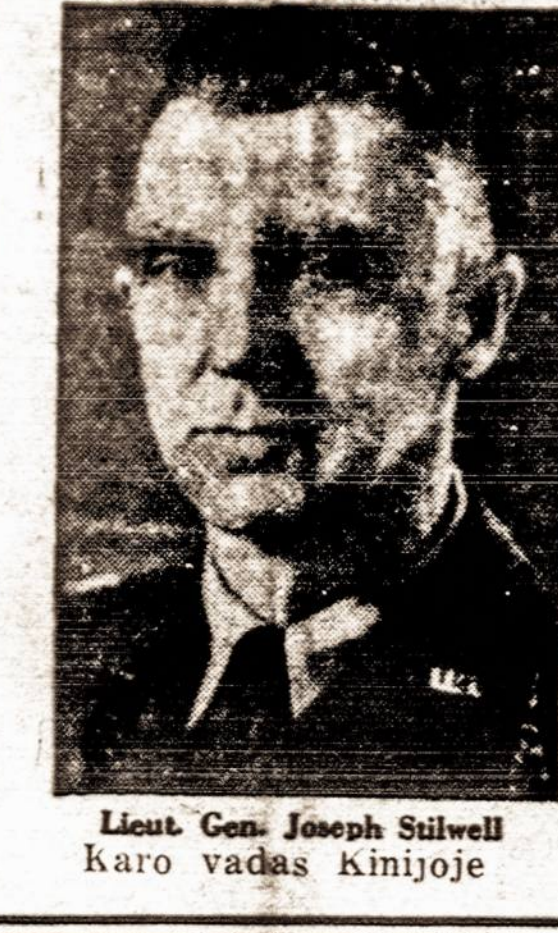
Lieut. Gen. Joseph Stilwell Karo vadas Kinijoje

Houston, Texas gyvena ir kaip pramonės įmonėje dirba vienas pilietis, kuris yra 30 vaikų tėvas. Iš visų vaikų da-bar gyvena 19. Iš jų 30 vaikų 18 buvo berniukai, o 12 mer-gaitės. Dabar šeši jo sūnūs tarnauja kariuomenėje, o ke-turi netrukus bus pašaukti karo tarnybai. Jo vyriausias sūnus 39 metų amžiaus, o jau-niausias 3 metų. Jis vedė tris kartus ir dabar turi 21 anūką.