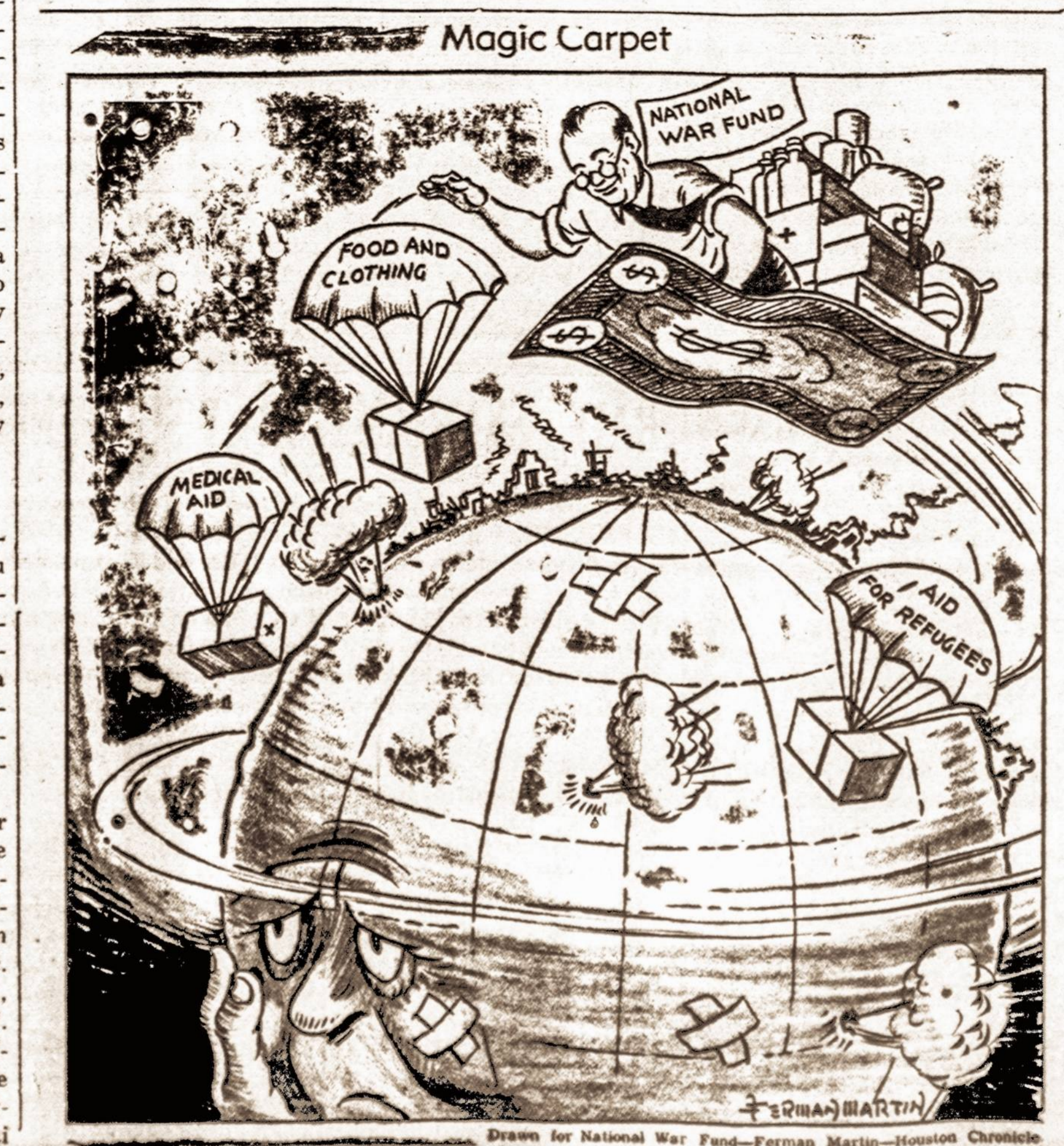
Drawn for National War Fund—Ferman Martin—Houston Chronicle

WILLIAM PASCHALL MAISTO KRAUTUVE 408 North 8-th Street, PHILADELPHIA, PA. Tel.: LOM. 2293