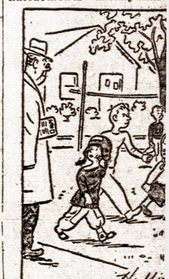
"The score's 139 to 0 but we'll up in the second half. Our m-ger's gone home for some Whee

Karo Maisto Adminis-trijos pareiškimo, kalakutai, ti užjūrio karinių pajėgų dėkos Dienai, Kalėdoms Naujų Metų Dienai, jau siūsti į paskyrimo vietas, nežiūrint to, įsakymas, re-laujās visus kalakutus, u-gintus ir supirktus nustaty apylinkėse, laikyti arba tatyti Quartermasterių Ko-sui, negali būti atšauktas nebus išpildyti visi šve-kariuomenės užsakymai.