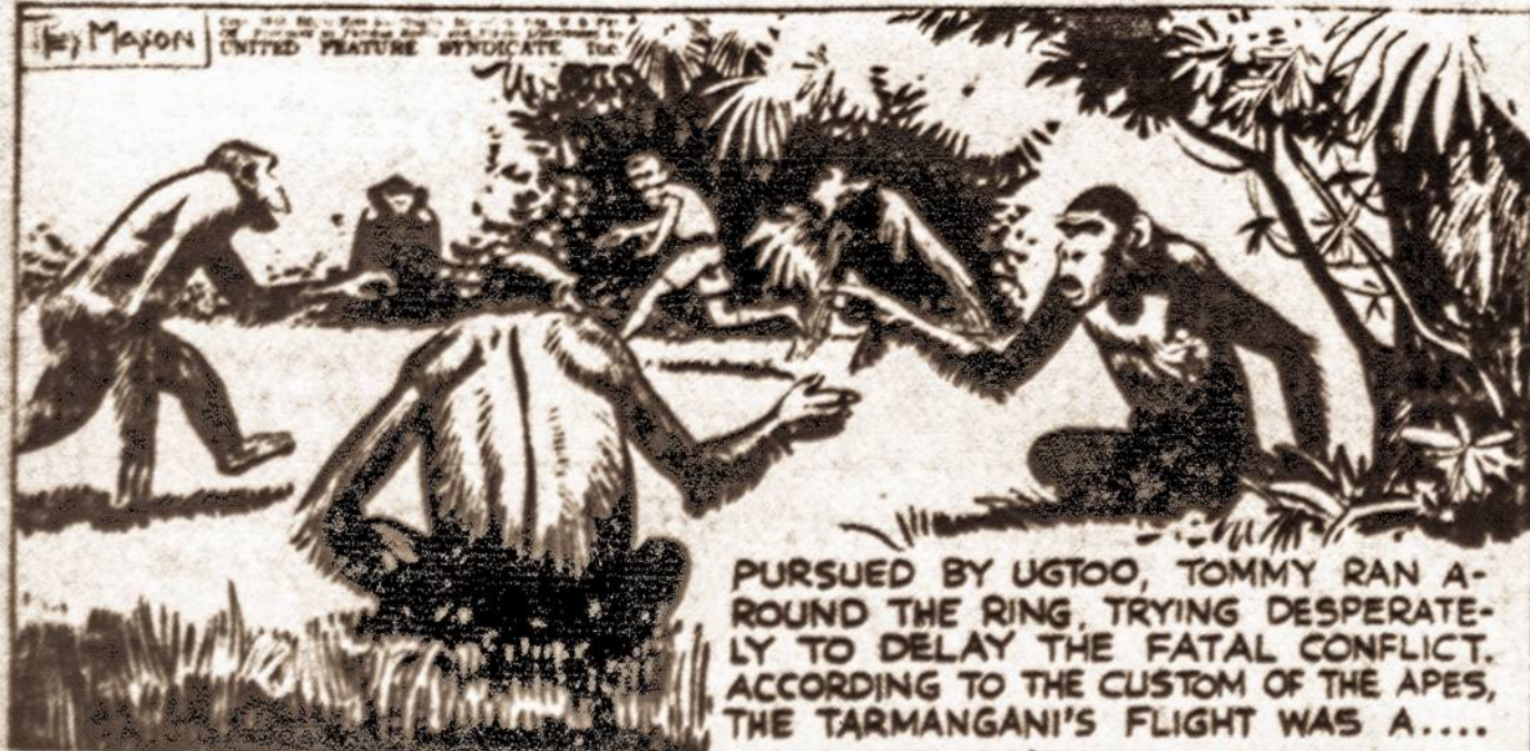
PURSUED BY UGTOO, TOMMY RAN AROUND THE RING, TRYING DESPERATELY TO DELAY THE FATAL CONFLICT, ACCORDING TO THE CUSTOM OF THE APES, THE TARMANGANI'S FLIGHT WAS A...