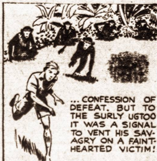
... CONFESSION OF DEFEAT, BUT TO THE SURLY UGTOO IT WAS A SIGNAL TO WENT HIS SAV-AGRY ON A FAINT-HEARTED VICTIM!