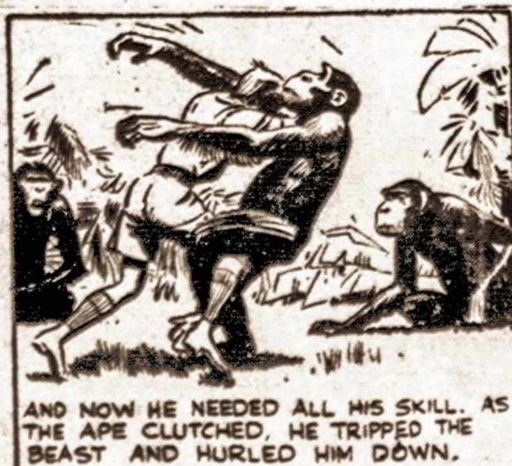
AND NOW HE NEEDED ALL HIS SKILL. AS THE APE CLUTCHED, HE TRIPPED THE BEAST AND HURLED HIM DOWN.