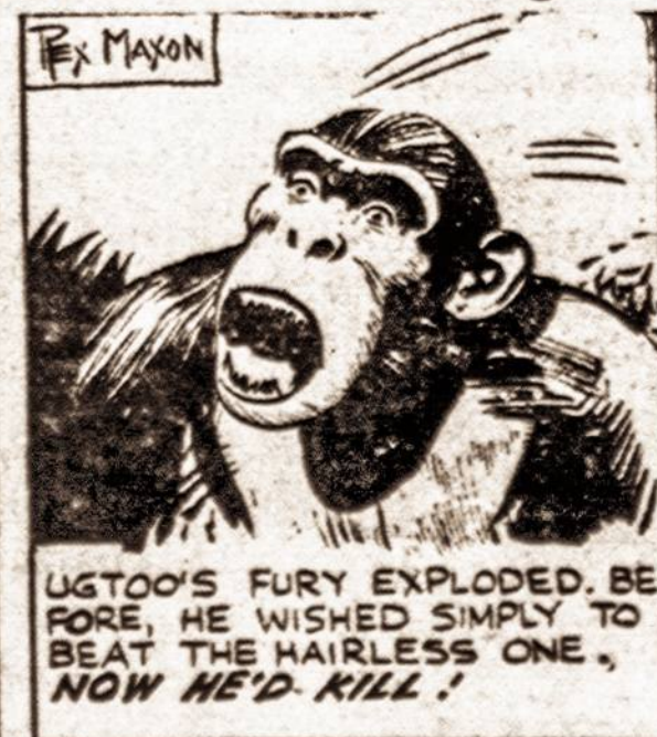
UGTOO'S FURY EXPLODED. BEFORE, HE WISHED SIMPLY TO BEAT THE HAIRLESS ONE, NOW HE'D KILL!