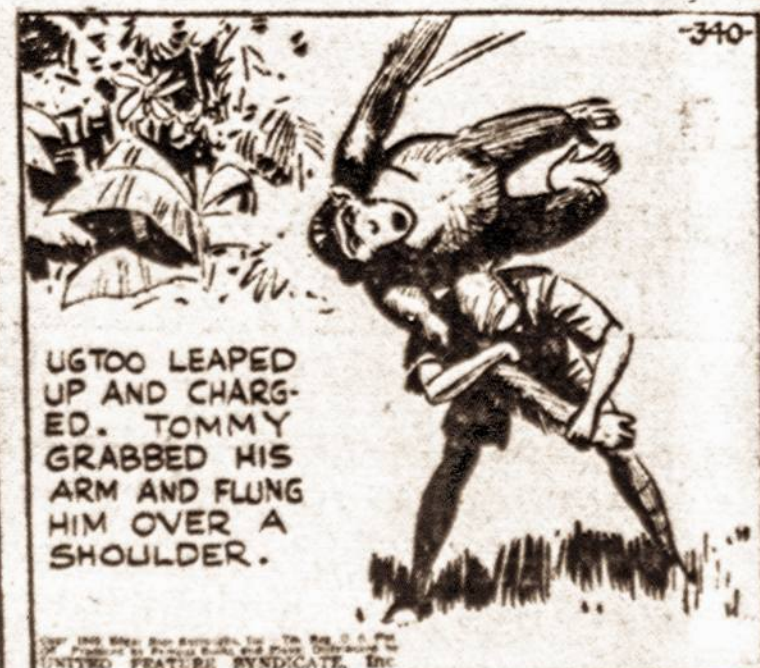
UGTOO LEAPED UP AND CHARGED. TOMMY GRABBED HIS ARM AND FLUNG HIM OVER A SHOULDER.