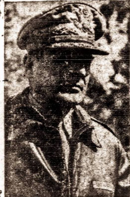
General Douglas MacArthur

Amerikiečiams išlaisvinus Manilą, gen. MacArthur atvyko į Filipinų sostinę, kur gyventojai jį pasitiko su nepaprastu entuziazmu. Vėliau gen. MacArthur nurodė, kad tuomas, kur tuo metu japonai lėktuvai pradėjo metyti bombas, Viena bomba sprogdavo šimtą jardų nuo tos vietos, kurią generolas tik ką buvo apleidęs.