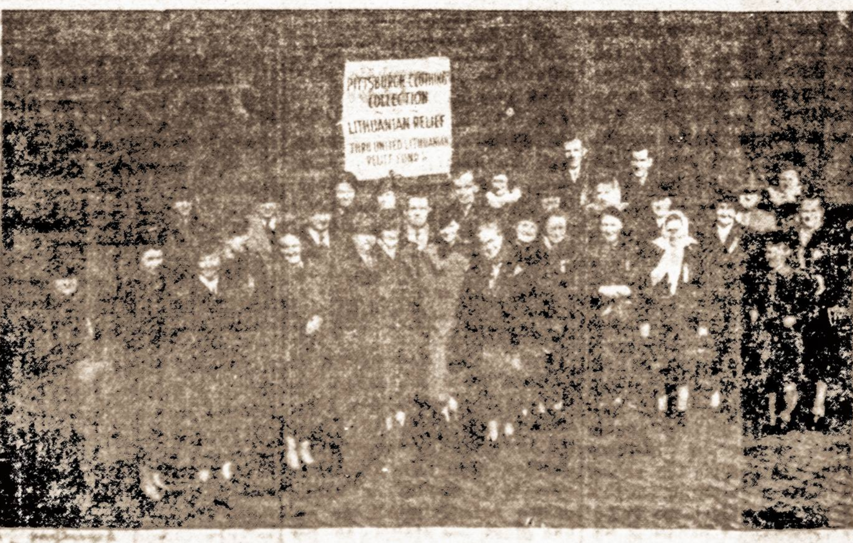
Pittsburgh, Pa., BALF apskrities rūbų rinkimo vairo darbuotojai, surinkę visų 25,000 svarų drabužių.