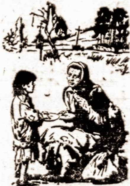
BALF RŪBŲ SANDĖLIO SIMBOLIS, PRIMENANTIS LIETUVĄ.

HAYMEYER 3-0259 RALPH KRUCH FOTOGRAFAS 65-23 GRAND AVENUE MASPETH, N. Y.