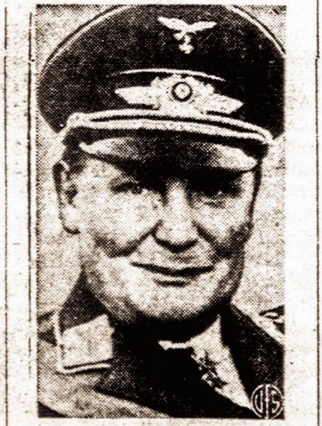
Hermann William Goering

Reichsmarsalas Herman Wilhelm Goering praeitą trečiadienį pasidavė Septintajai Amerikos armijai kartu su savo žmona, žinoma švedų artiste Emmy Sonnemann ir šešerių metų amžiaus dukterine Edda. Buvęs Luftwaffe viršininkas ir antro numerio nacių papasakojo, kad prieš pat Vokietijos pasidavimą jis susipykęs su Hitleriu, kuris įsakė marsalą sušaudyti. Bet buvusieji Goeringo ginklo draugai jį išgelbėję ir paslėpė Austrijos kalnuose. Išimaudęs, pakeltes drabužius ir pasipuošęs medaliais, Goeringas sutiko pozuoti Amerikos spaudos fotografams. Uždarytas vienoje pilyje, netoli Kitzbuhel, Austrijoje, marsalas Goeringas Amerikos kariams pasakė: "Saugokite mane gerai".