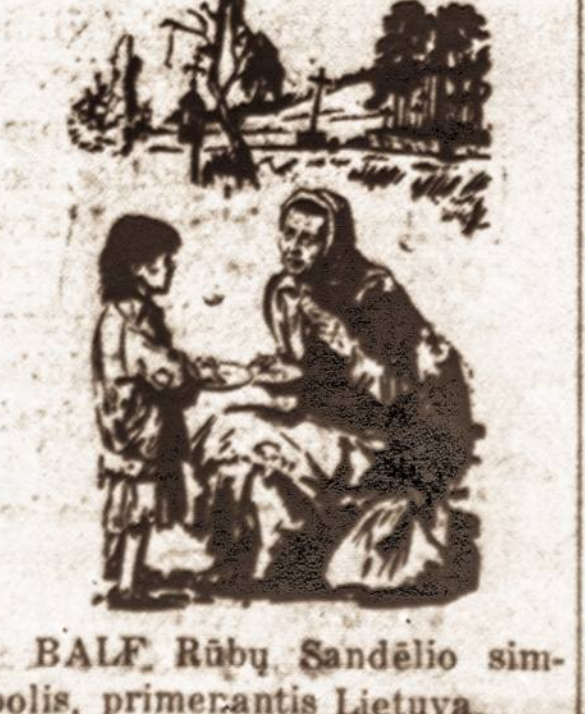
BALF Rūbų Sandėlio simbolis, primerčiantis Lietuvą.