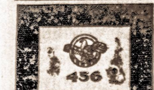
Karo Departamento užgirta emblema Antrojo Pasaulinio karo veteranams.