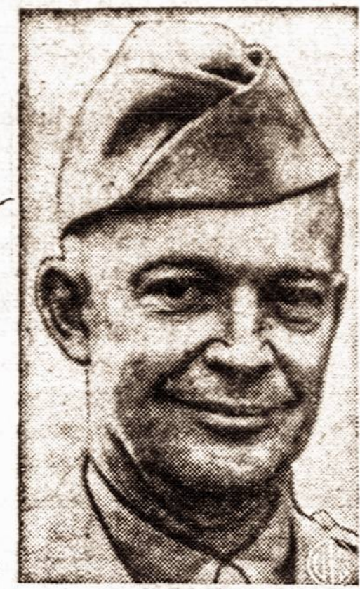
Gen. Dwight D. Eisenhower

Manoma, betgi, kad sovietai jau dabar reikalauja tam tikrų Vokietijos teritorijų sau ir Lenkijai. Vienas iš svarbiausių klausimų, liečiančių būsimą Vokietiją, bus be abejonės, sugriautų