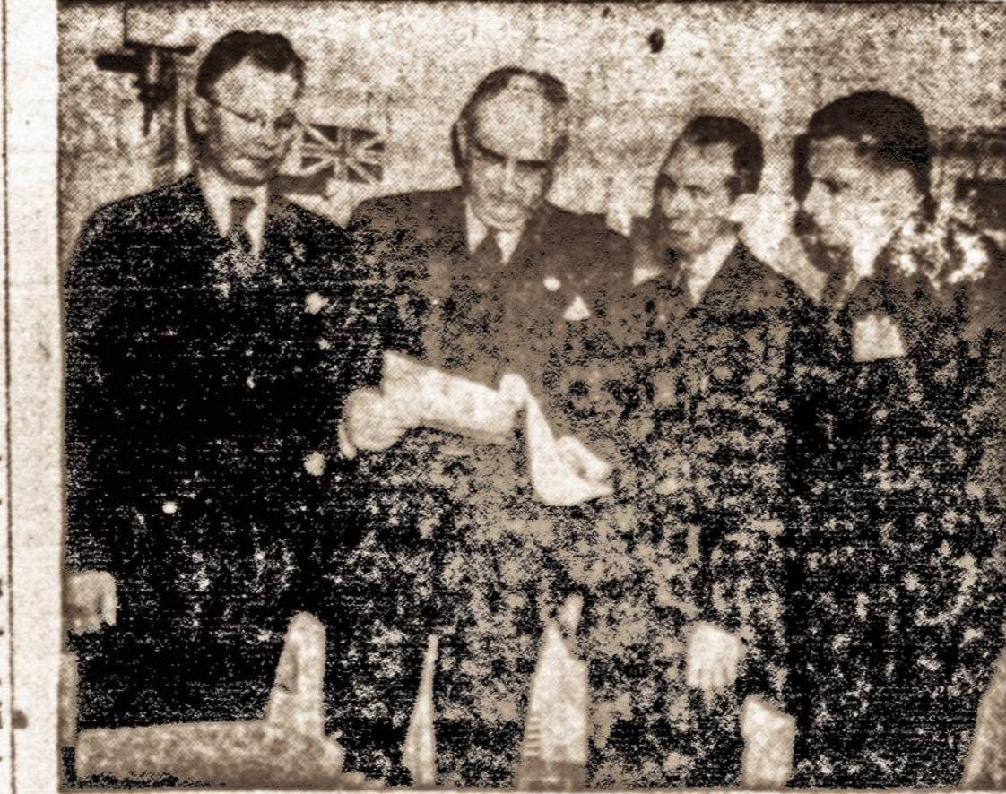
Senatorius Vandenburg, Amerikos delegacijos narys San Francisco konferencijoje, priima ALM atstovų memorendumą.

Vienas Amerikos karo lek- tuvas sėkmingai nuskandino net 5 japonų transporto lai- vus Formosa salos pakraštyje, Filipinų salos jau baigiam- mos apvalyti nuo japonų. Ge- nerolas MacArthur praneša, kad Filipinuose jau žuvo 369- 818 japonų ir nelaisvėn paim- ta keli tūkstančiai.