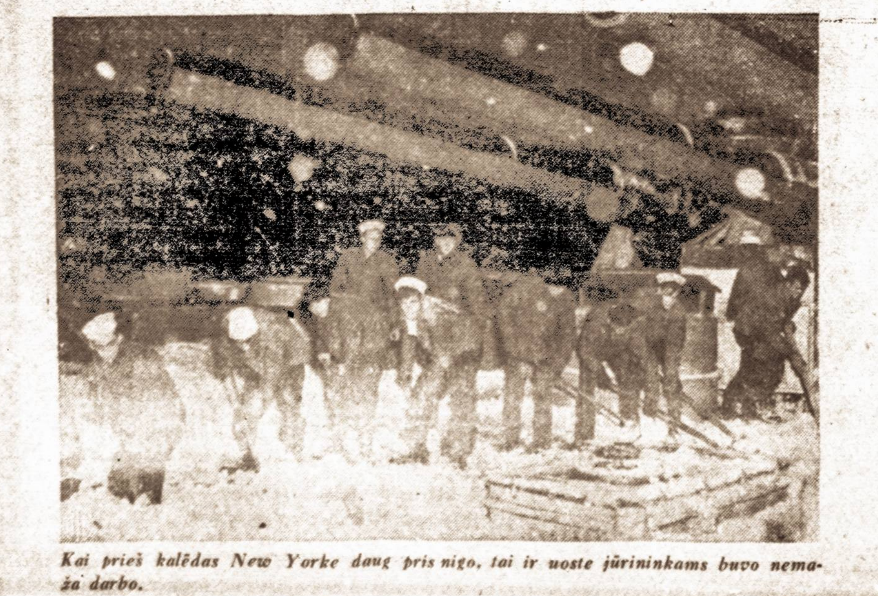
Kai prieš kalėdas New Yorke daug prisigijo, tai ir uoste jūrininkams buvo nemaža darbo.