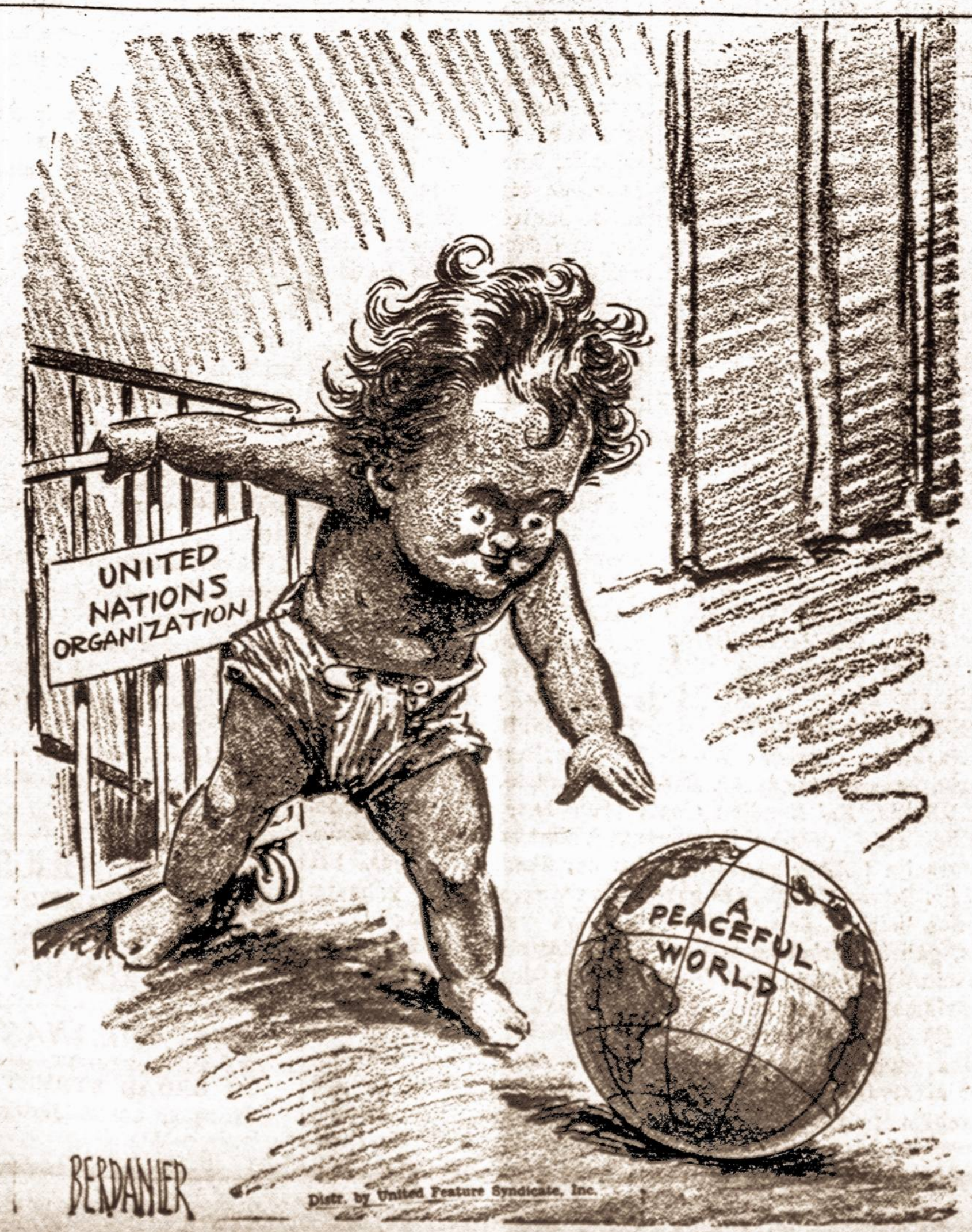
BERDANIER Dist. by United Feature Syndicate, Inc.