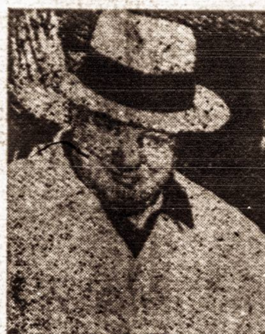
Winston Churchill, buvęs britų premjeras karo metu, dabar ilsisi Floridoje, kur jis netrukus, kaip pranešama, susitiks su prezidentu Trumanu.

Sakoma, kad Amerikos, kaip ir britų armijų vadovy-bės ruošiasi ne tik sustabdyti tolimesnę bolševikų invaziją Europoje, bet ir išstumti juos iš tų kraštų, kuriuos jie karo metu spėjo pavergti.