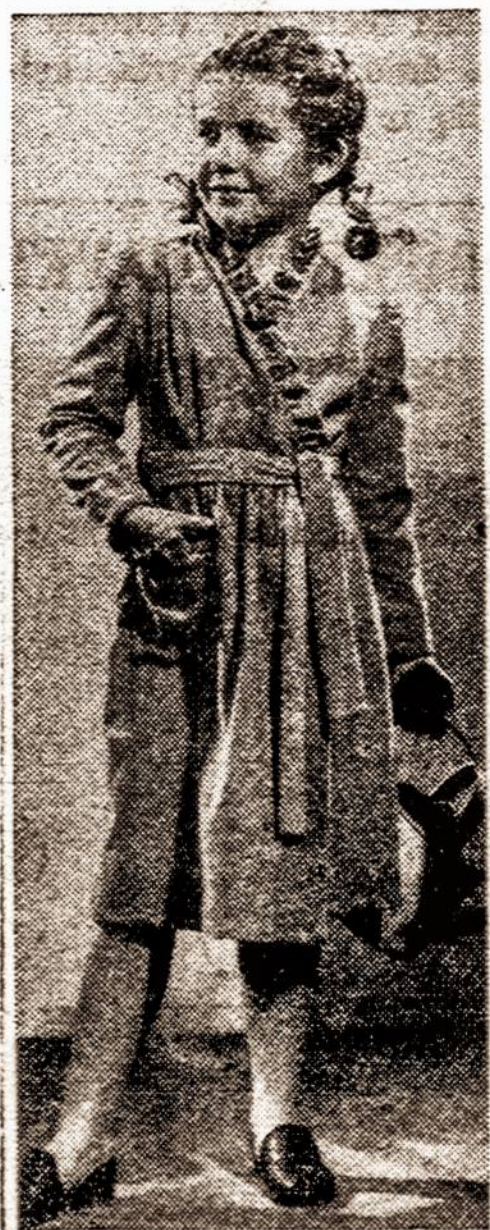
Ši mažametė parodo, kaip jos amžius mergaitės, būdamas namie, gali gražiai apsirengti. Ji vilki pavysdingai pasiūta kimona.

Šiomis dienomis laivu Adgentina į New Yorko uostą atplaukė apie pusantro šimto Amerikos karių žmonų, su 175 vaikais. Pirmą kartą pamąčiusios Laisvės stovyklą, naujos Amerikos pilietės sutartinai užtraukė The Star Spangled Banner.