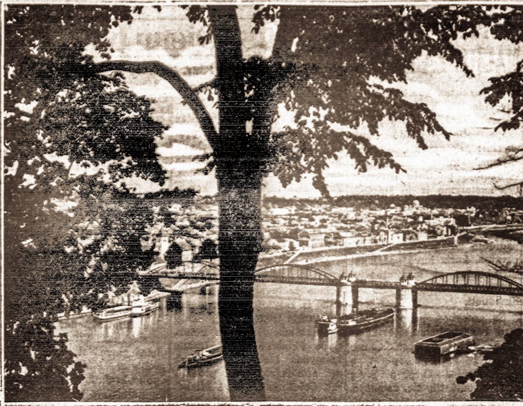
"Ten, kur Nemunas banuoja tarp kalnų aukštų, broliai vargdieniai dejuoja..."

Selingstade leidžiama Lietuviškoji Informacija. Be to, Lietuvių Kat. Kunigų sąjunga pradėjo leisti religinį savaitraštį Naujas gyvenimas. Augsburgėje leidžiamas gražus savaitraštis Žiburiai. Schweinfurte leidžiamas Tėviškės Garsas. Bambergėje lietuviai leidžia informacinį biuletinį Naujie.