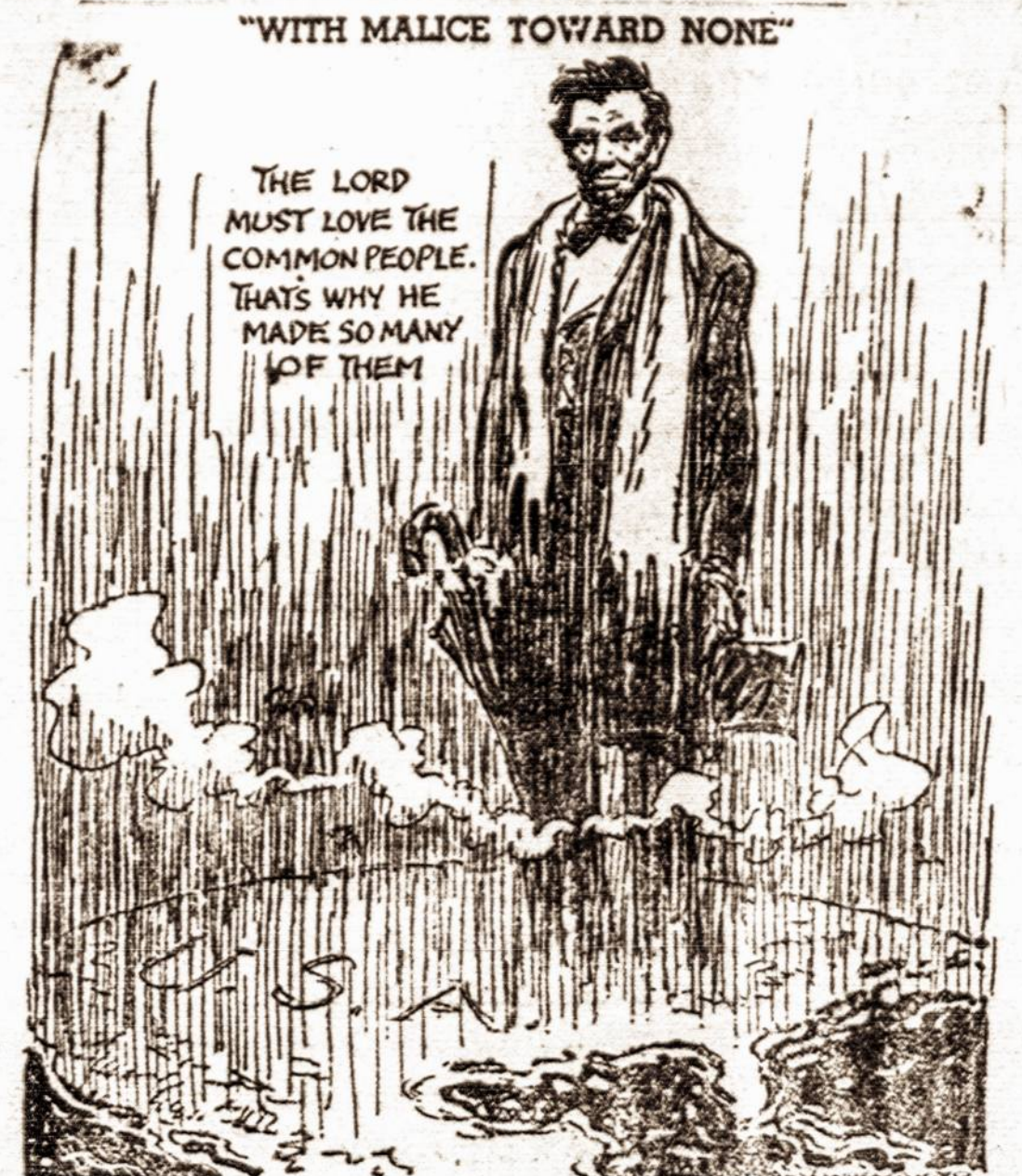
Sio mėnesio 12 d. visoje Amerikoje švenčiama Lincolno diena.