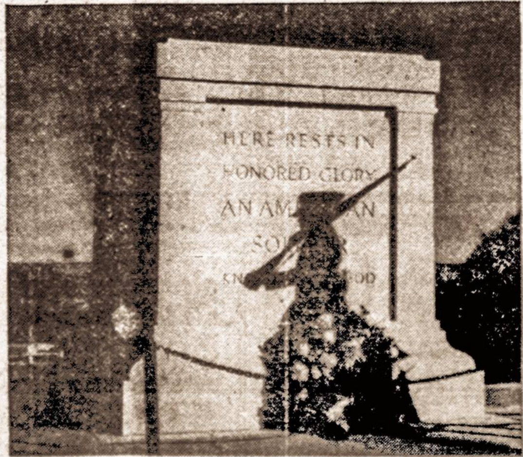
Nežinomo kareivio kapas, Arlington, Va., netoli Washingtono, su sąryšinio keičti. Šią Amerikos šventovę pastatytą prieš 25 metus, kasmet aplanko įvairių tautų atstovai, palikdami vainikus ir tuo būdu pagerbdami žuvusius karius dėl laisvės.