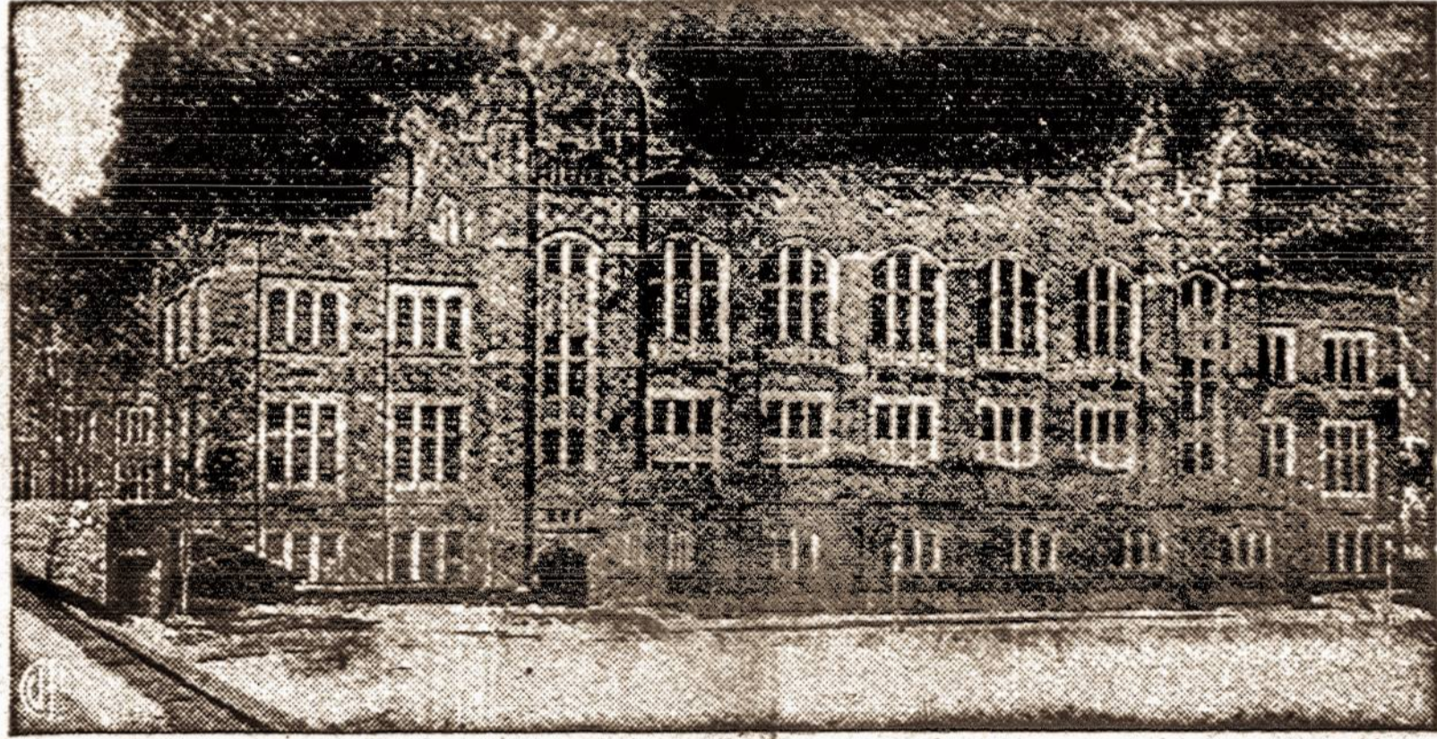
Šiuose rūmuose, Bronx, N. Y., ateinant pirmadienį prasidės JTO Saugūmo Tarybės posėdis, kuriame, manoma, tarp JAV ir Anglijos iš vienos ir Sovietų Rusijos iš kitos pusės bus daug karštų ginčų dėl Irano ir Tol. Rytų.

Taip teisingai išsigimėlis Petiot, kurį prancūzų spauda vadina "didžiausiu kriminalistu šiame šimtmetyje."