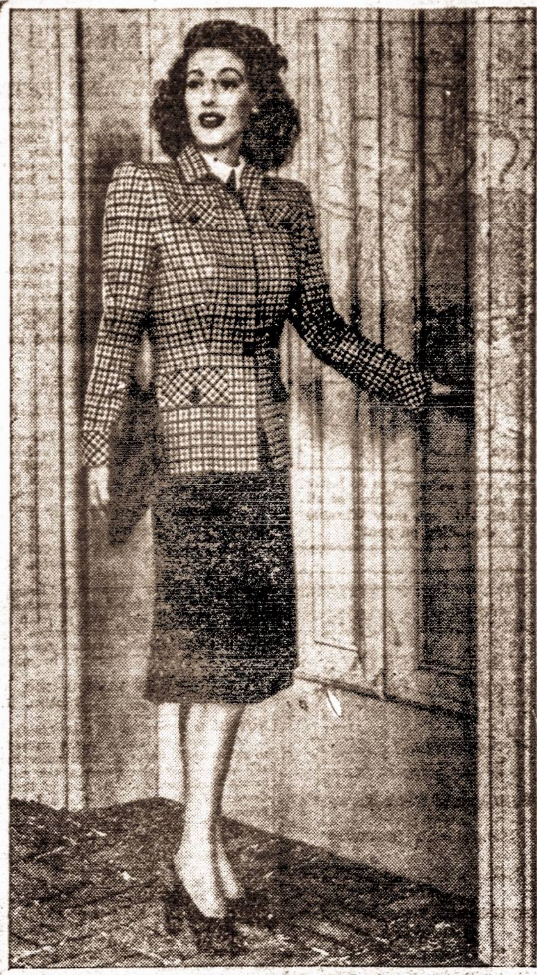
Loreta Young, RKO filmų artistė, parodo įdomų kasdieninį kostumą pavasarui. Zakieta ji kombinuoja su skirtingomis suknelėmis ir sijonėliais.