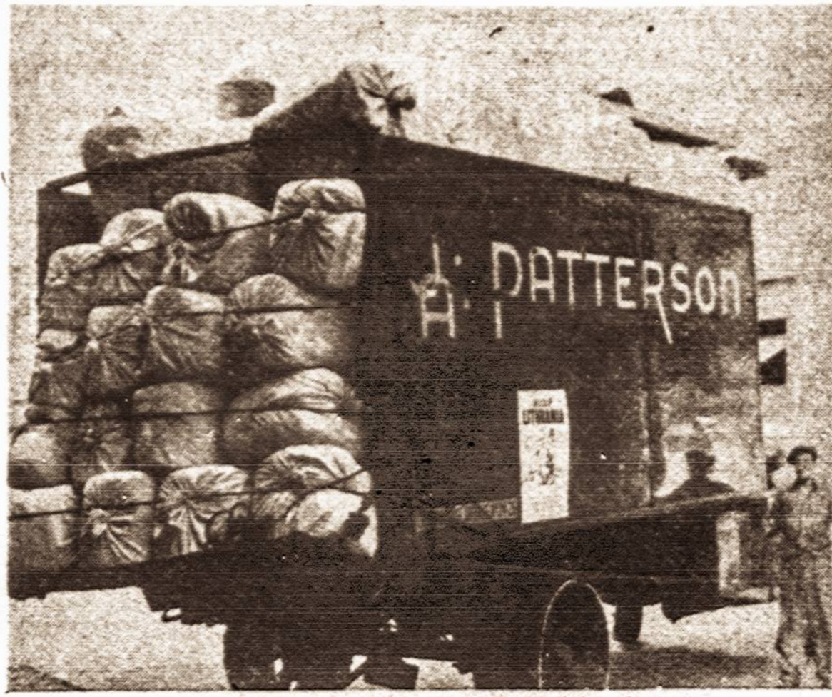
Amerikos lietuvių dovanoti drabužiai ALF sandėlio sunkvežimiu vežami į uostą, iš kur jie siunčiami Lietuvos karo pabėgėliams Europoje.

Atėnančią savaitę Vienybėje, paskutiniame puslapyje, vėl pasirodys Tarzanas, kuris ne tik buvo paklydęs New Yorko "džiunglėse".