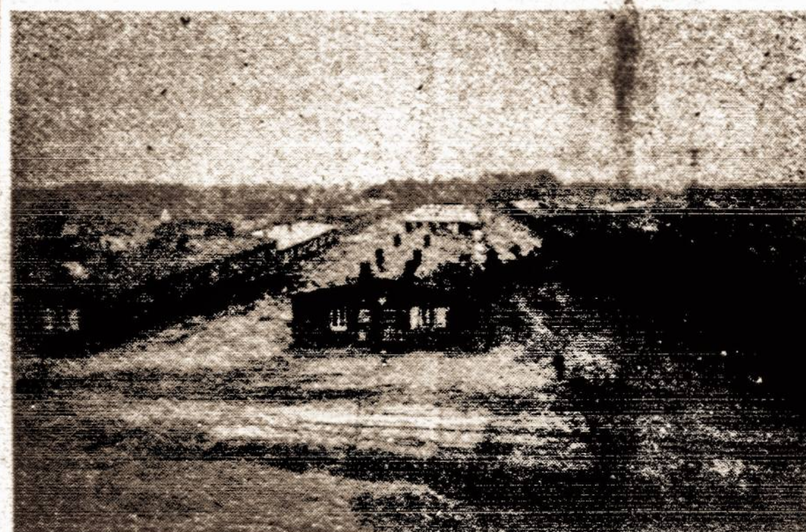
Taip atrodo vienos lietuvių stovyklos vaizdas britų zonoje, šiaurinėje Vokietijoje.

Ne, Dievuliau, ne širvinta. Gaudžia varpas vakaro maldai Tyllame ežerėlio krante, Tik jo balsas širdį man skaldo — Ne, Dievuliau, ne Alvite. Žiburėliai sodybose švinta, Žemės ašarų šviesūs lašai — Tik per greitai migla juos užkrinta — Ne, Dievuliau, ir ne Kiršai."