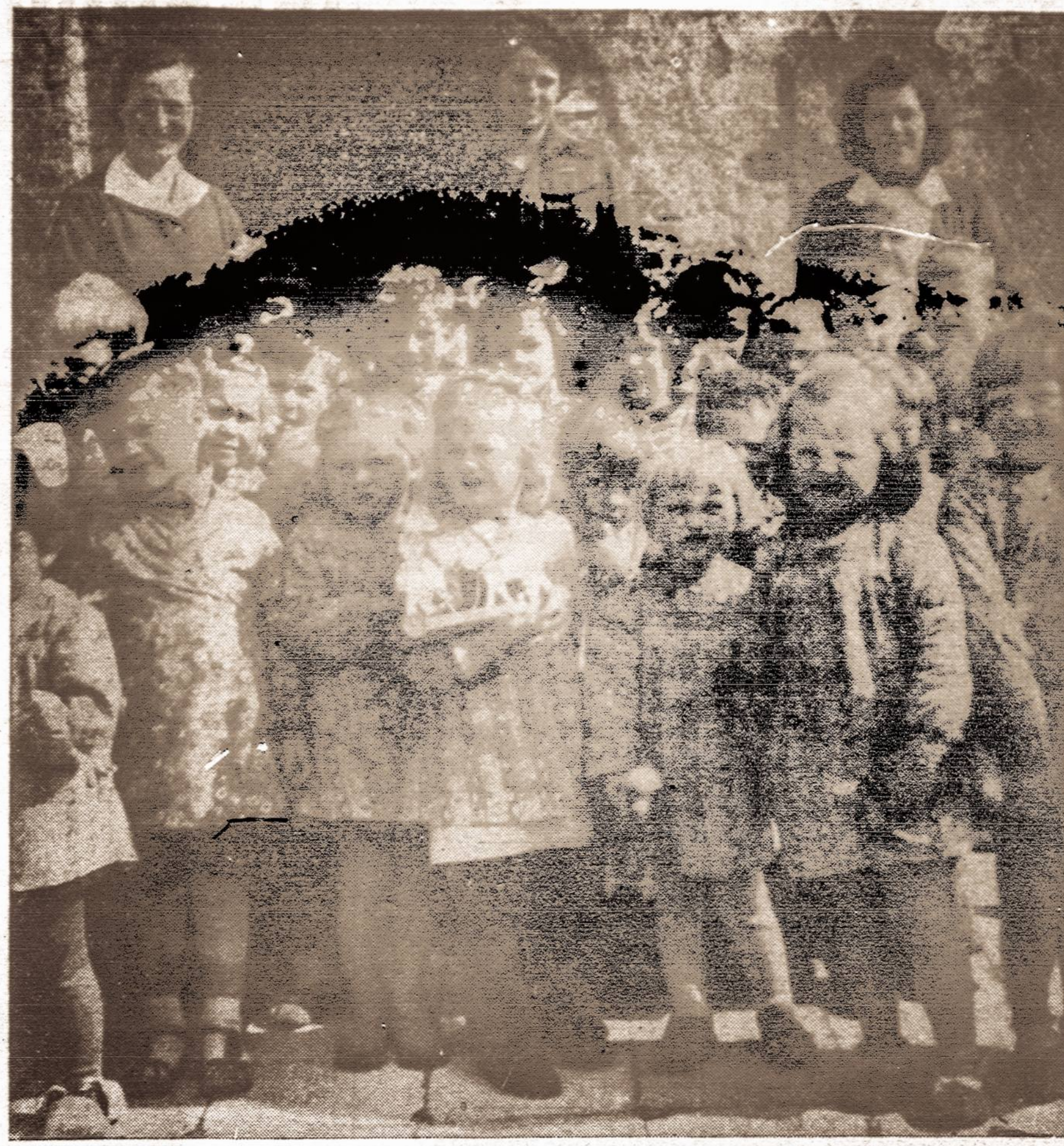
Mazieji lietuviai našlaičiai vienoje lietuvių stovykloje Vokietijoje, vėrytė zonoje. Prie našlaičių dvi mokytojos prižiūrėtojos ir UNRRA atstovė. Tokių našlaičių yra ir amerikiečių zonoje.