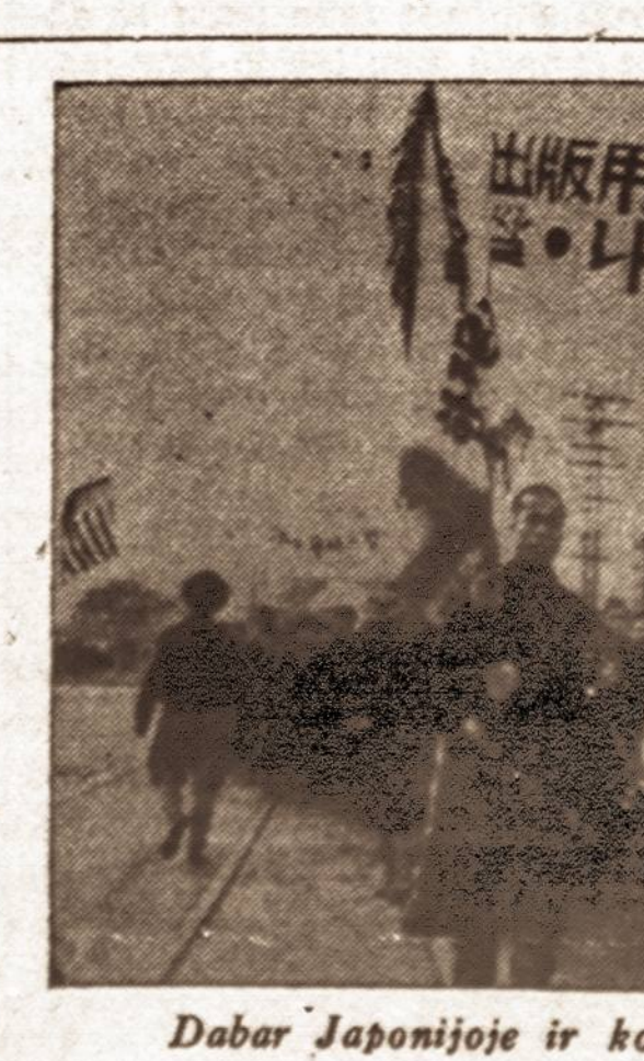
Dabar Japonijoje ir komunistai demonstruoja.

— Vienas senas aukso ieškotojas prašė Amerikos armijos vadovybę su V-2 raketa nurgriauti jo valdomo kalno viršūnę. Sako, po viršūnę yra aukso ir ieškotojas siūlo Amerikai 10 nuosimtį pelno.