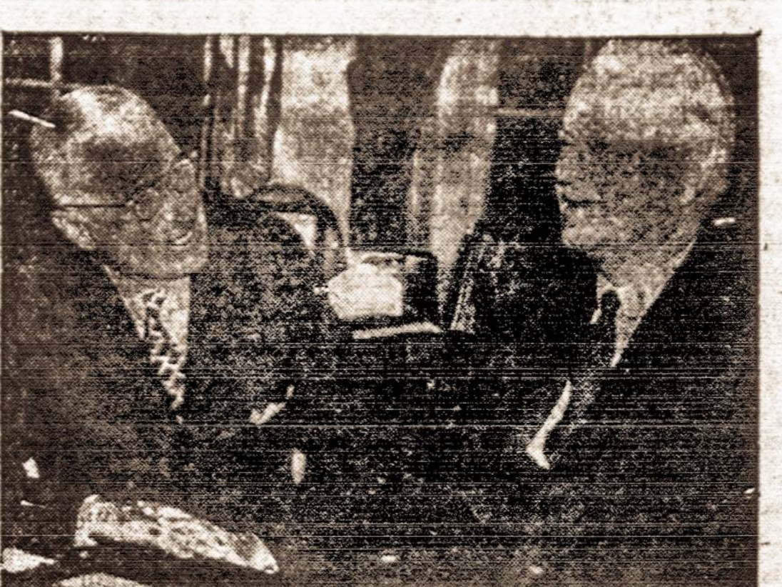
Grįžęs iš Pietų Amerikos Hooveris kalbasi su prezidentu Trumanu apie šalpos reikalus.

Po Herberto Hooverio kelionės Amerika su skaidriais ant delno pamatė ir ištiktimo, kad Europos kare dalyvaususių tautų nelaimės dar visiškai nežada baigtis. Armotų ir lėktuvų bombos nebegriauna miestų. Bet išliko kitas priešas, ne mažiau naikinantis pavienį žmogų ir ištisias tautas. Tai badas. Badas su visais savo brolais ir seserimis — ligomis, epidemijomis, skurdu ir nepritekialais.