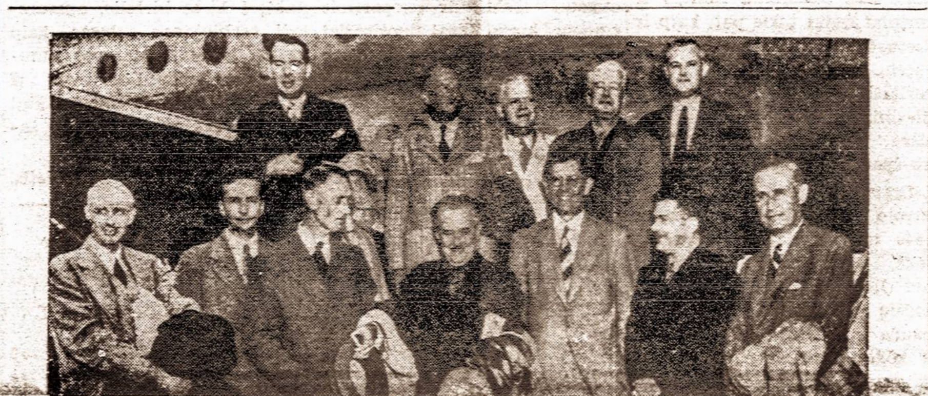
Dvylika Amerikos laikraščių redaktorių ir leidėjų išvyko į Europą susipažinti su okupacinėmis zonomis ir jų problemomis. Vieno mėnesio laikotarpyje svečiai lankysis Vokietijoje, Austrijoje, Italijoje ir kitur.

Mūsų žiniomis, buvęs Lietuvos Respublikos prezidentas dr. Kazys Grinius, kuris dabar su žmona ir sūnum gyvena pietų Vokietijoje, ruošiasi, kartu su šeima, atvykti į Jungtines Amerikos Valstybes. Dr. Kazys Grinius, kuriame dabar yra 80 metų amžiaus, nesiliauja rūpintis Lietuvos laisvės reikalais. Manoma, kad sveikata jam leis dar aplankyti bent didžiąsias Amerikos lietuvių kolonijas. Karo metu vokiečiai dr. K. Grinių buvo ištrėmė ir jo teviškė todėl, kad jis, kartu su kitais buvusiais Lietuvos valstybės vyrais, protestavo prieš žydų naikinimą. Kaip ir daugelis nepriklausomos Lietuvos veikėjų, dr. K. Grinius, antrajai bolševikų okupacijai artinantis, pasitraukė į Vokietiją.