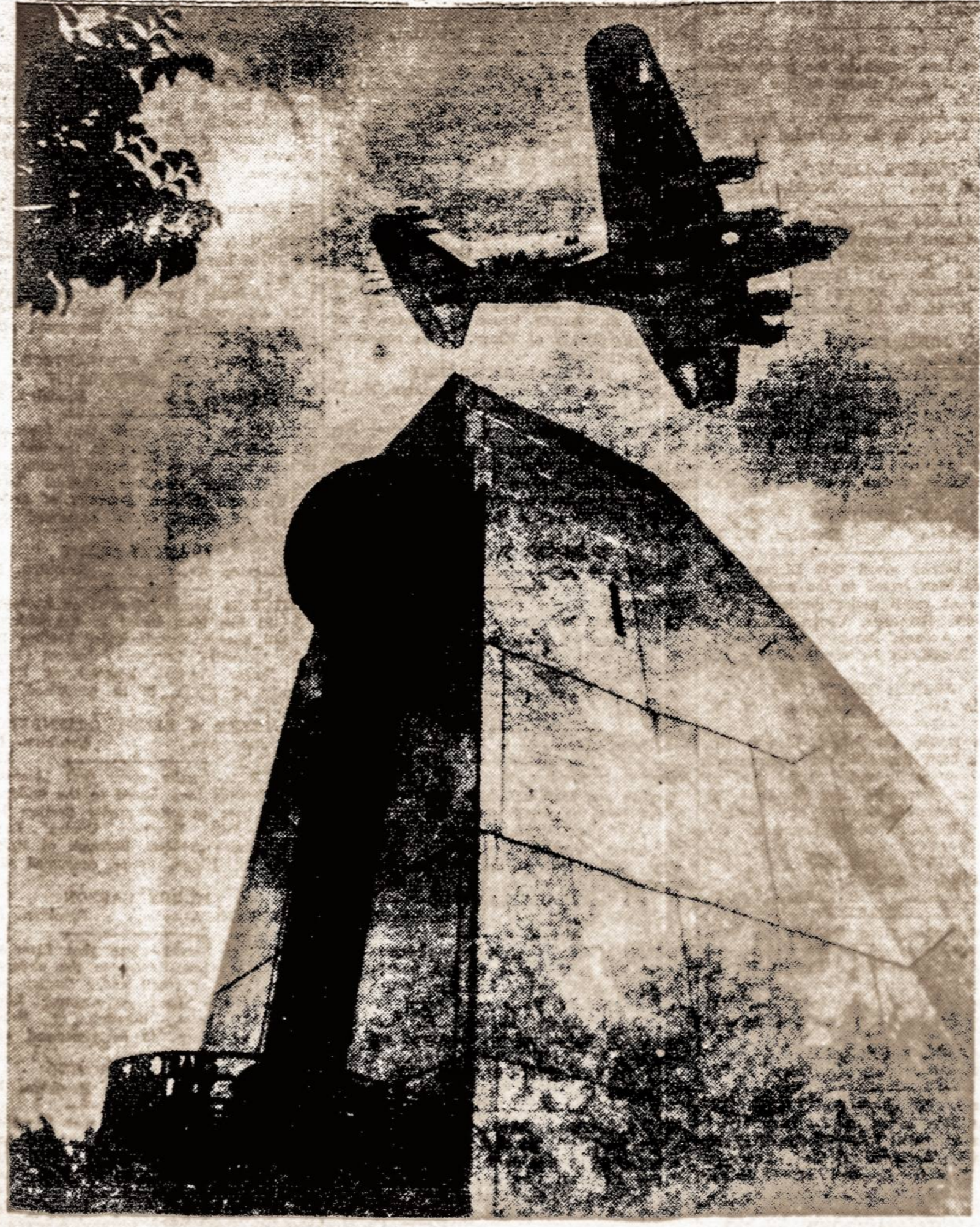
Dariaus ir Girėno paminklas Chicagoje