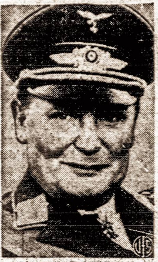
Hermann William Goering

Spalių 1 d. Tarptautinis Karo Tribunalas Nuremberge, Vokietijoje, paskelbė 22 nacių vadų teismo sprendimą. Rezultate, maršalas Goeringas ir 17 kitų nacių vadų pasmerkti pakarti arba kalėti. Trys iš kaltinamųjų, būtent, dr. Hjalmar Schacht, Hans Fritzsche ir Franz von Papen, išteisinti. Nuteisti pakarti šie: Goering, Ribbentrop, maršalas Keitel, Kaltenbrunner, dr. Alfr. Rosenberg, Hans Frank, Fritz Sauckel, gen. Alfred Jodl, Arthur Seyss Inquart ir Julius Streicher. Martin Borman, kuris buvo teisiamas už akių, taip pat pasmerktas pakarti. Švelnesnei bausmei nuteisti šie: Rudolf Hess — iki gyvos galvos, adm. Karl Doenitz — 10 metų kalėjimo, adm. Eric Raeder — iki gyvos galvos, Baldur von Schirach — 20 metų kalėti, Konstantin von Neurath — 15 metų kalėti, Albert Speer — 20 metų kalėti. Nežiūrint to, kad Franz von Papen išteisintas, bet, kaip prašoma, jis nebus paleistas, nes Austrijos teismas jo reikalauja. Austrijoje von Papen bus teisiamas už konspiraciją prieš