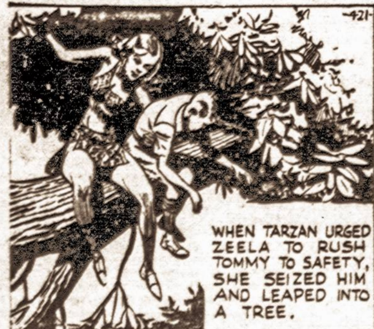
WHEN TARZAN URGED ZEELA TO RUSH TOMMY TO SAFETY, SHE SEIZED HIM AND LEAPED INTO A TREE.