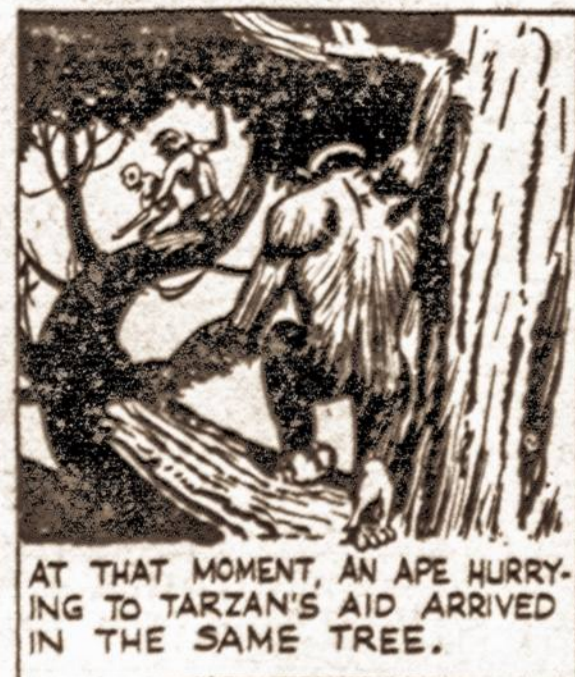
AT THAT MOMENT, AN APE HURRYING TO TARZAN'S AID ARRIVED IN THE SAME TREE.