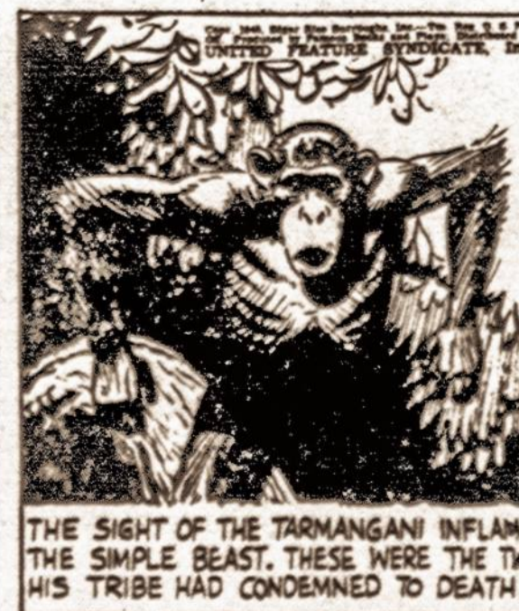
THE SIGHT OF THE TARANGANI INFLAMED THE SIMPLE BEAST, THESE WERE THE TWO HIS TRIBE HAD CONDEMNED TO DEATH!