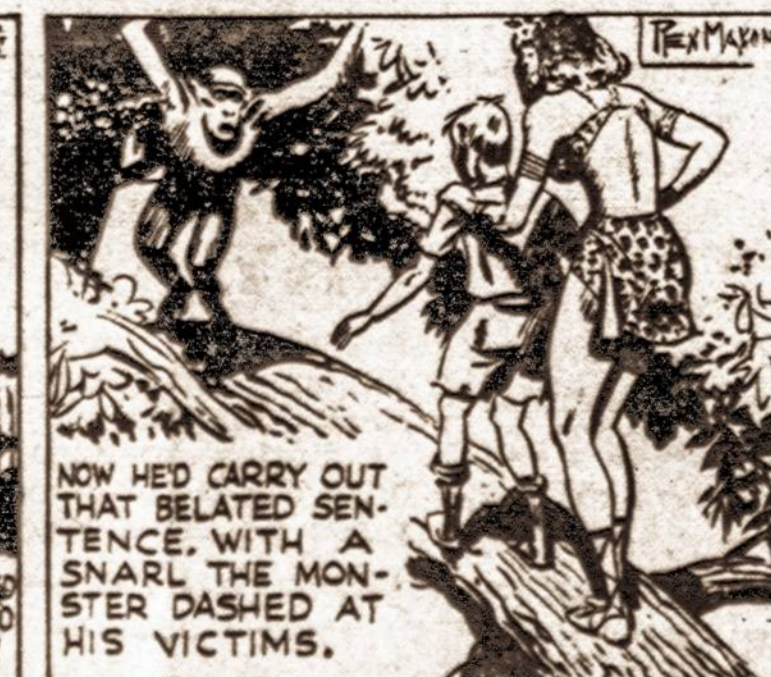
NOW HE'D CARRY OUT THAT BELATED SENTENCE, WITH A SNARL THE MONSTER DASHED AT HIS VICTIMS.