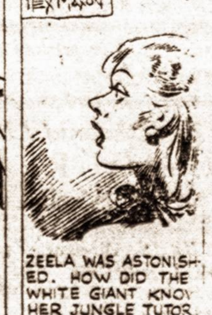
ZEELA WAS ASTONISHED. HOW DID THE WHITE GIANT KNOW HER JUNGLE TUTOR.

Kas bus coliau — žiūrėkite ki'ame Vienybės numerį