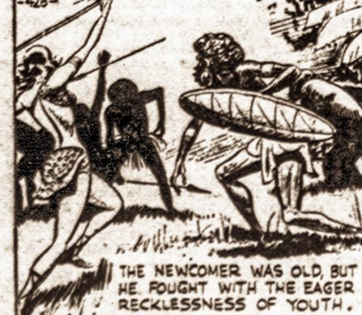
THE NEWCOMER WAS OLD, BUT HE FOUGHT WITH THE EAGER RECKLESSNESS OF YOUTH.

Visi šie laidotuvių direktoriai išnuomoja automobilius įvairiems reikalingams