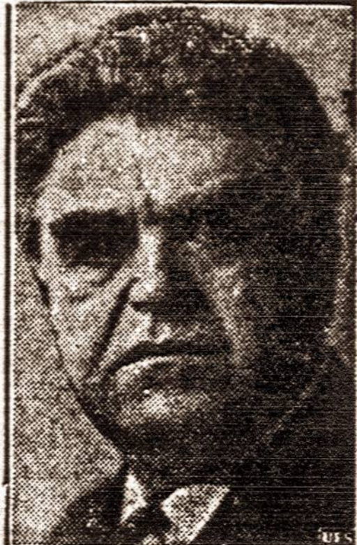
John L. Lewis

Bet kadangi vyriausybė ši streiką laiko "streiku prieš valdžia", todėl, rezultate, einant tam tikru ištatymu, angliakasių