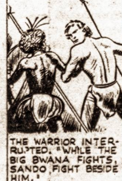
THE WARRIOR INTERRUPTED. "WHILE THE BIG SWANA FIGHTS, SANDO FIGHT BESIDE HIM."