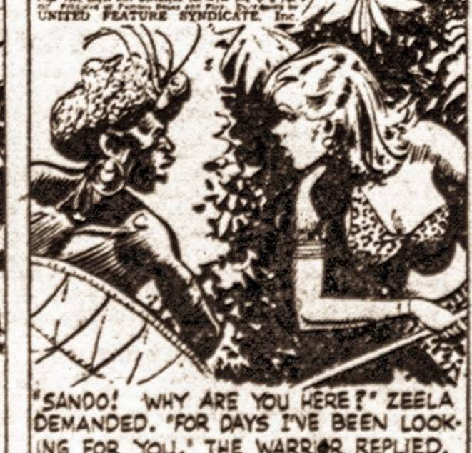
"SANDO! WHY ARE YOU HERE?" ZEELA DEMANDED. "FOR DAYS I'VE BEEN LOOKING FOR YOU," THE WARRIOR REPLIED.