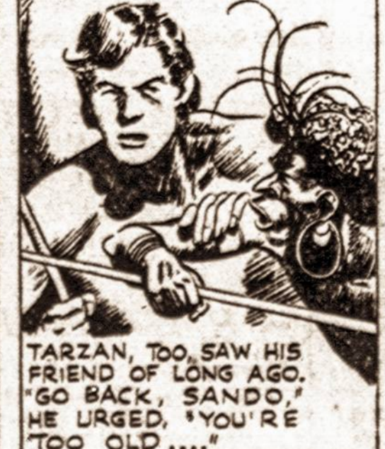
TARZAN, TOO, SAW HIS FRIEND OF LONG AGO. "GO BACK, SANDO," HE URGED, "YOU'RE TOO OLD...."