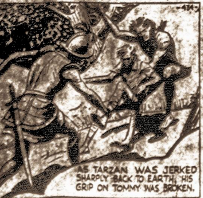
AS TARZAN WAS JERKED SHARPLY BACK TO EARTH, HIS GRIP ON TOMMY WAS BROKEN.