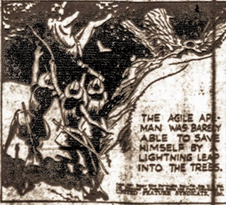
THE AGILE AP-MAN WAS BARELY ABLE TO SAVE HIMSELF BY A LIGHTNING LEAP INTO THE TREES.