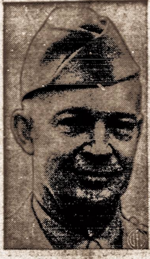
Gen. Dwight D. Eisenhower

Washington Time-Herald praneša, kad gen. Eisenhoweris, vyr. štabo viršininkas, kuris šiuo metu lisis Coral Gables, Florida, išplankęs i jūrą meskerioti, pareiškė, kad „jeigu krašto visuomenė norės“, tai jis sutiksias 1948 m. kandidatuoti prezidento pareigoms. Jau pirmiau Washingtono buvo skleidžiami gandai, kad gen. Eisenhoweris būsiąs demokratų kandidatas i prezidentus.