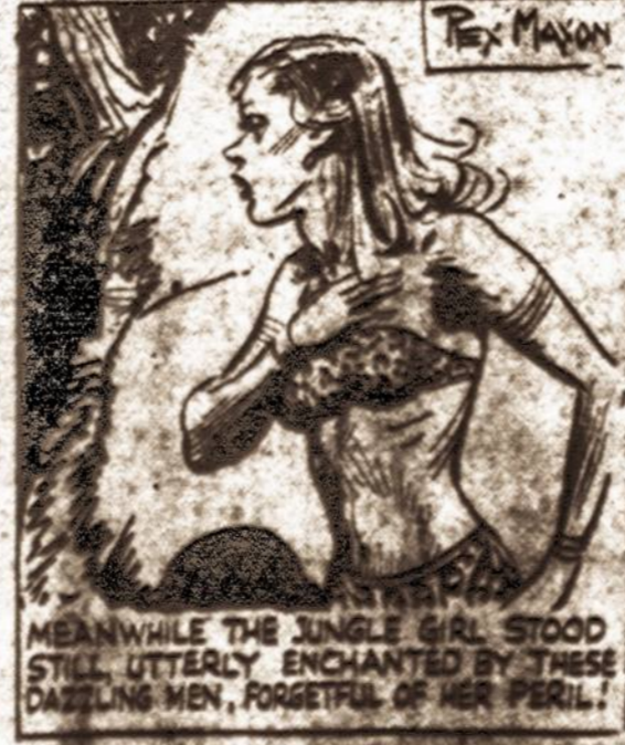
MEANWHILE THE SINGLE GIRL STOOD STILL, UTTERLY ENCHANTED BY THESE DAZZLING MEN, FORGETFUL OF HER PERIL!

Grūdamas atbulas, Tarzanas turėjo paleisti iš rankų Tommy. Jis, kaip žinoma, norėjo išvengti pavojaus ir medži-barontas karys. Kaip matyti iš nuotraukos, kaip matyti iš nuotraukos, kaip matyti iš nuotraukos.