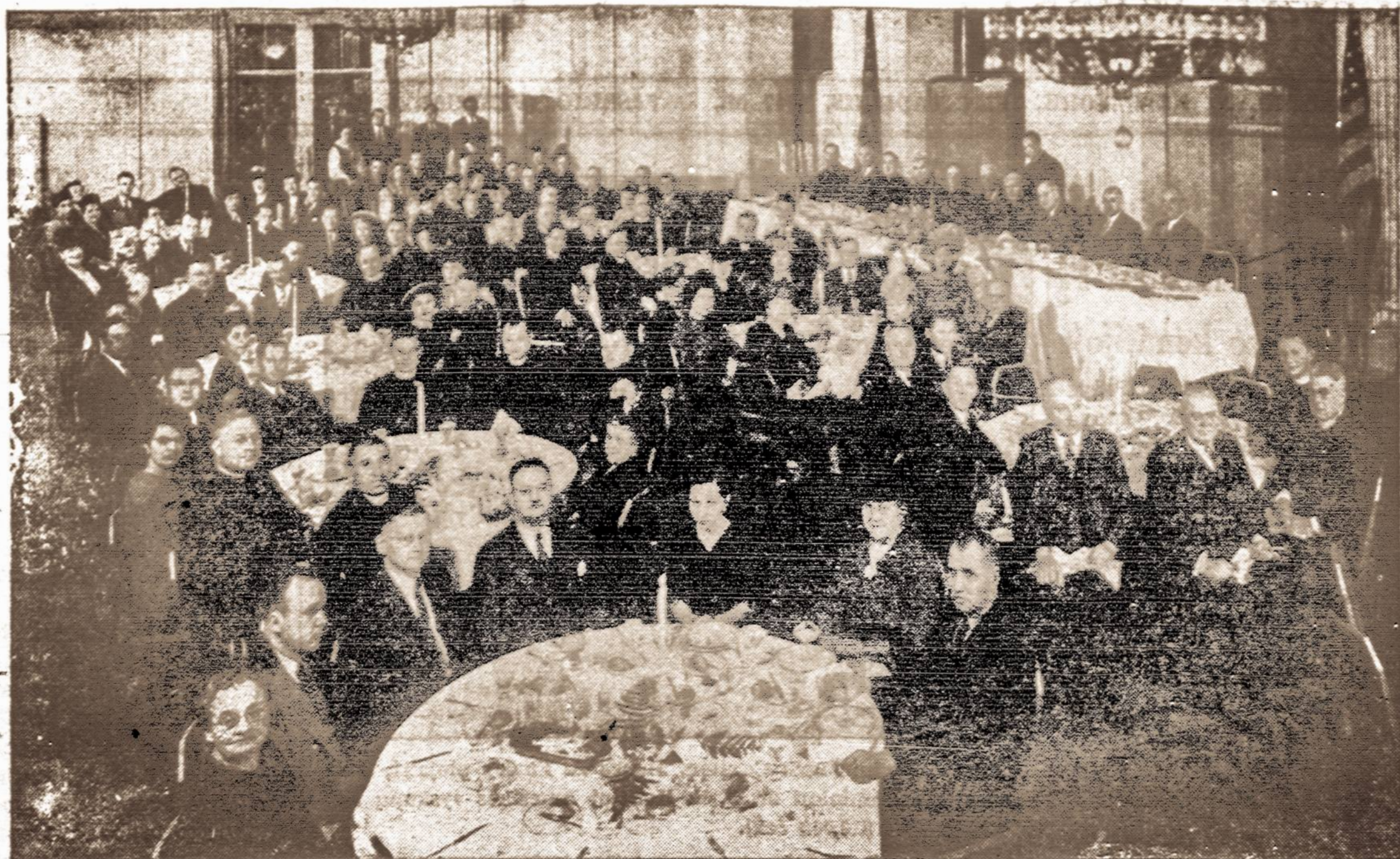
BALF vajuos oficialus atidarymas sausio 24 d. New York'e Waldorf Astoria viešbutyje, Astor Gallery kambaryje, dalyvaujant BALF vajuos garbės p̄rmininkui James A. Farley ir kt.