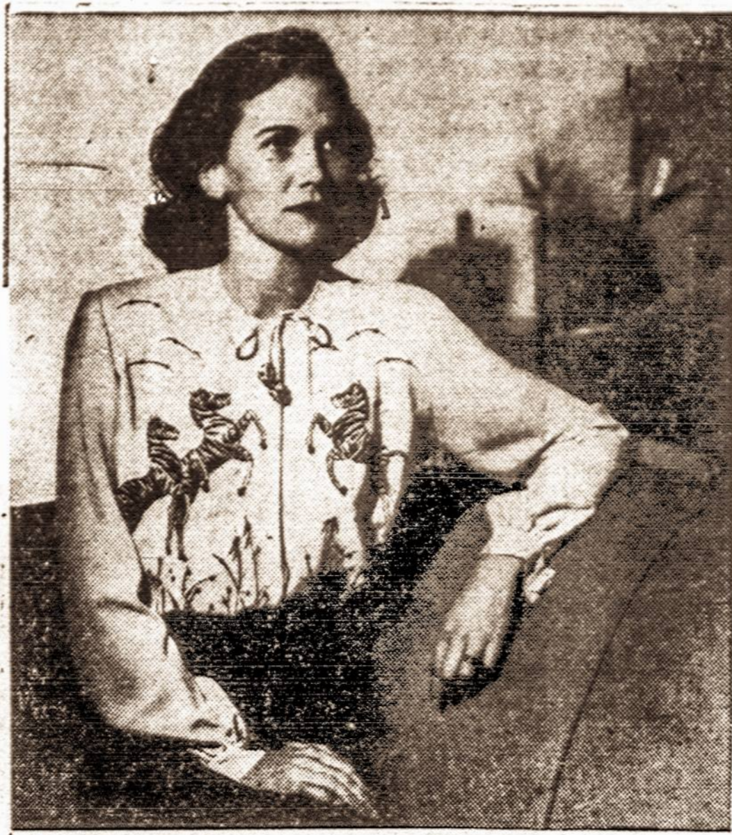
Teresa Wright, Hollywoodo artistė, parodo gražią bilūzę, ant kurios nupieštos trys zebros. Tokios bilūzės, prieš tamsaus kostiumo, dabar labai madoj.

Kai kas panašiai iškepus bananus duoda stalan su kiaušiniene, kuri padaroma iš pieno ir kiaušinių. Kiekvienam puodeiui pieno reikia dėti du kiaušinius. Gerai suplakti ir kepti nekarštame pečiulyje. Bananus duodant valgyti su kiaušiniene, nereikia ant bananų kepsnio pilti iš miltų padarytos tyrelės.