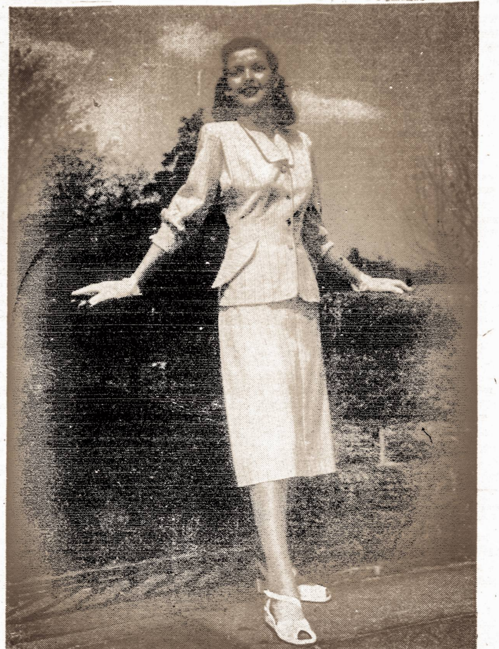
Gražus vasarai dryžuotas kostiumas