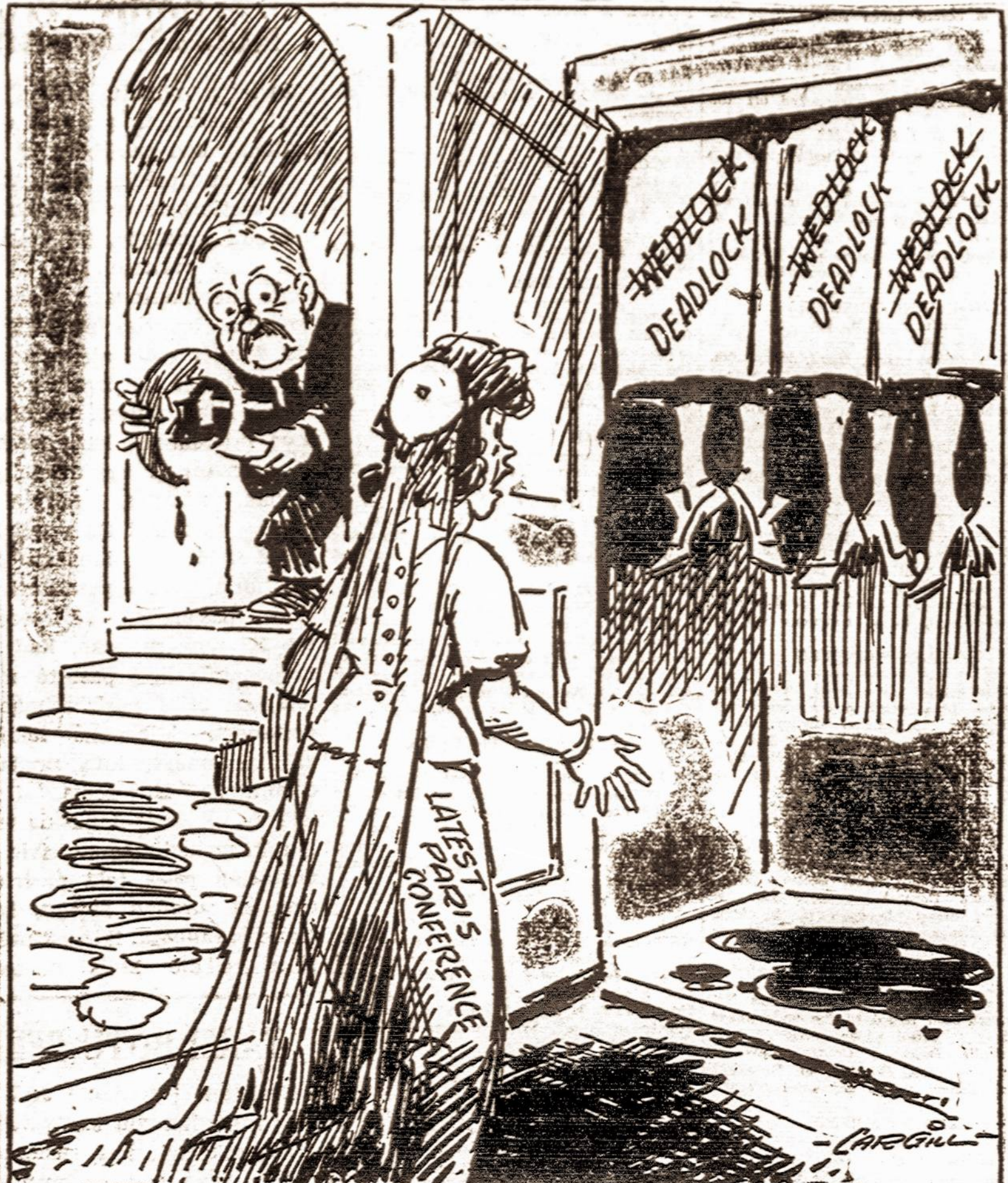
„MAZIEJI“ IR „DIDIEJI“

Stalino svajonės, kaip dabar matyti, buvo tuščios, o Amerika čia ekonominiams gerovės keliui. Šiuo atveju Amerika iš tikrųjų yra rojus, palyginti su Sovietų Rusija, kur, tiesa, vis dar bininkai dirba, bet... nieko ne uždriba. Sakoma, kad už savo savaitinę algą Sovietų Sąjungos darbininkas gali nusipirkti 23 kepalėlius duonos, arba 16 kvortų pieno. Tuo tarpu Amerikos darbininkas, gavęs savaitės uždarbį, gali nusipirkti 390 kepalėlių duonos, arba 275 kvortas pieno.