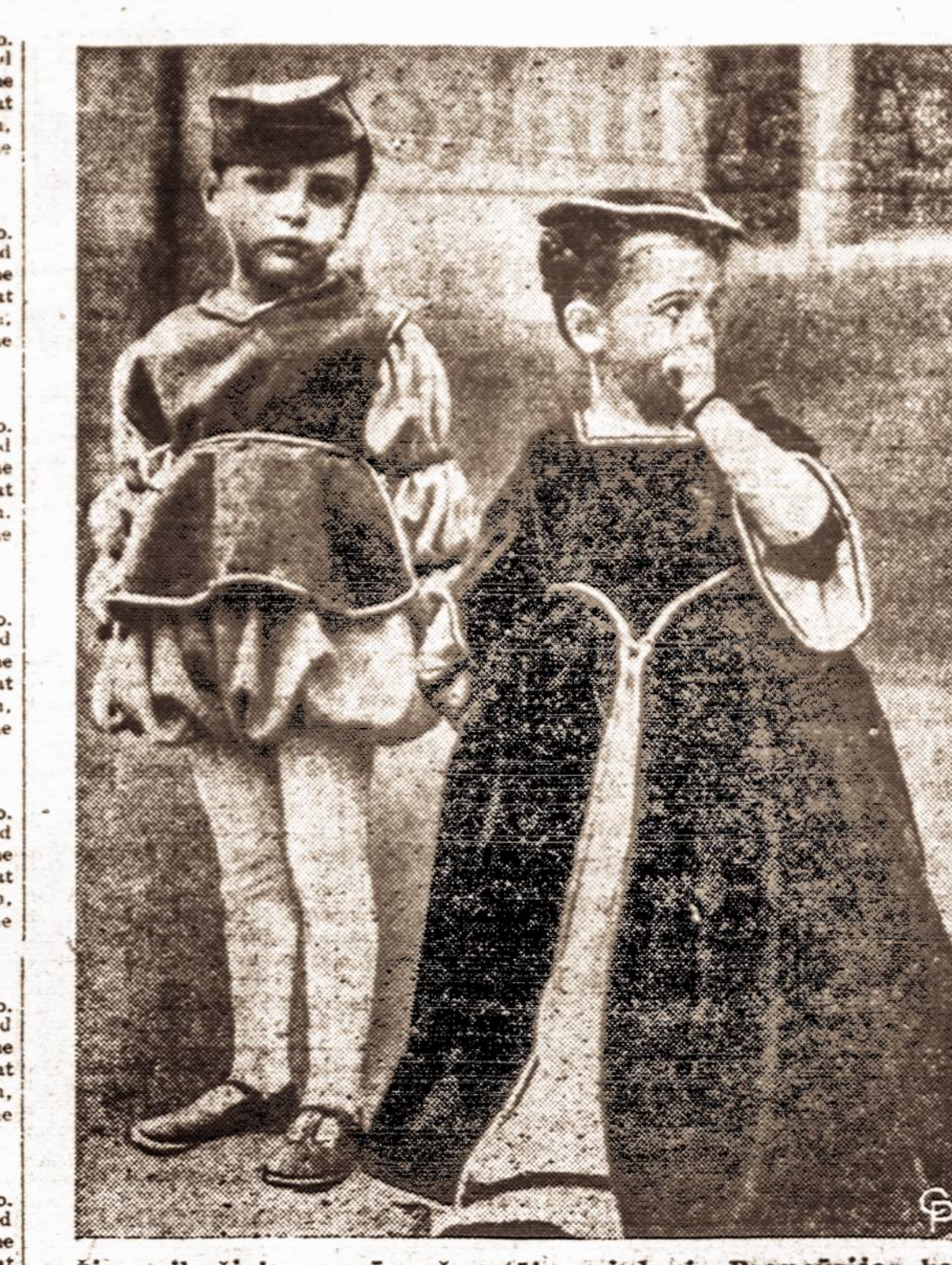
Šie vaikučiai prancūzų šventėje vaizduoja Prancūzijos karalių Henriek III ir jo karalienę.

NOTICE is hereby given that License No. GB 2227 has been issued to the undersigned to sell beer at retail under Section 107 of the Alcoholic Beverage Control Law at 2416 - 5th Avenue, Borough of Brooklyn, County of Kings, to be consumed off the premises. JOSEPH SCHWARTZ