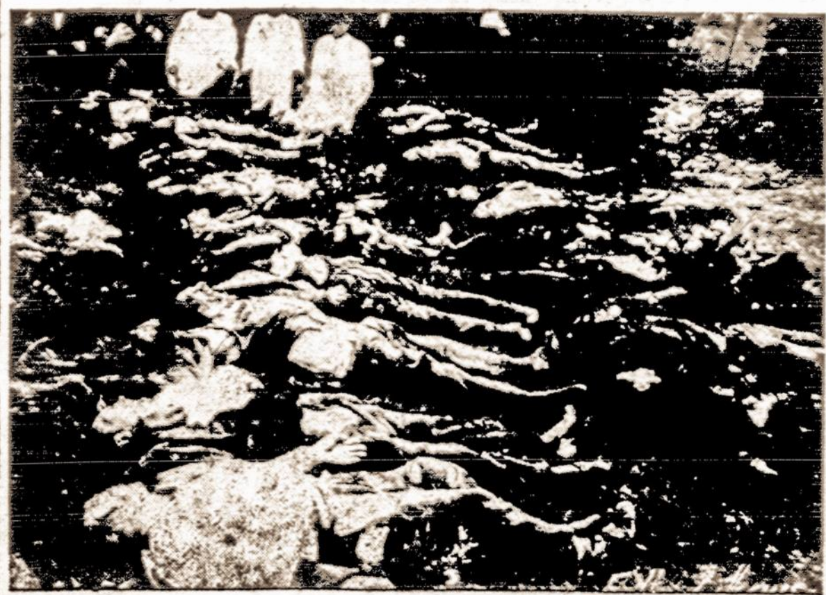
Vaidai iš Pravieniškų žudynių.

Ten prieš 6 metus bolševikai išžudė 400 lietuvių