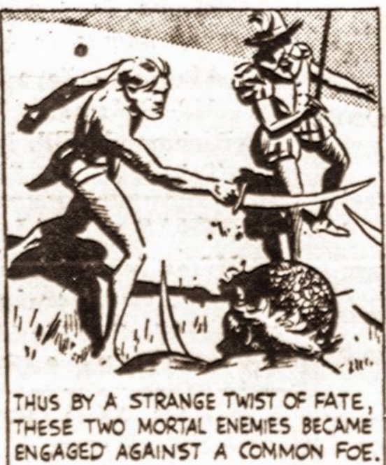
THUS BY A STRANGE TWIST OF FATE, THESE TWO MORTAL ENEMIES BECAME ENGAGED AGAINST A COMMON FOE.