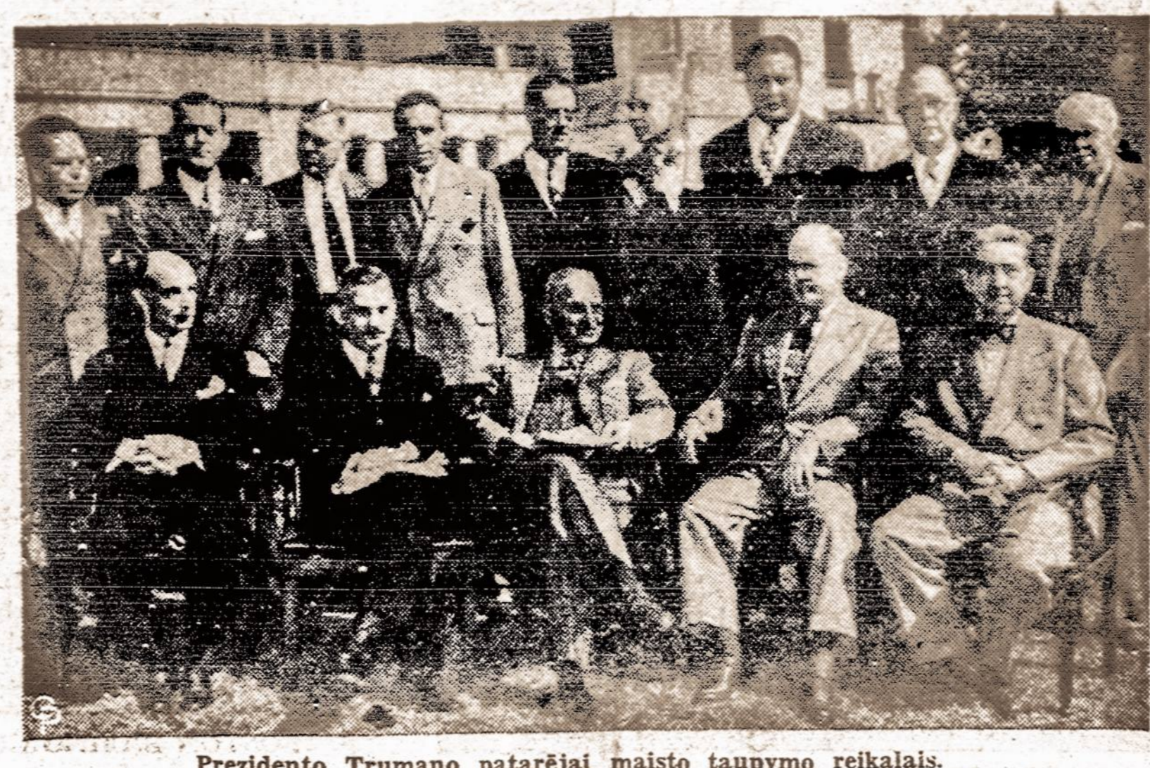
Prezidento Trumano patarėjai maisto taupymo reikalais.

Amerikos spaudai praneša, kad buvęs Lietuvos prem. jeras gen. Jonas Černius su žmona ir 17 metų sūnum gy- vena ir dirba viename ūkyje Anglijoje, Kent provincijoje. Gen. Černius, kuris 1943 me- tų buvo tremtinių stovyklose, Vokietijoje, dabar džiaugiasi esąs laisvas ir gali gyventi su šeima. Prieš keletą savaičių, kartu su kitais lietuviais tremtiniais, gen. Jonas Černius atvyko į An- gliją ir tuojau gavo darbą ū- kyje. Gen. Černius dabar 49 metų amžiaus. Rašydami apie gen. Černių, daugelis Amerikos laikraščių į- sidėjo į pavelskį kario uni- formoje, pažymėdami, kad jis taip pat yra buvęs Lietuvos kariuomenės vyriausiojo štabo viršininkas.