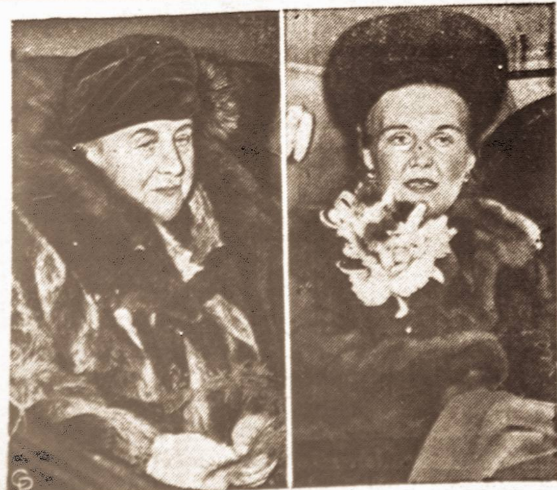
Olandijos karalienė Vilhelmina (kairėje) sulaukusi 67 m. amžiaus, karūną perleido princesei Julijonai.

„Visiems savo pažįstamiems palikusiems vakarų Vokietijoje iš širdies patariu padaryti tą pat, ką aš su dukra padariau, grįžti į savo tėvynę.“