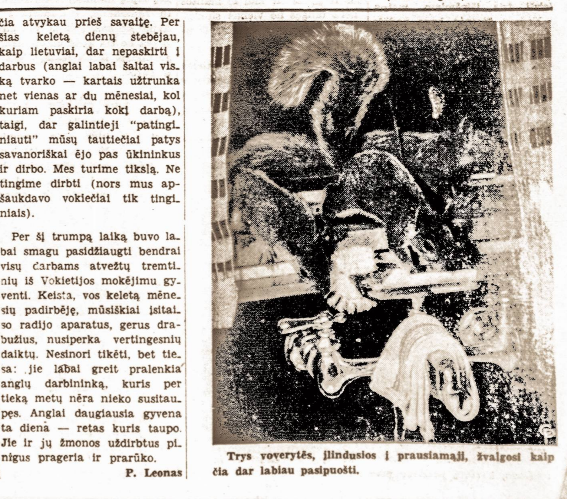
Trys voverytės, įlindusios į prausiamąjį, žvalgosi kaip čia dar labiau pasipuosti.