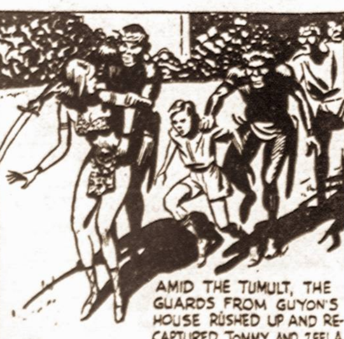
AMID THE TUMULT, THE GUARDS FROM GUYON'S HOUSE RUSHED UP AND RECAPTURED TOMMY AND TEELEA.