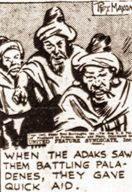
WHEN THE ADAKS SAW THEM BATTLING PALADENES, THEY GAVE QUICK AID.