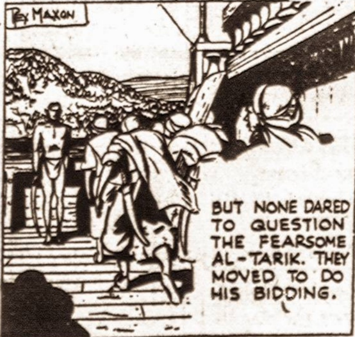
BUT NONE DARED TO QUESTION THE FEARSOME AL-TARIK. THEY MOVED TO DO HIS BIDDING.

Netikėtas Tarzano atsiskykymas bet ką bendra turėti su despotišku laivo kapitonu, pastarojo širdy sukėlė baisią audrą. AL-Tarik veidas užsidėgė keršto liepsna prieš Tarzaną.