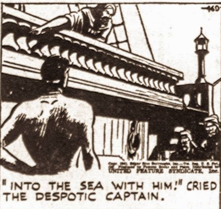
"INTO THE SEA WITH HIM!" CRIED THE DESPOTIC CAPTAIN.