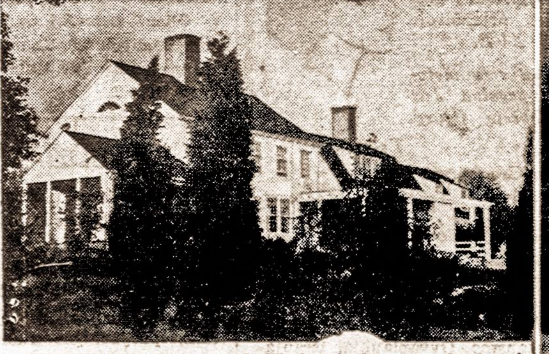
Kai Helen Keller namai, Westport, Conn., sudėgė, tai šios nebylės ir aklos rašytojos draugai, susidėję, pasta-tė jai naujus, matomus šiame paveiksle. Kairėje mato ma pati rašytoja, H. Keller, skutanti bulves vakarienei.