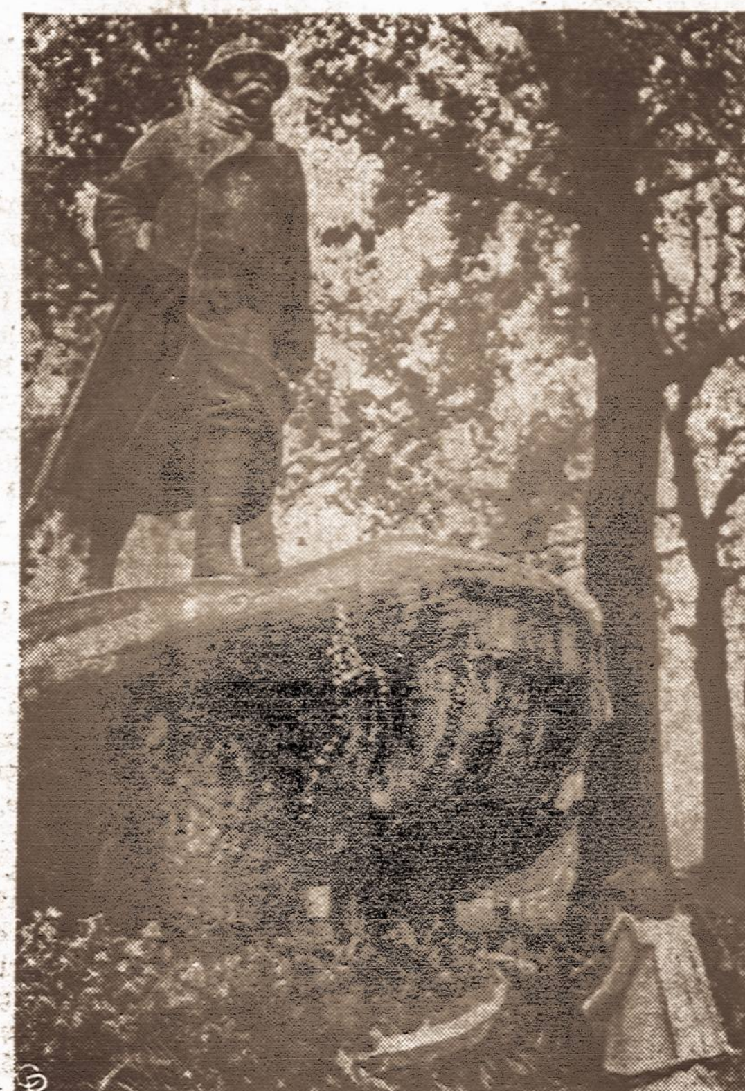
Mergaitė pagerbia didįjį Prancūzijos valstybės vyrą George Clemenceau, padėdamą jo paminklo papėdėje, Paryžiuje, gėlių puokštė.