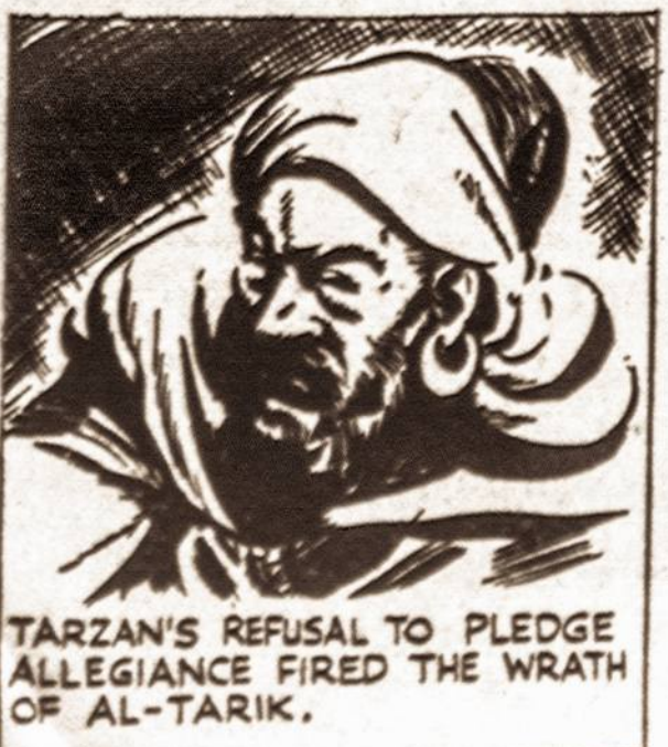
TARZAN'S REFUSAL TO PLEDGE ALLEGIANCE FIRED THE WRATH OF AL-TARIK.