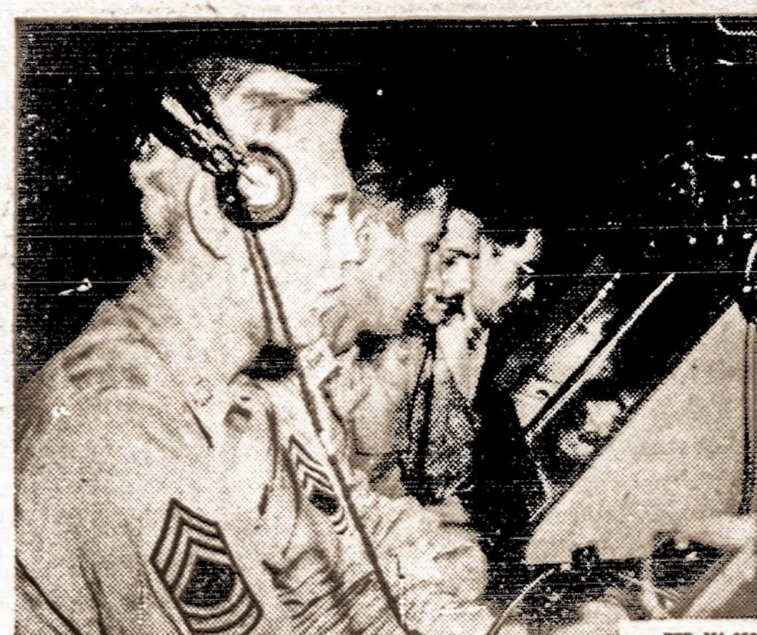
Ši aparatą dabar naudoja Amerikos lakūnai, kurie, ra. daro pa' galba, gali nusileisti su lėktuvu be pavojaus, nors būty ir ir blogiausias oras.