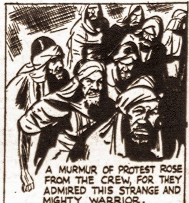
A MURMUR OF PROTEST ROSE FROM THE CREW, FOR THEY ADMIRERD THIS STRANGE AND MIGHTY WARRIOR.