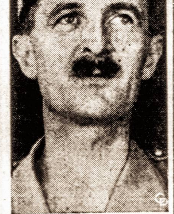
GEN. JACQUES LE CLERC, vienas iš žymiausių prancūzų militarinų vadų antrojo pasaulio karo metu, šiomis dienomis žuvo Afrikoje, nukritus iš sudegus bomberniui Saharoje.

—Dar vienas "cominform" susidarė Rytinėje Azijoje. Į jį įeis 7 Tolimųjų Rytų valstybių komunistų partijos.