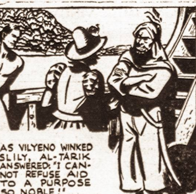
AS VILYENO WINKED SLILY, AL-TARIK ANSWERED: "I CAN NOT REFUSE AID TO A PURPOSE SO NOBLE!"