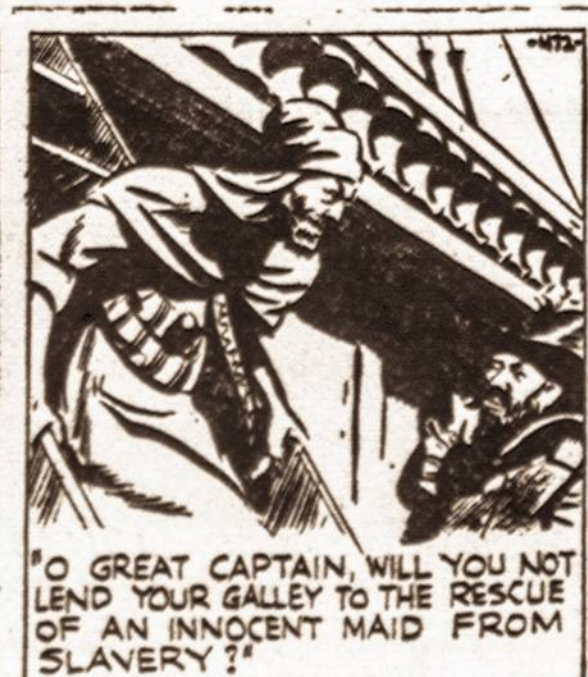
"O GREAT CAPTAIN, WILL YOU NOT LEND YOUR GALLEY TO THE RESCUE OF AN INNOCENT MAID FROM SLAVERY?"