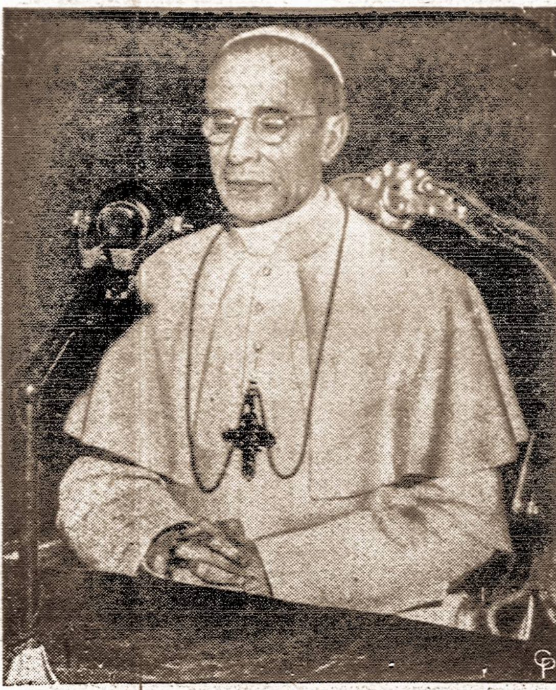
Popiežius Pijus XII šiomis dienomis pasakė radijo kalbą, kurioje jis kreipėsi į Amerikos katalikus, ragindamas juos dosniai aukoti badaujantiems Europos gyventojams.