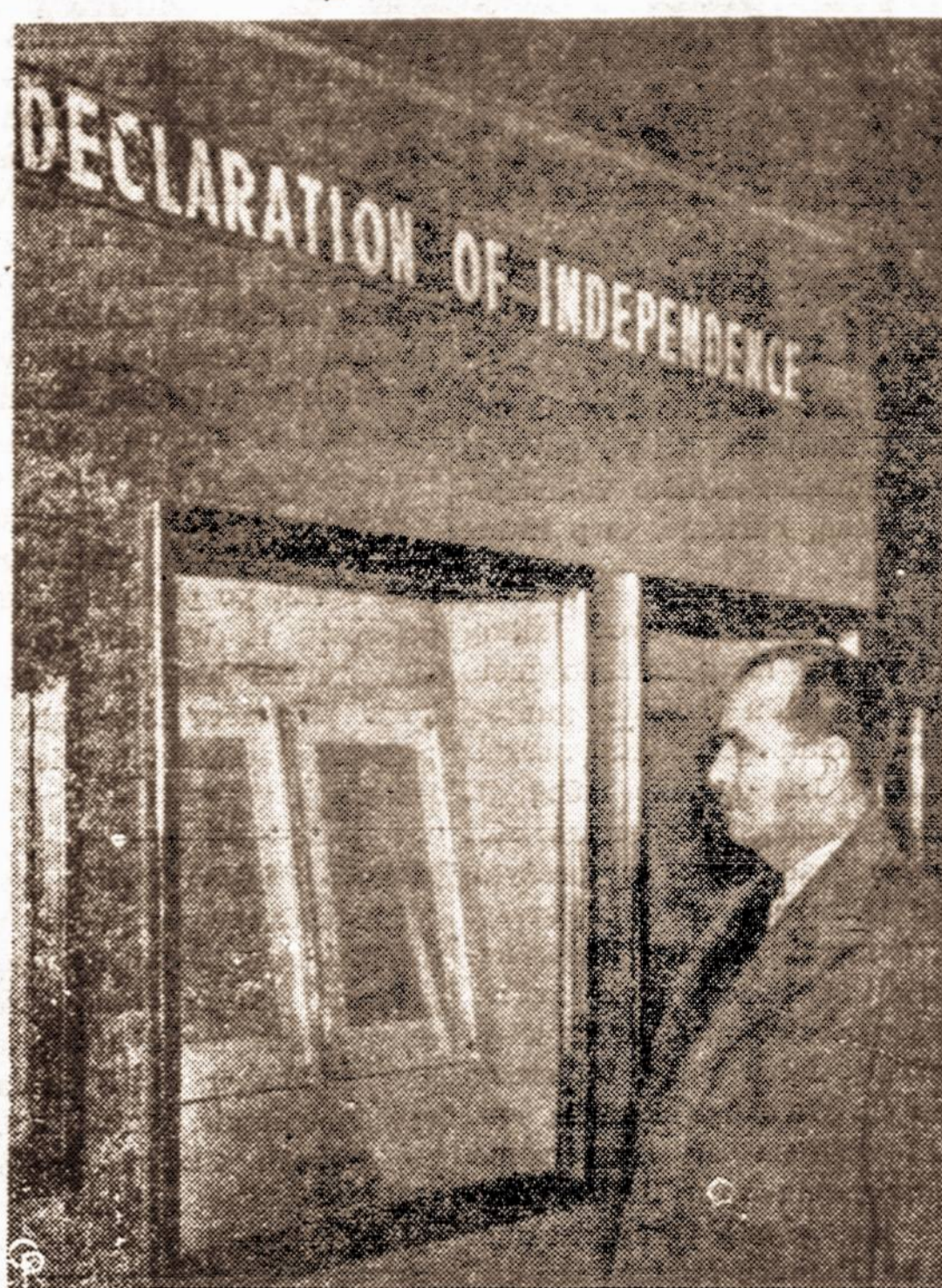
Atstovų Būto pirmininkas Joseph W. Martin lankosi "laisvės traukinyje," Washingtone.

JAV suvartoja 45 proc. viso pasaulio metalo produkcijos.