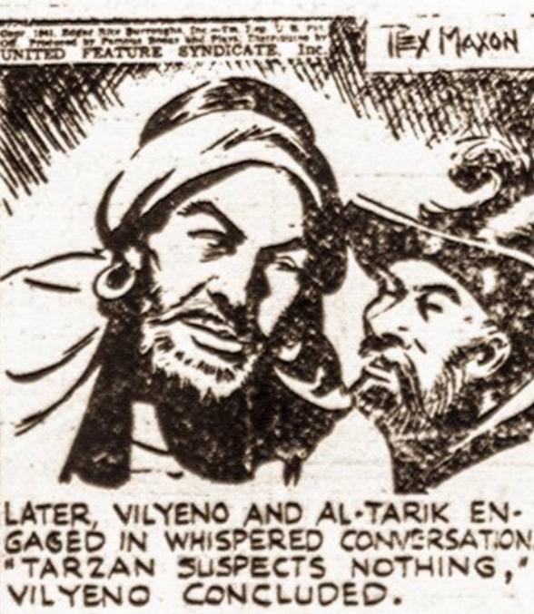
LATER, VILYENO AND AL-TARIK ENGAGED IN WHISPERED CONVERSATION. "TARZAN SUSPECTS NOTHING," VILYENO CONCLUDED.

Papasakojęs savo planą, kokiū būdu būtų galima išgelbėti Tarzelę, esančią vergų laive, Vileinas dabar kreipėsi į Al-Tariką, prašydamas jo pagalbos šiam sumanymui įvykdyti.