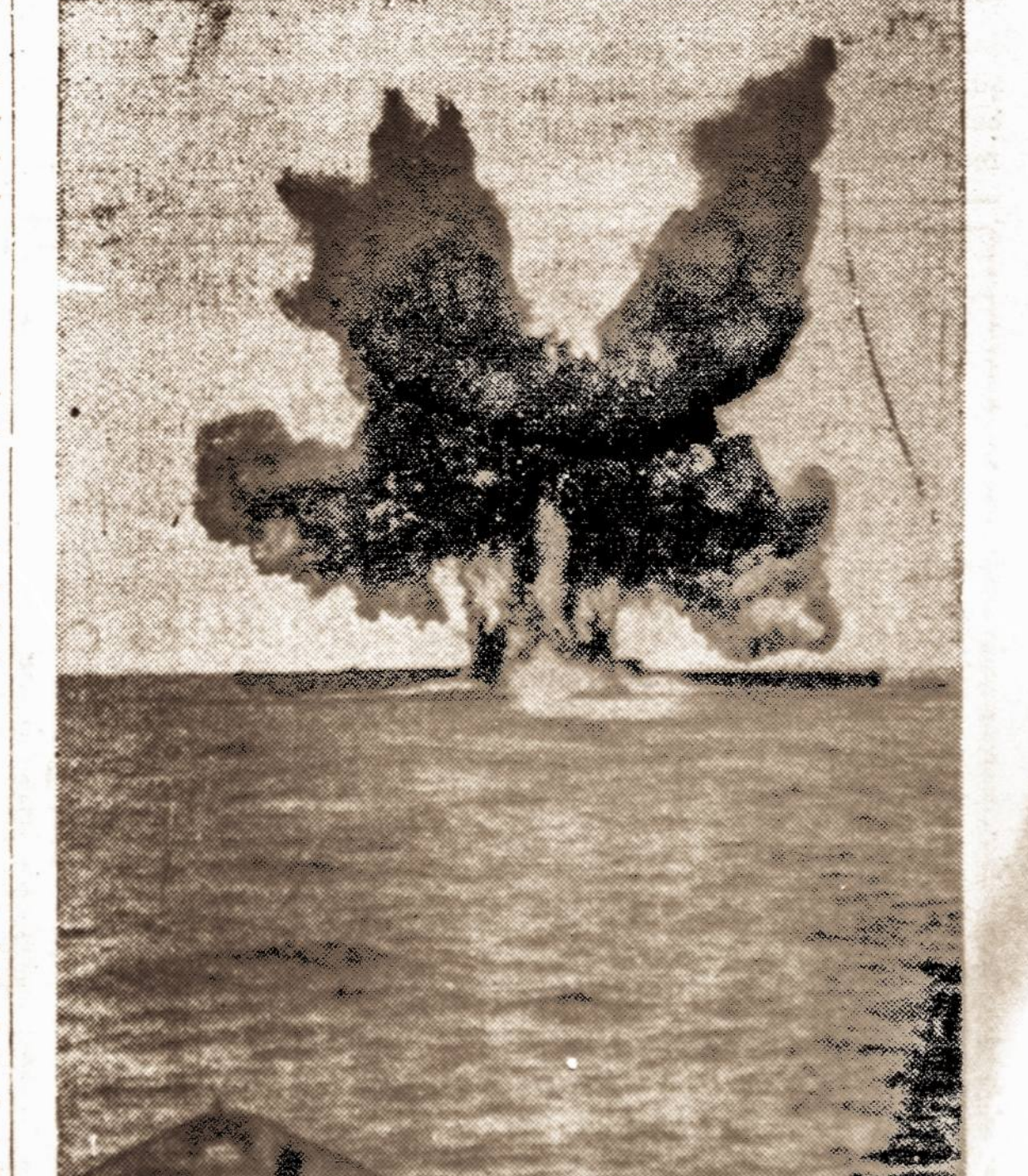
Naujo tipo, amerikiečių išrasta, torpėda efektingai sušprogdina submariną. Šiuos bandymus Amerikos laivynas darė su keturiais vokiečių submariniais, netoli Cape Cod, Mass. valstybėje.

Washingtono kariniuose sluogsnuose reiškiami baimės, kad užsitiesio arabų šventojų karo atveju, sovietai gali banuoti įsikšti į Palestinos reikalcijos pataisą, pagal kurią valdžią būtų suteikta skirti Atstovų Buto narius į žuvusiųjų vietą. Aplamai, jis siūlo valdžios ir legislatiūros decentralizacijos