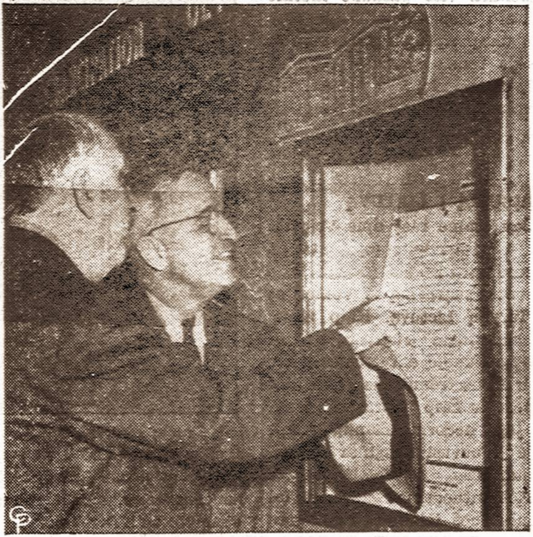
Prezidentas Trumanas su Fred M. Vinson, vyriausioju JAV teisėju, lanko Laisvės traukinį.