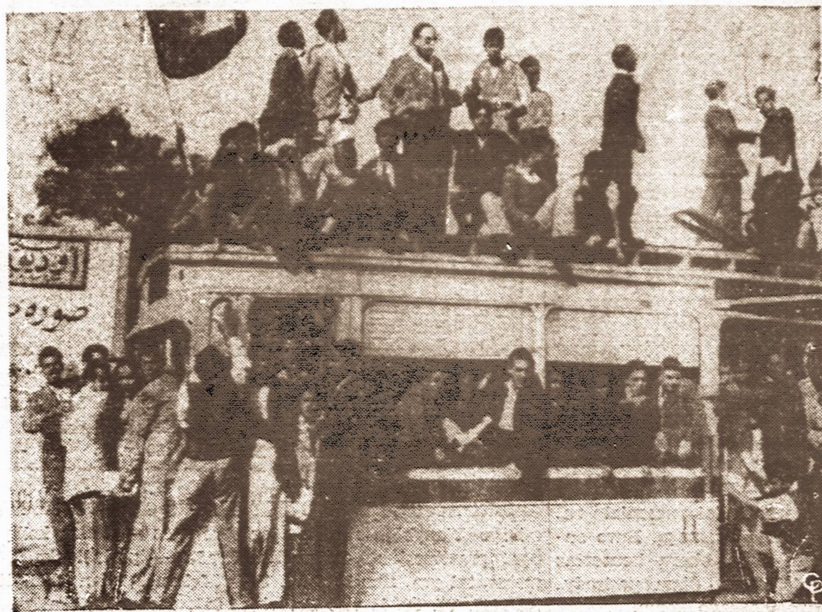
Kaire, Egipte, studentai kelia riaušes dėl Palestinos padalinimo.

Tuo tarpu arabai kaimyniuose kraštuose taip pat nerimsta. Pavyzdžiui, Kaire, Egipte, vyksta septynių arabiskų kraštų atstovų konferencija, kurioje tariamasi, kaip padėti kovojantiems Palestinos arabams. Toje konferencijoje prieta išvados, kad geriau testti šventąjį karą ir priešintis persvarą turintiems armijoms, negu priimti Palestinos padalinimo planą. Šiam planui griežtai priešina si šios arabų valstybės: Iranas, Irakas, Egiptas, Sirija, Saudi Arabija, Libanas ir Jemenas.