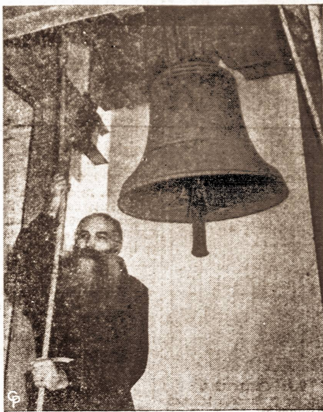
Kalėdų naktį šis vienuolis, kilimo amerikietis, skambins Betlejeus bažnyčios varpu, Palestinoje. Tą naktį šio varpo garsai bus perduoti per radiją visam pasauliui.