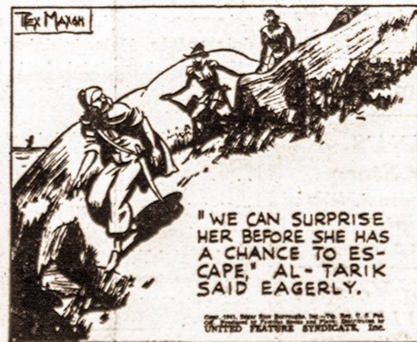
"WE CAN SURPRISE HER BEFORE SHE HAS A CHANCE TO ESCAPE," AL-TARIK SAID EAGERLY.