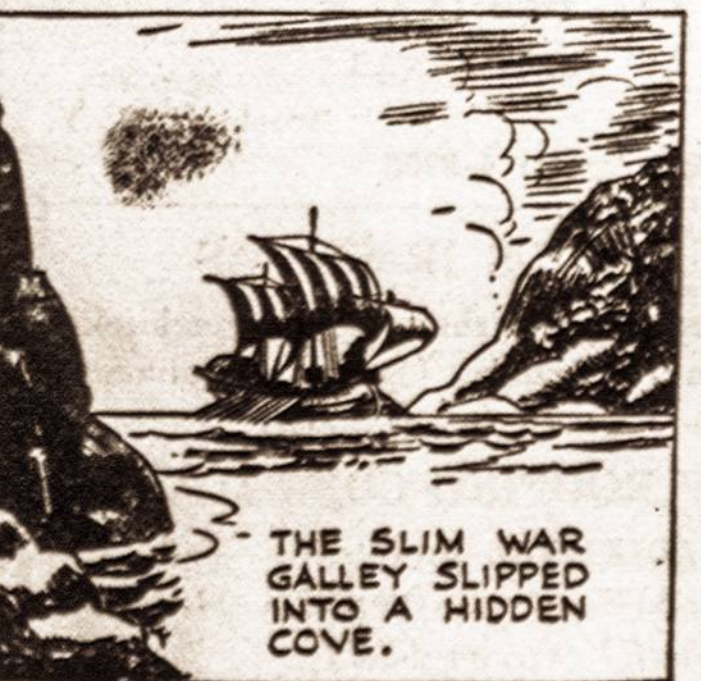
THE SLIM WAR GALLEY SLIPPED INTO A HIDDEN COVE.