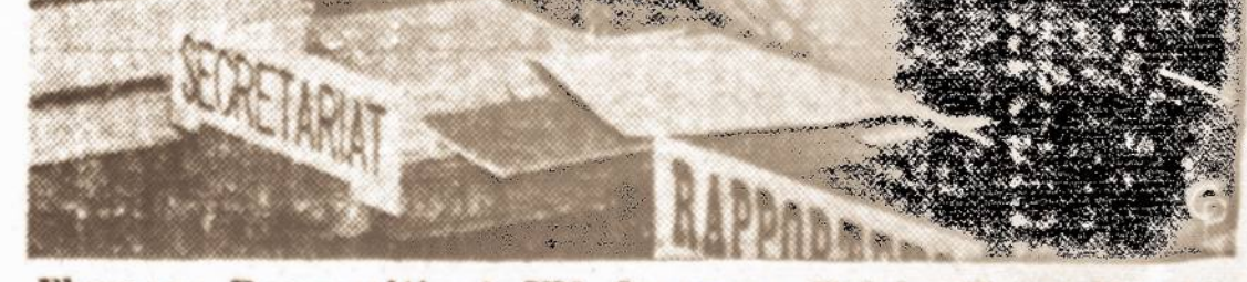
Eleonora Rooseveltienė UN Žmogaus Teisių Komisijos posėdyje, Genevoje, Šveicarijoje.