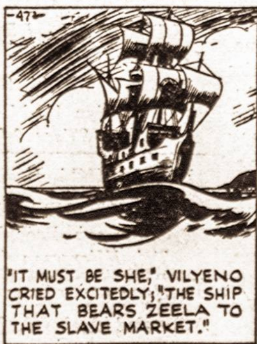
"IT MUST BE SHE," VILYENO CRIED EXCITEDLY, "THE SHIP THAT BEARS ZEELA TO THE SLAVE MARKET."