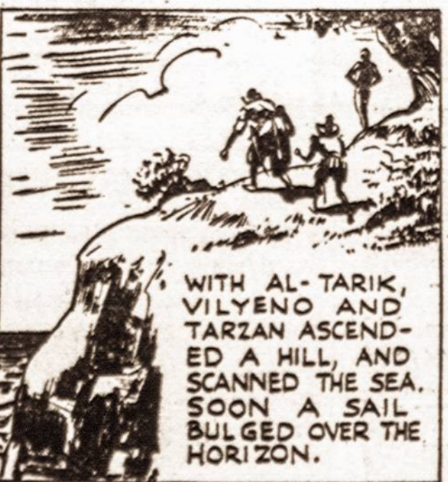
WITH AL-TARIK, VILYENO AND TARZAN ASCENDED A HILL, AND SCANNED THE SEA. SOON A SAIL BULGED OVER THE HORIZON.