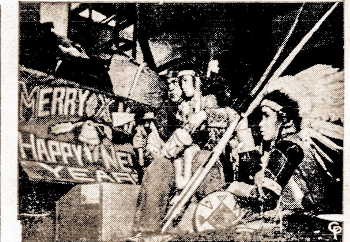
Tai Indėnų Misija Chicagoje, kuriai įsakta per 24 valandas išsikraustyti iš buto. Tarp savo daiktų, jie turi ir tokių užrašų: Linksmų Kalėdų ir laimingų Naujų Metų. Uėja, šių metų šventės dėl to jiems gali būti ir nelinksmos.

S. BULOTA Batai ir Vyras Aprėdalai NEW PHILADELPHIA, PA. P. O. SILVER CREEK, PA.