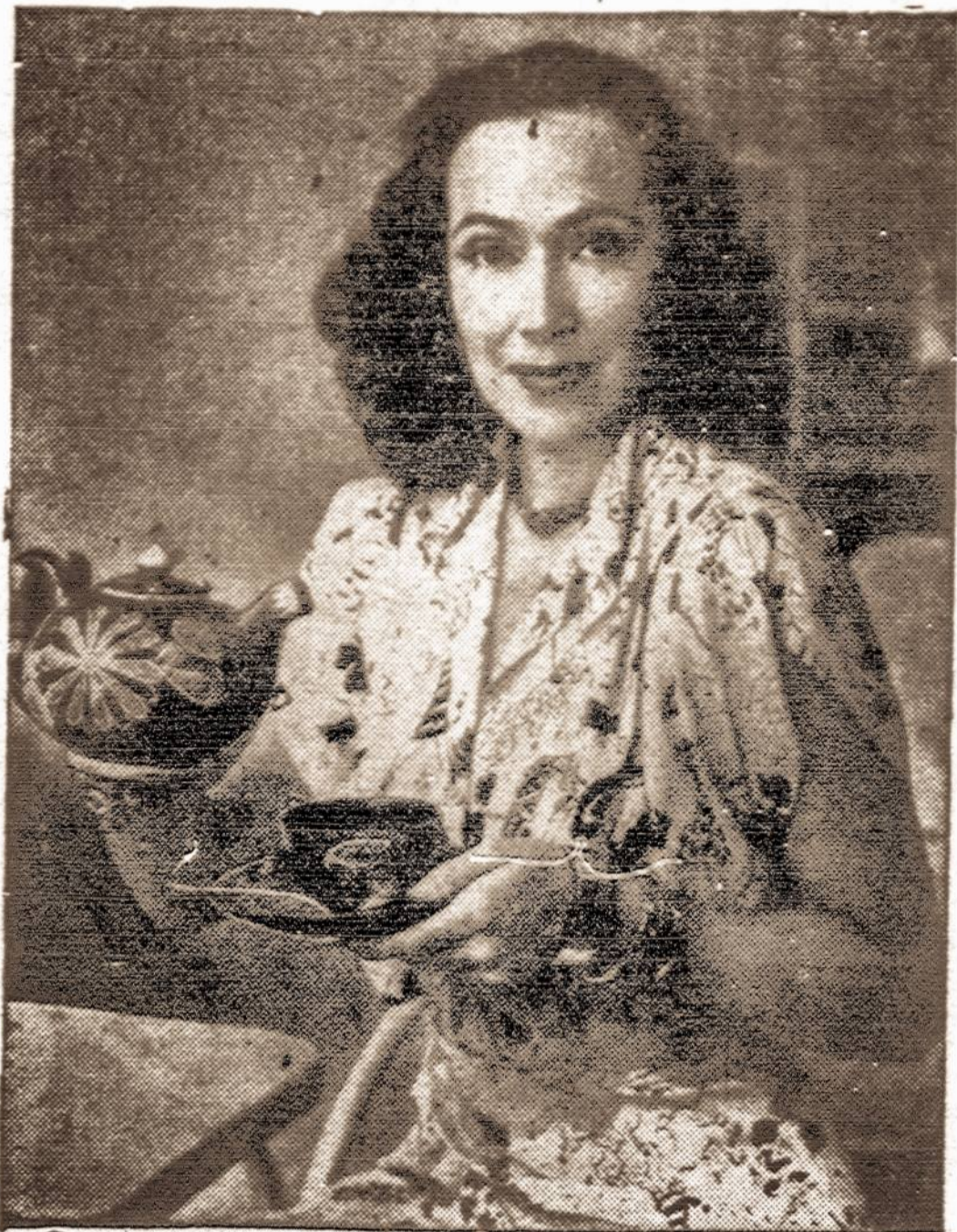
Priimti ir vaišinti svečius yra menas, reikalaujantis nemaža patyrimo, sako artistė Dolores Del Rio, kuri čia nuotraukta arbatėlis metu jos namuose.

Dabar bereikia tiklatai viską sudėti ant stalo, galvoja ji ir sukrausto valgius ir indus. Pristraukia dar vieną suolą — šėsi žmonės gali laisvai sėdėti prie šito stalo, ir ji kiekvienam paskiria vietą, prisimena