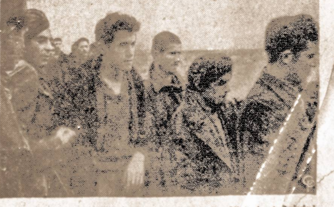
Graikija vis dar kovoja su komunistais. Vėrsuje keltiniai puola partizanų pozicijas. Apačioje: partizanai, žinti nelaisvę.