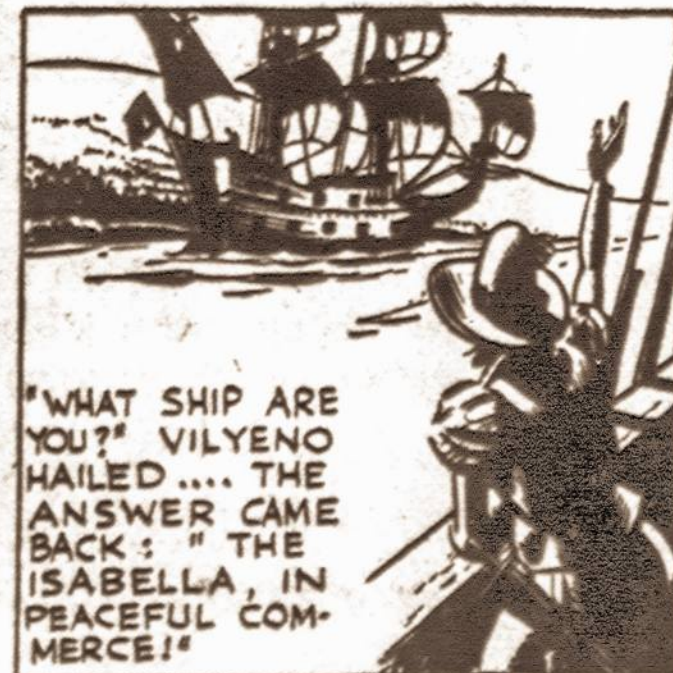
"WHAT SHIP ARE YOU?" VILYENO HAILED... THE ANSWER CAME BACK: "THE ISABELLA, IN PEACEFUL COMMERCE!"