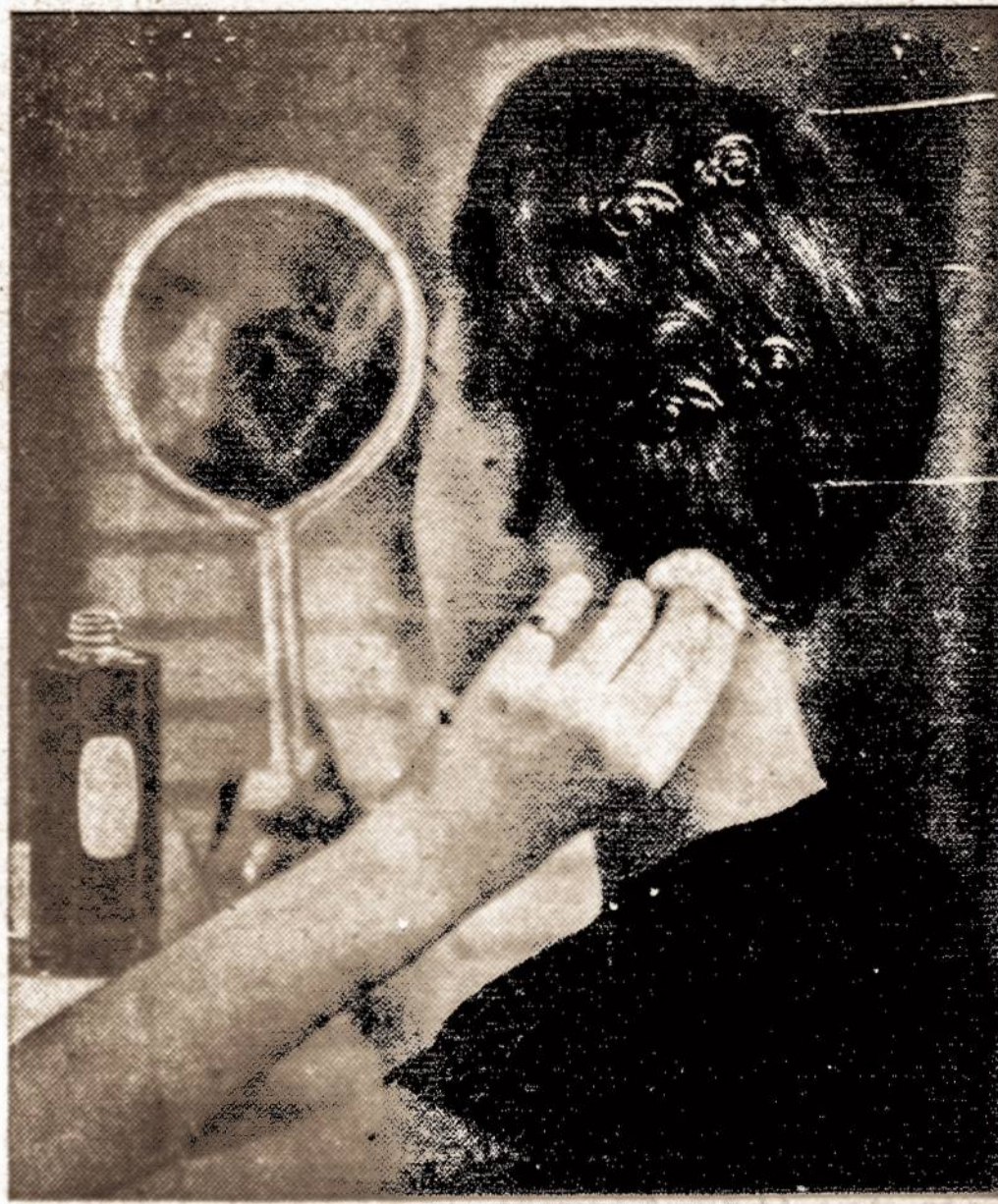
Graži plaukų sukuosena einant į balių.

50 Henry Street, kampas Cranberry, BROOKLYN, N. Y.