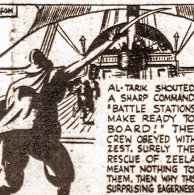
AL-TARIK SHOUTED A SHARP COMMAND: "BATTLE STATIONS! MAKE READY TO BOARD!" THE CREW OBEYED WITH ZEST. SURELY THE RESCUE OF ZEELA MEANT NOTHING TO THEM, THEN WHY THIS SURPRISING EAGERNESS?

Tarybų liūtas, selindamas pasigriebė auką Al-Tariko valtis išlindė priepilaukos ir pasuko į besartinantį laivą. Kaip vėliau matyme, tarp šių laivų bus susikirtimas.