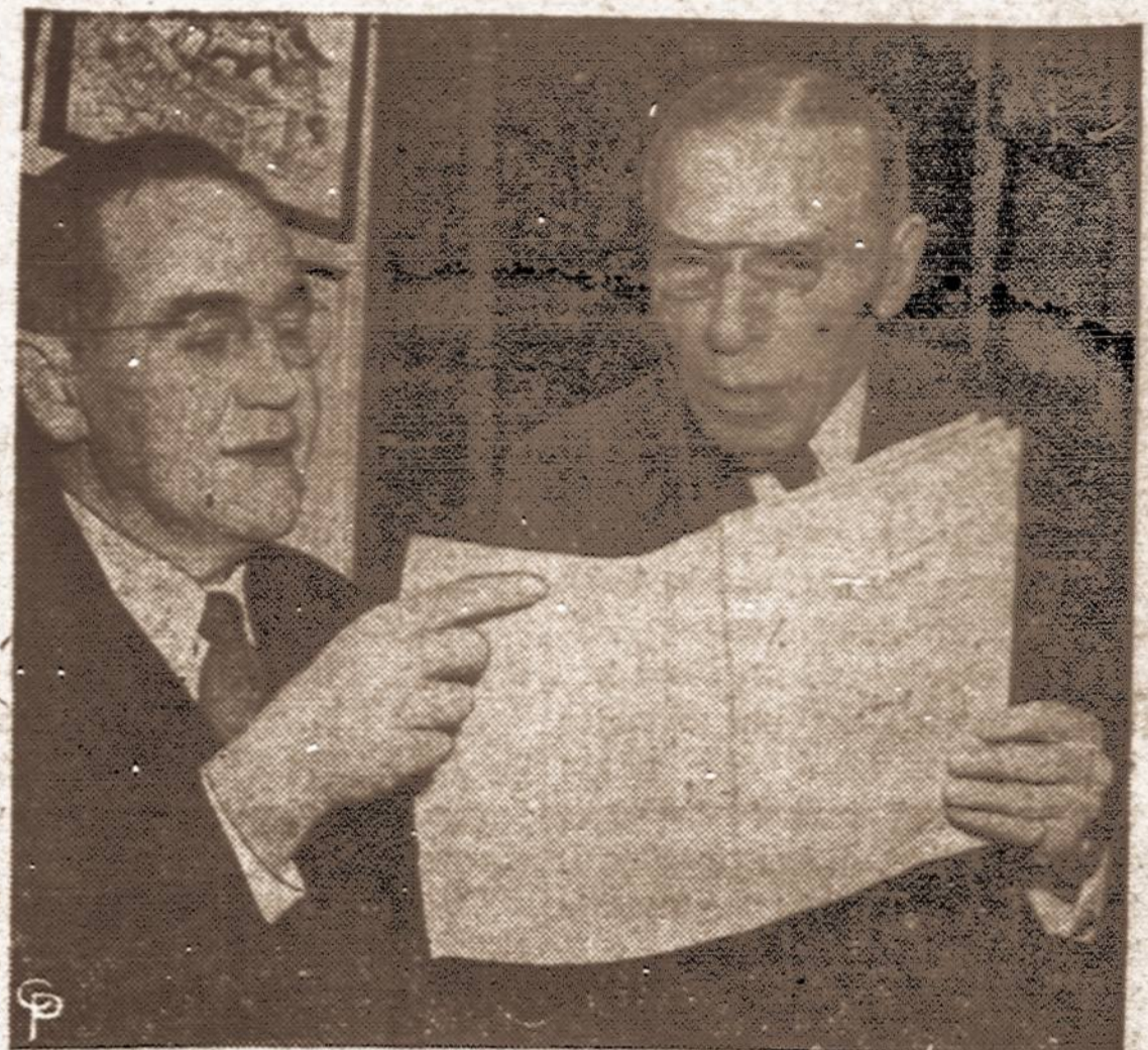
Kongresmonai, John M. Vorys (kairėje) ir Sol Bloom ieško kompromiso, ryšium su Amerikos pagalba Europai, kaip žinia, Atstovų Butas paskyrė Europai 590, o Senatas — 597 milijonus dolerių.

Prieš keletą metų velionis buvo pasitraukęs iš spaudos darbo ir su šeima apsigyvenęs savo ūkyje, Wisconsin valstybėje. Be laikraštinio darbo, velionis yra išvertęs ir lietuvių kalba eilę knygų. Mirusiojo kūnas, dalyvaujant laikraštlininkams ir miniai žmonių, palaidotas Sv. Kazimiero kapuose, Chicagoje.