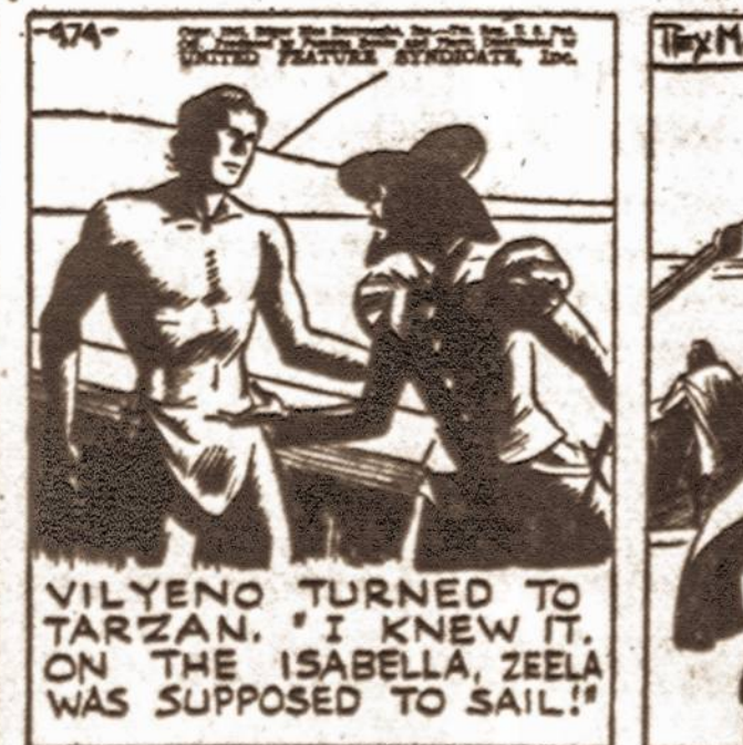
VILYENO TURNED TO TARZANAN. "I KNEW IT. ON THE ISABELLA, ZEELA WAS SUPPOSED TO SAIL!"