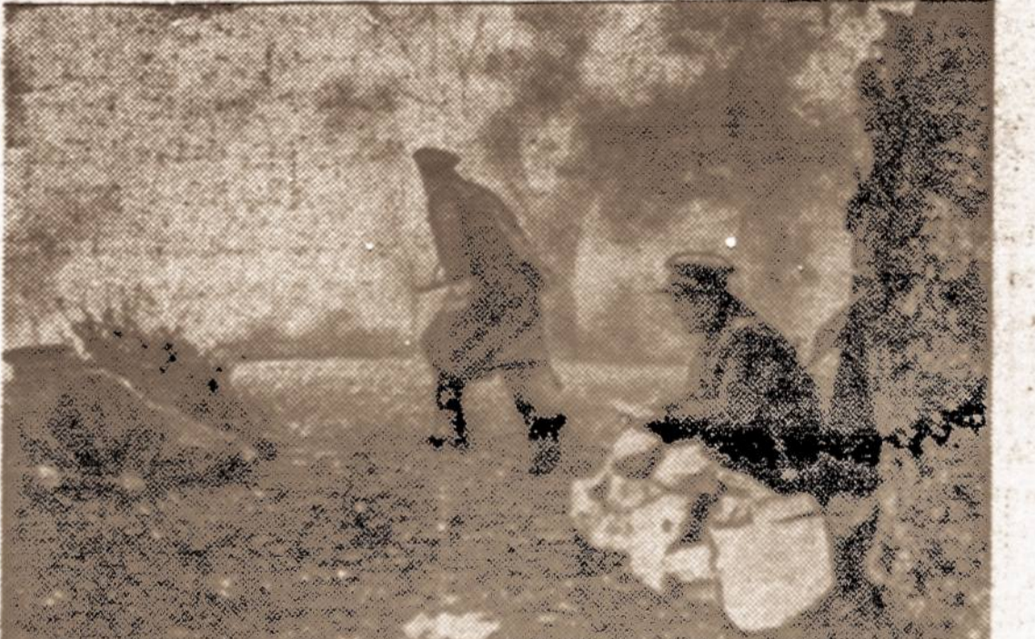
Arabų saugumo organizacijos narys Jeruzalėje ieško ginklo pas kitą, turbanu pasipuošusį ir karingai nusiteikusį, arabą. Mat, arabai taip pat stengiasi palaikyti taiką Palestinoje.

Šiomis dienomis atvyko naujas Sovietų Rusijos ambasadorius Jungtinėms Valstybėms Aleksandre S. Panjuškin, 42 m. amžiaus. Korespondentų paklaustas, ar ryšium su jo pasiskyrimu, galima tikėtis santykių Rusijos — Amerikos santykių pagerėjimo, Panjuškinas atsakė: "Viskas galima po saule."