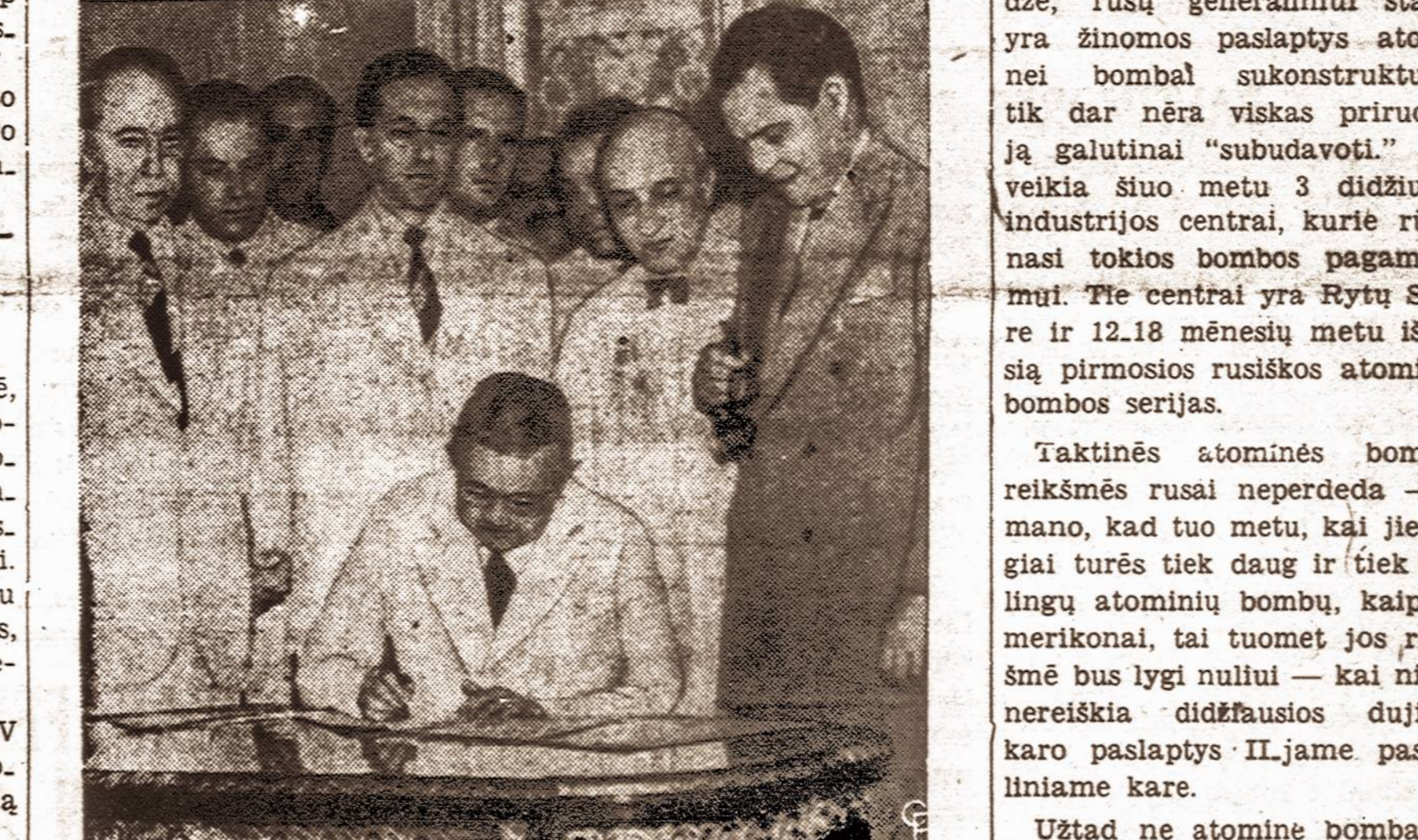
Brazilijos prezidentas Enrico Gaspar Dutra pasirašo aktą, kuriuo pašalinami iš valdiškų vietų visi komunistai.

— 23 pabaltiečiai, kurie Jungtines Amerikos Valstybes buvo atvykę per Atlantą paprastu laivėlu, negavę JAV vizų, išvyko apsigyventi į Kanadą. Šiuo metu Ellis Island saloje dar yra 33 estai ir latviai, pana-