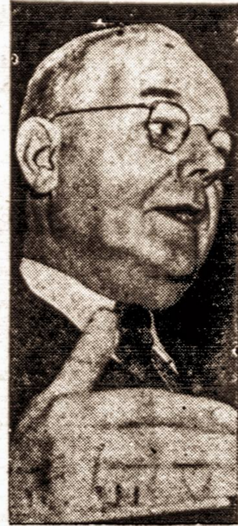
Finansų Sekretorius Snyder par.škė, kad Marshallo plano priėmimas yra viena iš tautos atstatymo sąlygų.

ir pan. Tokia kultūrinė veikla keleriopai svarbi, todėl nepraleiskim progos.