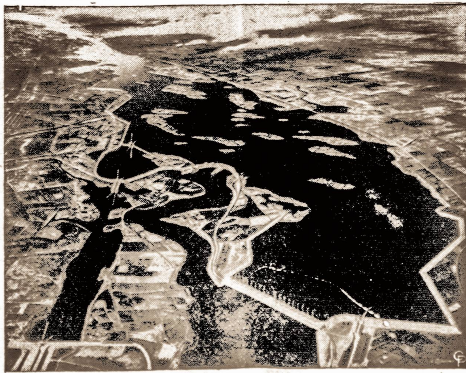
Inžinierių projektas St. Lawrence upę pa jungti elektros jėgai gaminti.