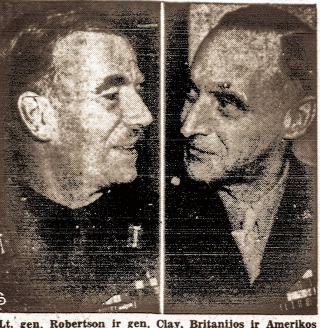
Lt. gen. Robertson ir gen. Clay, Britanijos ir Amerikos karo gubernatoriai Berlyne, neišsigaudo sovietų grąšini mo. Priešingai, dėl britų lėktuvo nelaimės, kurios priežastimi buvo sovietai, maršalas Sokolovski atsiprašė gen. Robertson.

NEPATENKINTI IRO PAREIGŪNAIS Kasselio - Mattenbergo lietuvių stovyklos (kurioje gyvena arti 30.000 lietuvių) gyventojai savo gauslame susirinkime nutarė neiti į IRO naujai ruošiamą screeningą. Painformuoti apie savo nutarimą ir prašyti užtarimo stovyklos delegacija buvo nuvykus į US Armijos štabą Frankfurte, kur tuo reikalu įteikė gerai paruoštą petičiją. Delegaciją priėmė aukšti karininkai. Jie labai domėjosi lietuvių delegacijos pareiškimais, ypač apie prieštaravimus IRO konstitucijai. Tremitinių teisinė būklė būtų pakencinama, jeigu tos konstitucijos nuostatų nešališkai prisilaikytų. Dabar IRO konstitucija praktikoje išskraipoma tremitinių nenaudai. Įvairūs IRO pareigūnai mielai naudojami pro-sovietiniams konstitucijos aiškinimams, bet labai dažnai "užmirštama" arba gudriai apelnami amerikoniški aiškinimai, kurie yra palankūs Pabaltijo tautų tremitiniams. Buvo pareiškta nepastikėjimas tam tikra dalimi IRO personalo, kurio tarpe yra nemaža komunistinio nusistatymo žmonių. Armijos atstovai į šiuos pareiškimus atkreipė tinkama dėmesį. Jie čia pat Kasselio lietuvių delegacijai pranešė, kad IRO ruošiamame screeninge kai kas bus pakeista tremitinių naudai. Gal svarbiausias pakeitimas bus tas, kad tie DP, kurie per registraciją bus rasti netinkami tolimesnei IRO global, nebūs iš stovykių šaliami, kol bus išspręsti apeliaciniai jų skundai.