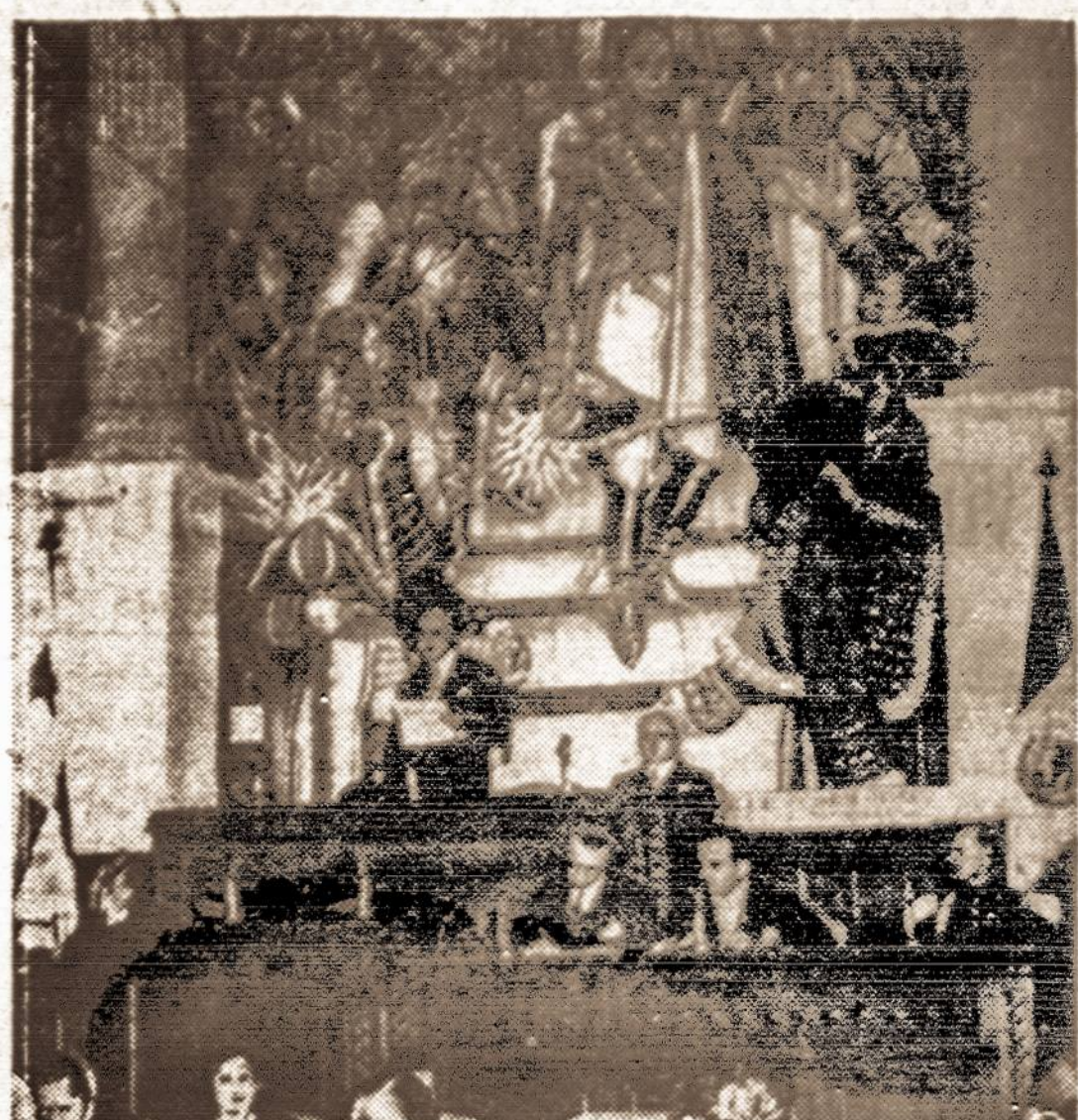
Kolombijos prez. Perez kalba į 9-tos Fan-Amerikos konfe-rencijos dalyvius Bogotoje.