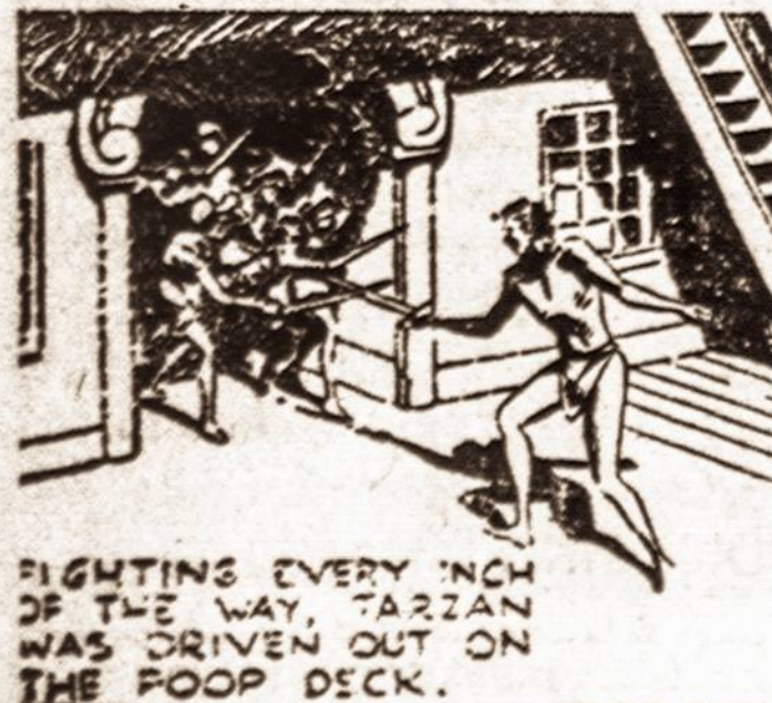
FIGHTING EVERY INCH OF THE WAY, TARZAN WAS DRIVEN OUT ON THE POOP DECK.