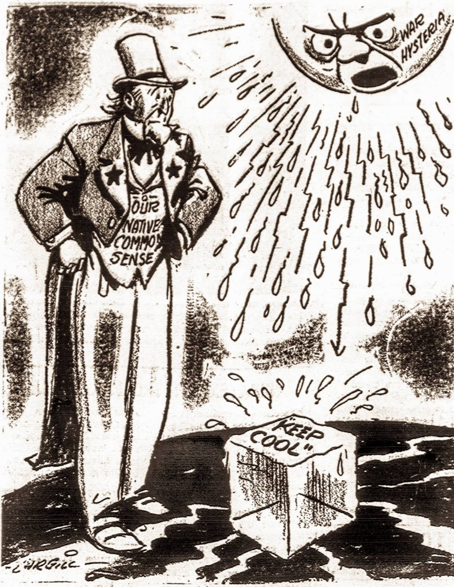
Kai "šaltas karas" ima vis labiau ir labiau kaisti...

Trys srovės jau turi vieną bendrą viršūnę, skirtą Lietuvos išsivadavimo reikalams. Jau baigiami pastarimai ir išsiaiškintai dėl ketvirtosios įsijungimo į tą organą. Tai