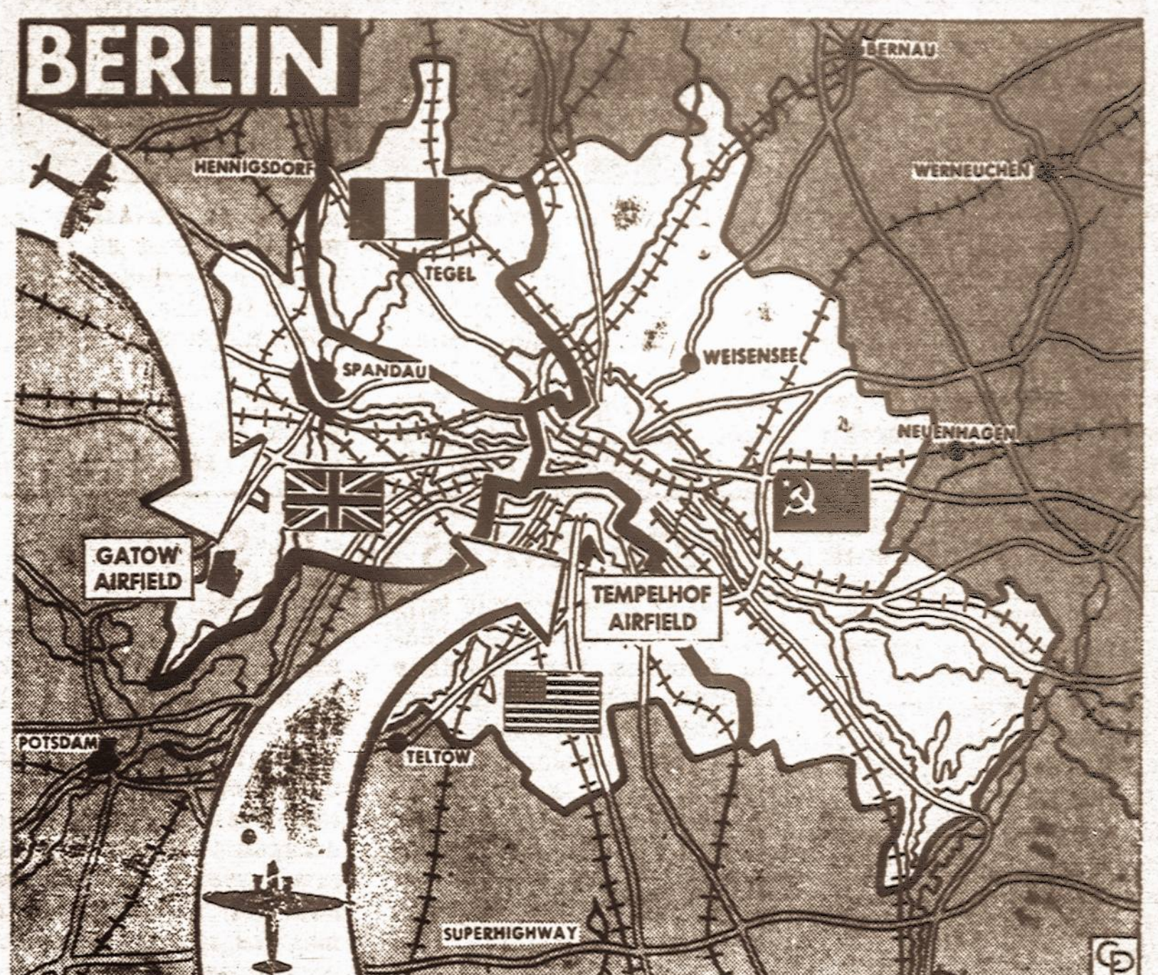
Sovietai bandė suvaržyti traukinių susisiekimą su amerikiečių, anglų ir prancūzų zonomis Berlyne, tuo būdu norėdami vakarų sąjungininkus išstumti iš buvusios Vokietijos sostinės. Bet pastarieji, panaudoję oro susisiekimo priemones ir griežtą toną, sovietus privertė nusileisti.