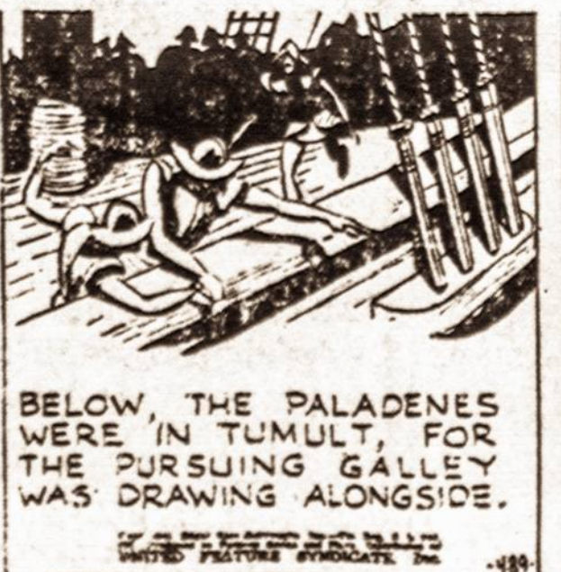
BELOW THE PALADENES WERE IN TUMULT, FOR THE PURSUING GALLEY WAS DRAWING ALONGSIDE.