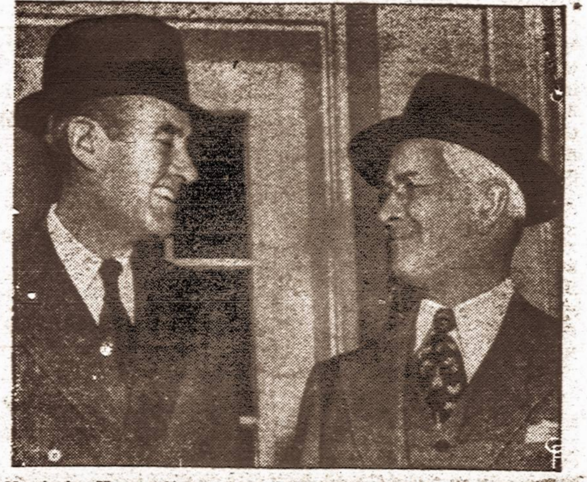
Naujasis Komercijos sekretorius Sawyer kalbasi su savo pirmtaku Harriman, kurį Trumanas paskyrė ambasadorium

Anot Clark, komunizmo pavojus Amerikai yra realus, nors ir ne toks rimtas, kaip daugelio yra manoma. Bet su komunistų ar kitos panašios grupės noru nuversti esamą šio krašto santvarką esą negalima nesiskaityti. Tie bendrakeleiviai, anot Clark, dabar sudaro komunistinio pogrindžio avangardą ir todėl jie yra pavojingi Amerikai. Šiuo metu komunistai stipriausiai laikosi jūrininkų ir elektrotechnikų unijose. Šios dvi unijos iki šiol nesistengė atsikratyti Maskvos agentais, — baigė prokuroras.