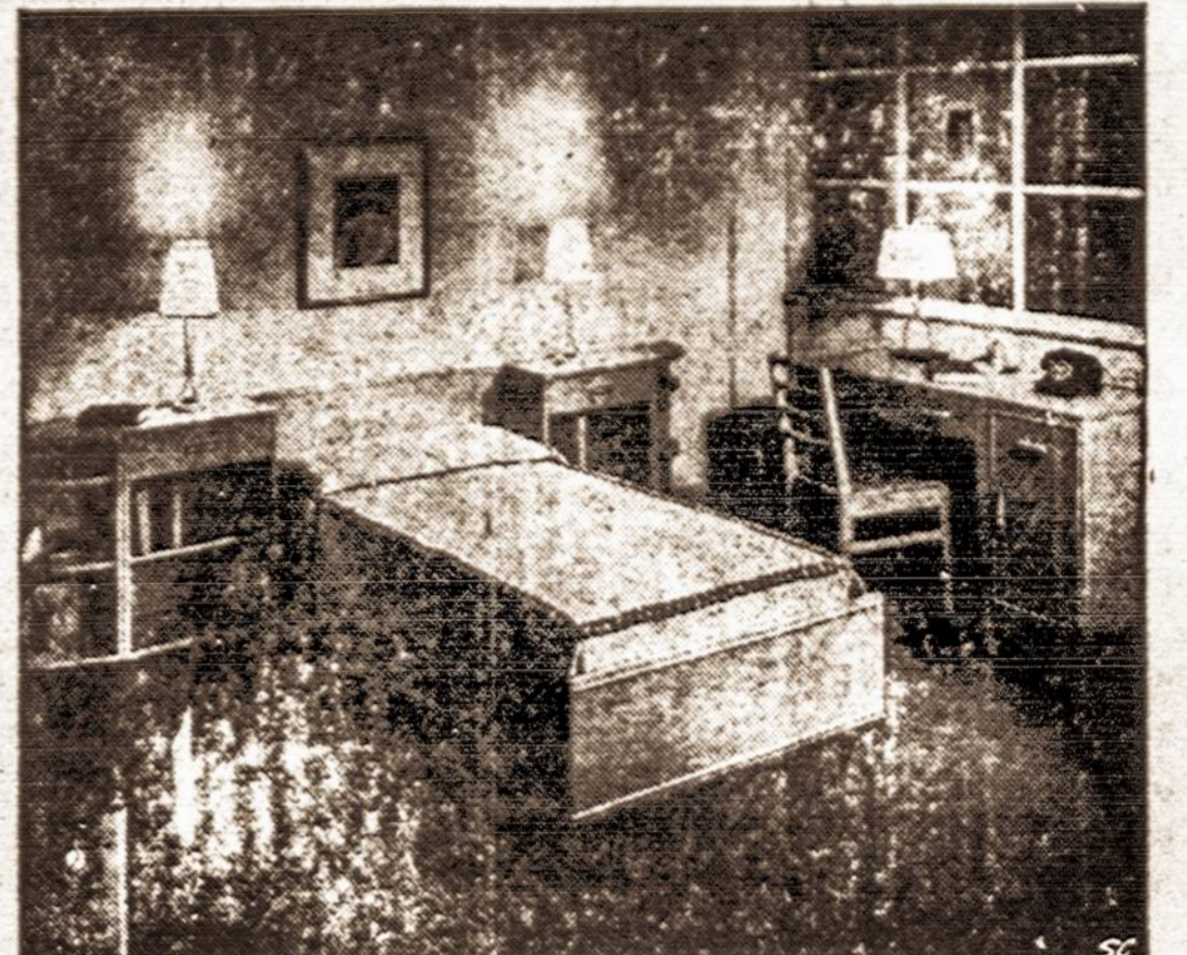
Ne tik suaugusiems, bet ir vaikams, ypač mokyklinio amžiaus, reikalingas atskiras kambarys. Čia parodomas kambarys tinkamas berniukui ar mergaitėi.

Žmogus iš prigimties yra šaivas. Ir vaikai nori būt laisvi. Bet tėvelio griežtas už-draudimas dukrytei bėgti prie