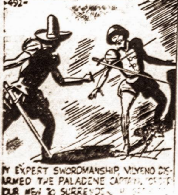
NE EXPECT SWORNMANSHIP VILYNO DEARMED THE PALADENES CAPTAIN. DLR #10 TO SURRENDER.