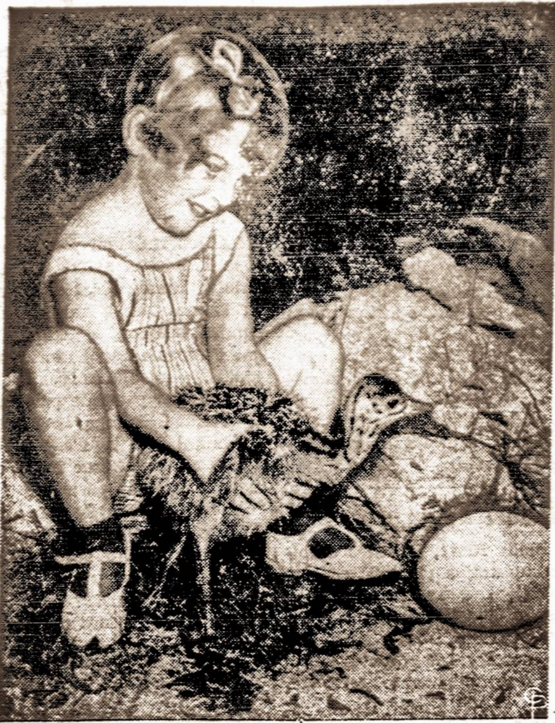
Gegužės 1 d. pradėdama vaikų sveikatingumo savaitę. Čia matome jauną amerikietę, laikančią 5 dienų amž. strausiuką. Šalia jų futbolo didumo strauso kiaušinis.

New Britain, Conn. — BALF ribų ir konservuoto maisto vajuš čia prasideda bal. 11 d. ir intensyviai vedamas iki geg. 1 d.