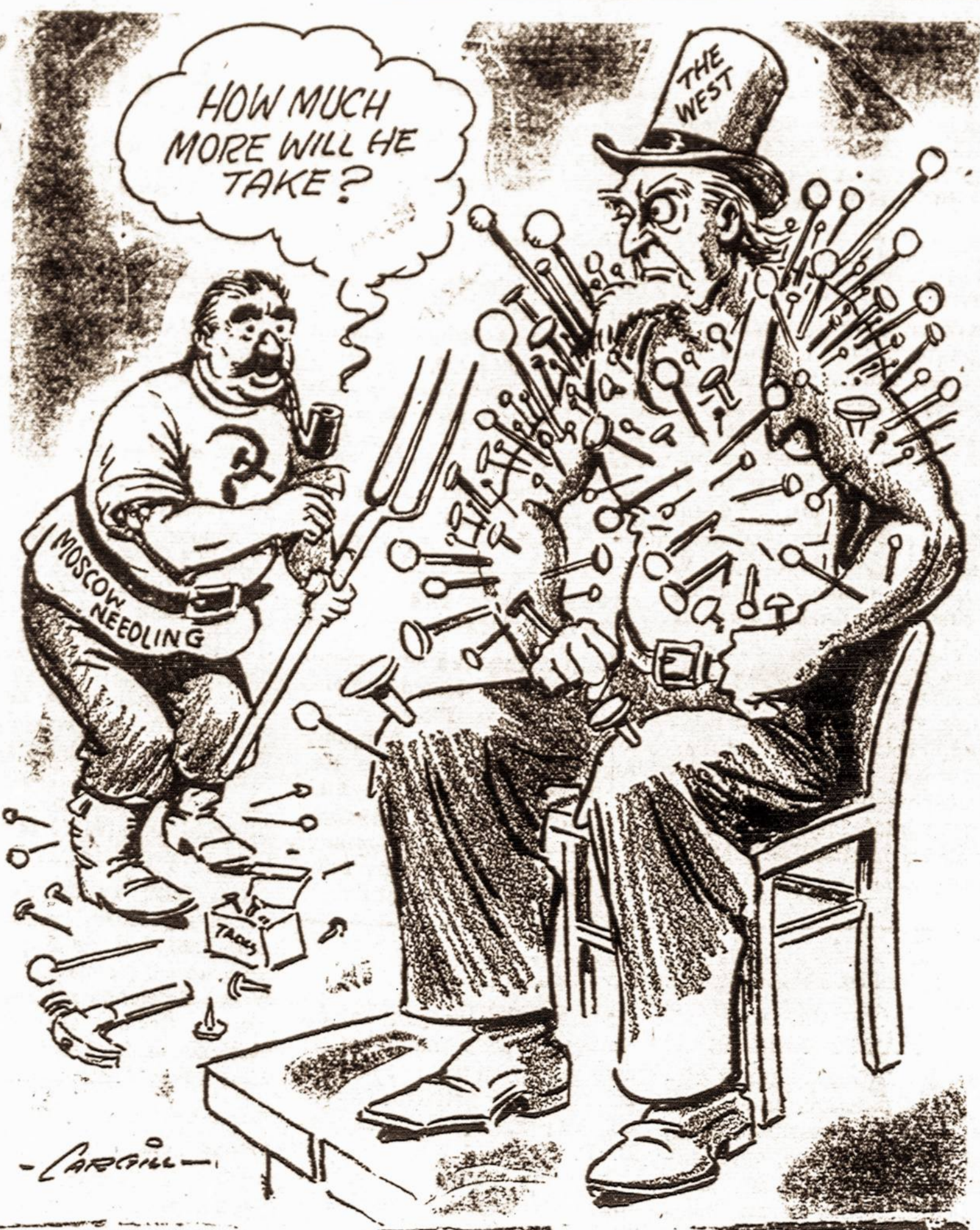
...Bet kantrybė gali kada nors baigtis.

Atrodo, Amerika mėgsta veikti stambmenomis, taigi