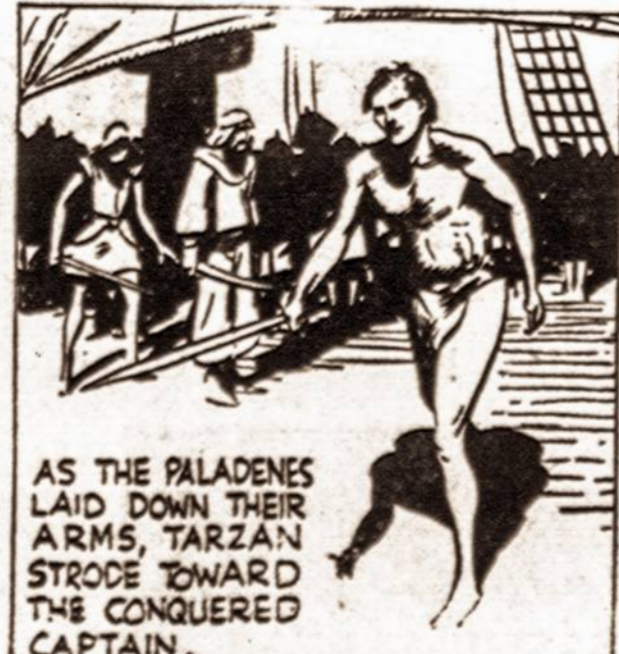
AS THE PALADENES LAID DOWN THEIR ARMS, TARZAN STRODE TOWARD THE CONQUERED CAPTAIN.