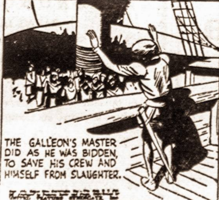
THE GALLEON'S MASTER DID AS HE WAS BIDDEN TO SAVE HIS CREW AND HIMSELF FROM SLAUGHTER.