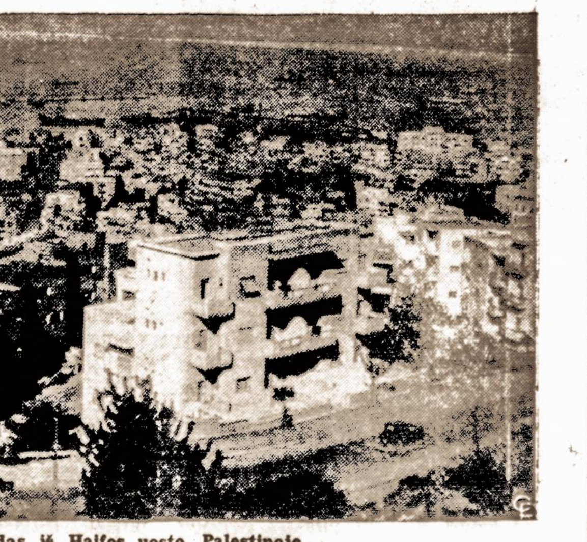
Vairdas iš Haifos uosto, Palestinoje.