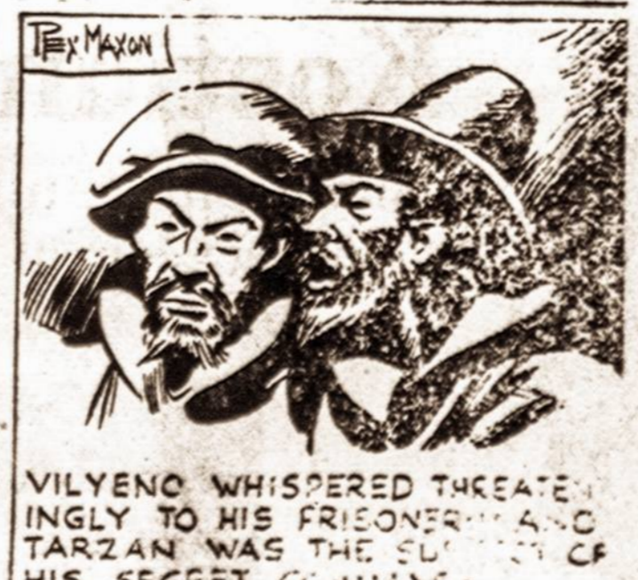
VILYENO WHISPERED THREATENINGLY TO HIS FRIENDBROTHER TARZAN WAS THE LEADER OF HIS SECRET COMMAND.

Būdamas patyres kardininkas, apėkurus Vileinas tuojau nuėginklavo paladenu laivo kapitoną. "Isakyk savo iguliai pasiduoti," dabar jis komanduoja janciai suėuko.