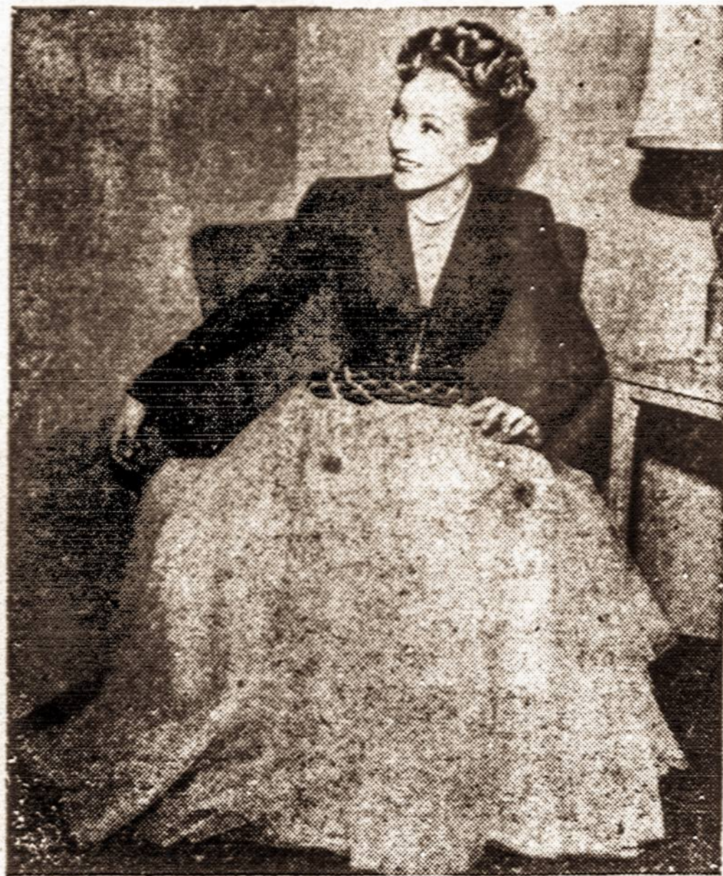
Visus žavi moteris, kuri turi proporcingą figūrą, bet dar gražiau, jei ji moka gražiai sėdėti. Sėdint ar stovint moderniška moteris visuomet stengiasi būti gražiai.

Amerikos vežio ligos drau-gija numatiusi savo veiklą dar labiau paplėsti. Todėl draugi-jos vadovybė nuosirdžiai kvie-čia visus amerikiečius į šią ko-vą prieš vežį energingai stoti ir kiek išlekliai leidžia ma-terialiai prisidėti.