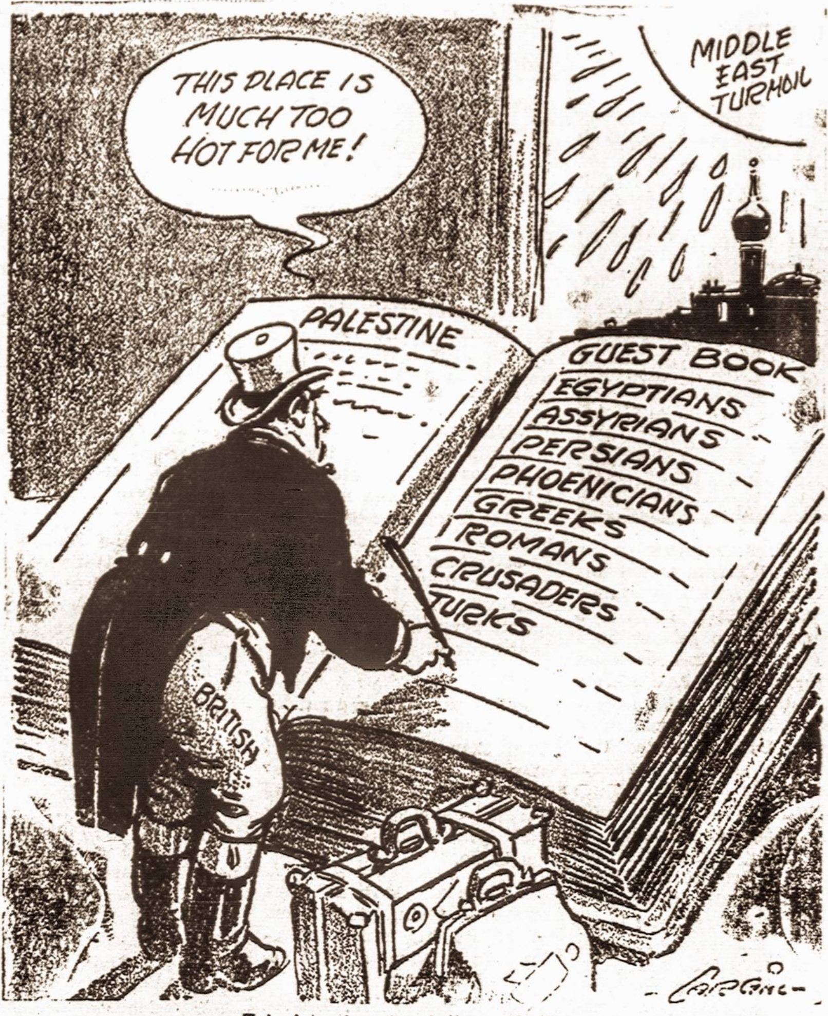
Tai vieta, kur jau britams karšta...

Toks skirtumas tarp Sov. Rusijos ir Jungtinių Amerikos Valstijų.