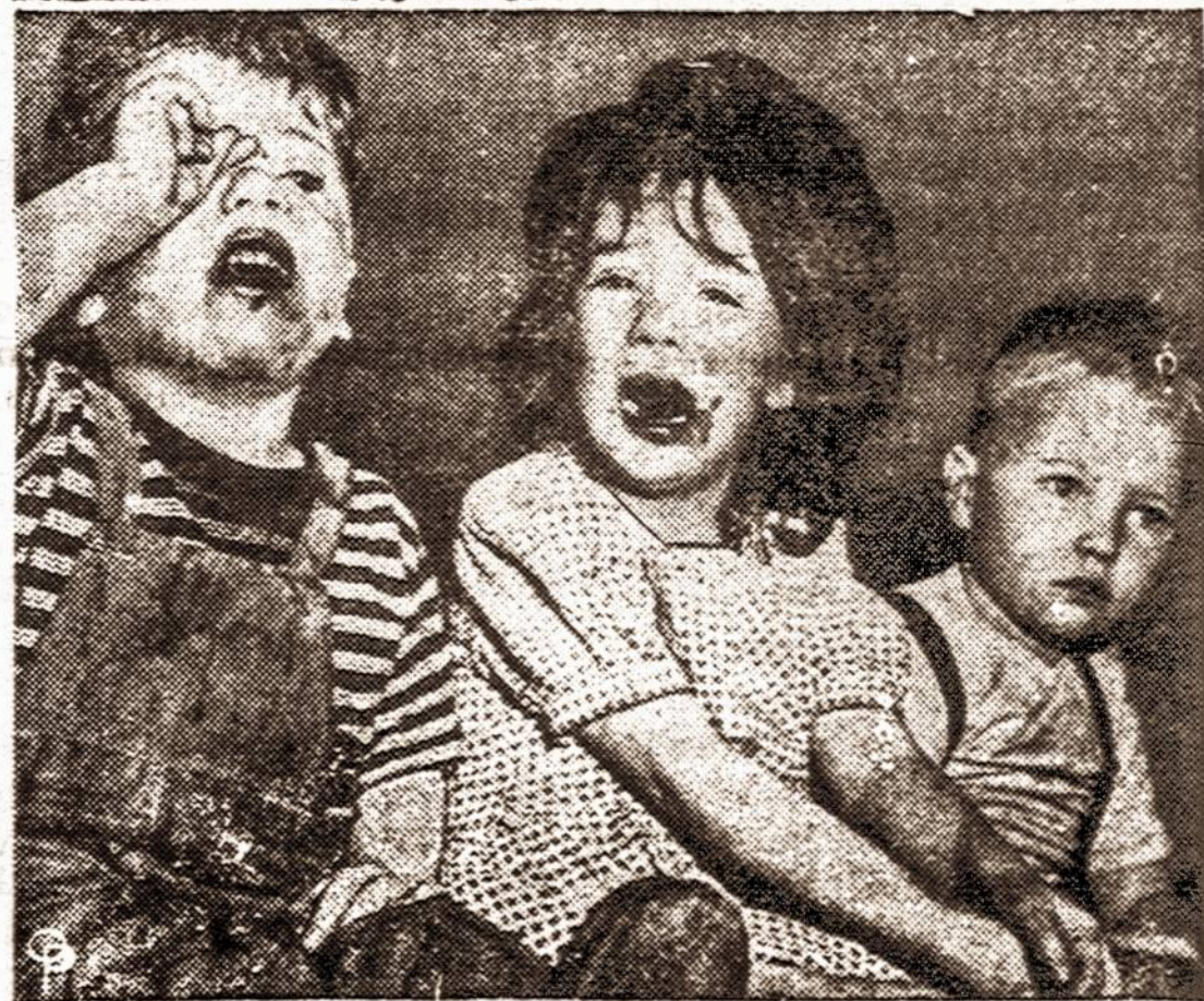
Nuvežti į liginę, šie vaikai prisipažino suvalgę vaistus, skirtus šuniui kirmėlėms iš pilvo išvaryti...

Rusų cenzūruojama Berlyno spauda rašo, kad Berlyno miesta sunaikinę britų ir amerikiečių lakūnai. Tai rusai paskelbė ryšium su 3 metų sukaktuvėmis, kai krito Berlynas.