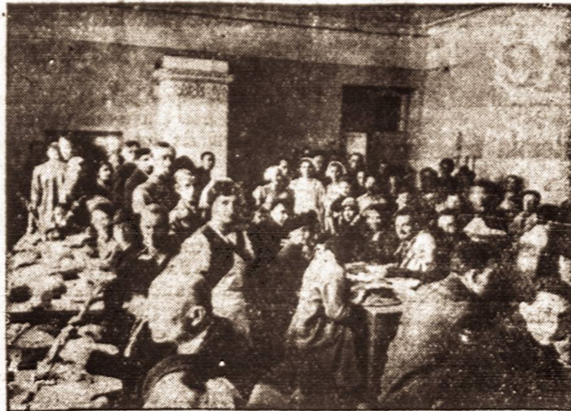
Svenčių progomis tremtiniai valgo bendrai

Kalbant apie leidinių išvaizdą, tenka pasakyti, kad jie labai meniškai išleisti. Viršeliai pagražinti tautiniais ornamentais, o tai sudaro ir akiai labai malonų ir sielą glostantį vaizdą. Šiaurės Pašvalstės papuosta muzikos kompozitorius, man