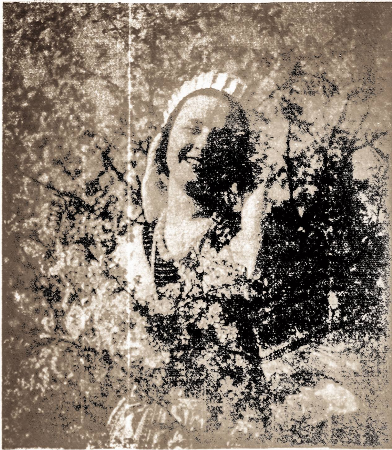
VYSNIŲ ŽYDĖJIMAS IR LIETUVAITE