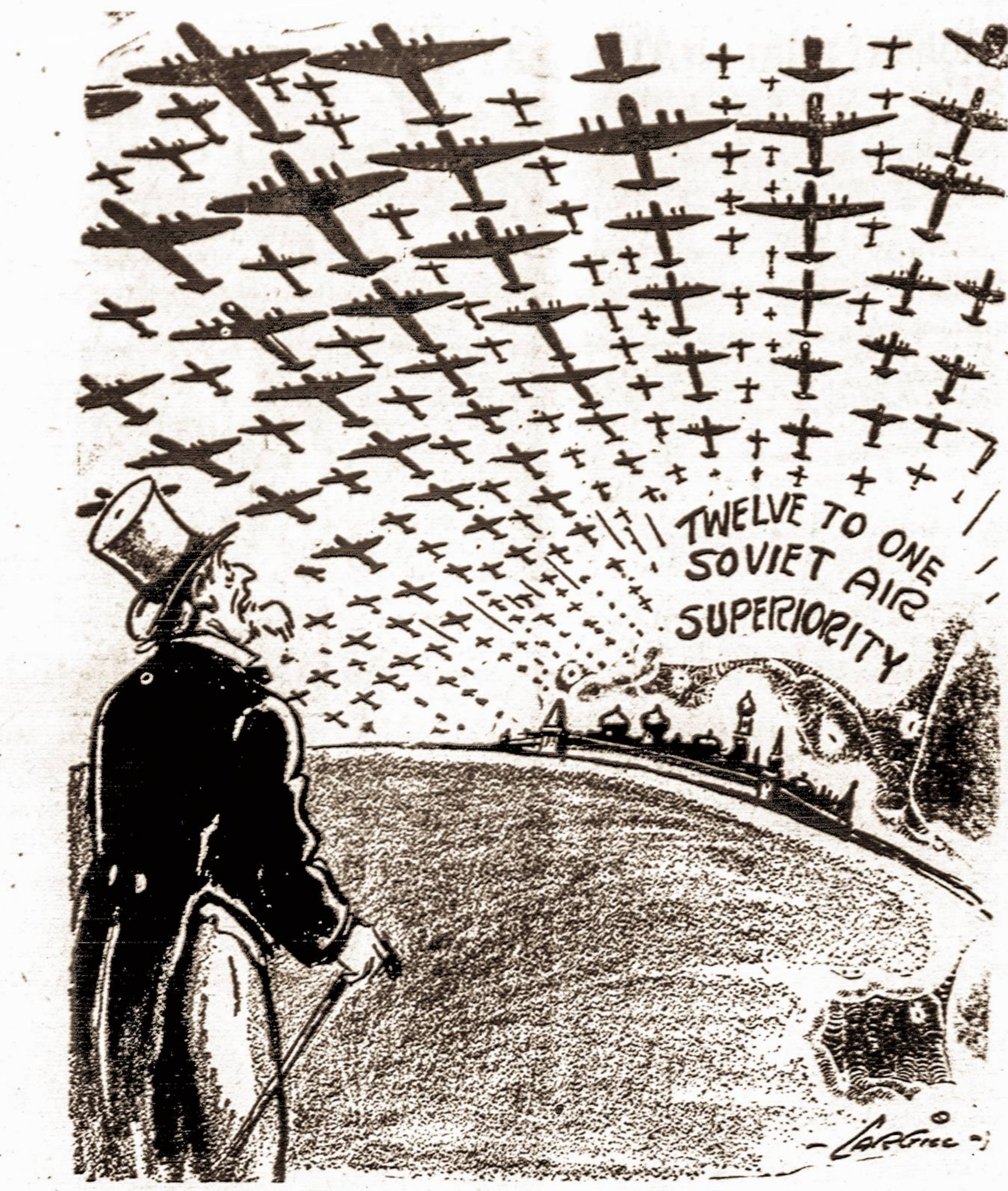
Atrodo, Dėdė Samas dėl to yra susirūpinęs...

Be to, visa tai padariau ne iš tarnybinės pareigos, o iš savo geros valios, kaip Ame-rikos pilietė ir Lietuvos dukra. Būčiau neverta tų istalgų pasitikėjimo, jeigu gindamas nuo asmeninių man priekaiš-tų, leisčiau anoniminiu laišku