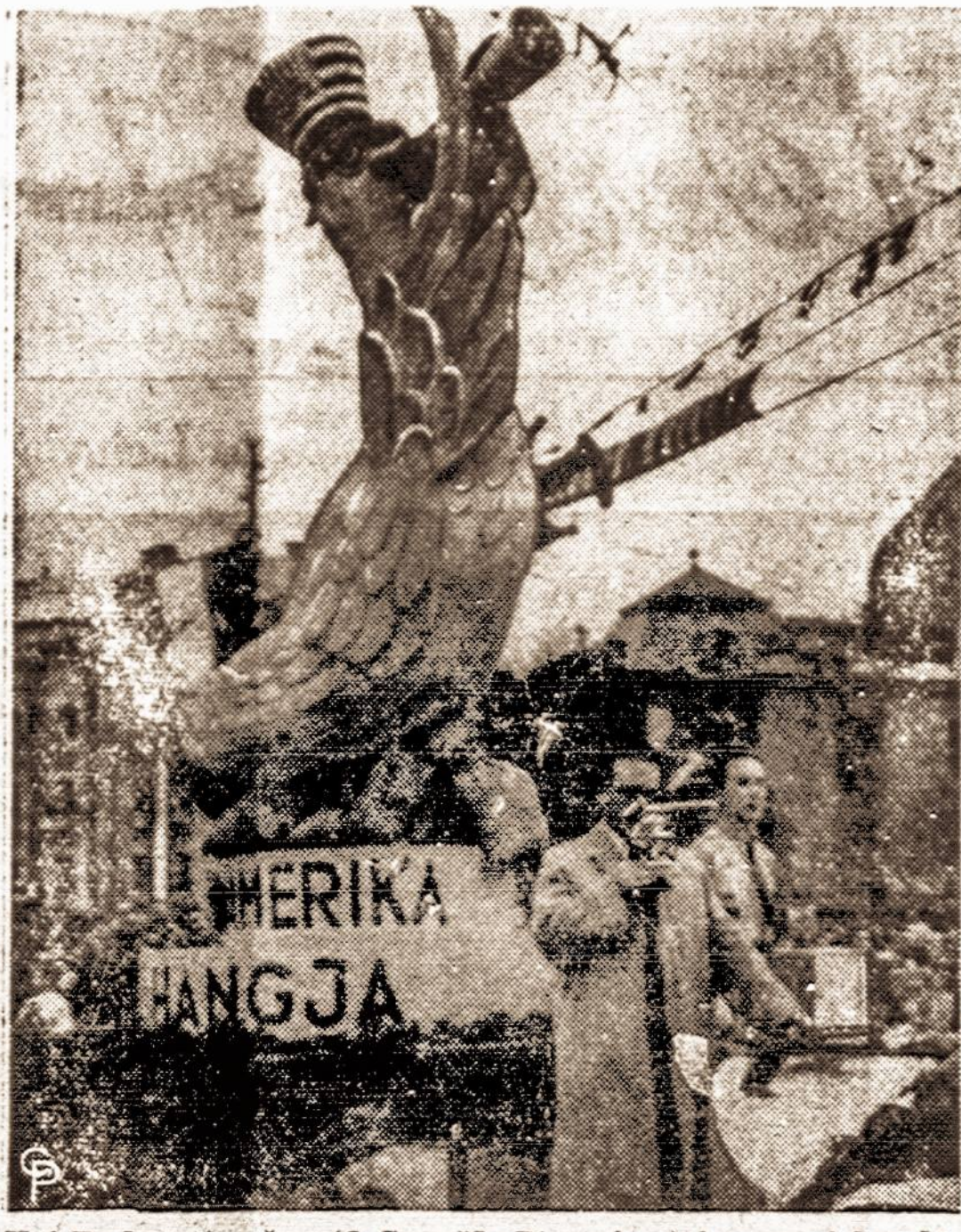
Kai Budapestas šventė Gegužės Firmą, tai vengrai bandė lyoti iš Voice of America, kuris radijo bangomis juos pasiekia ir per geležinę uždangą.