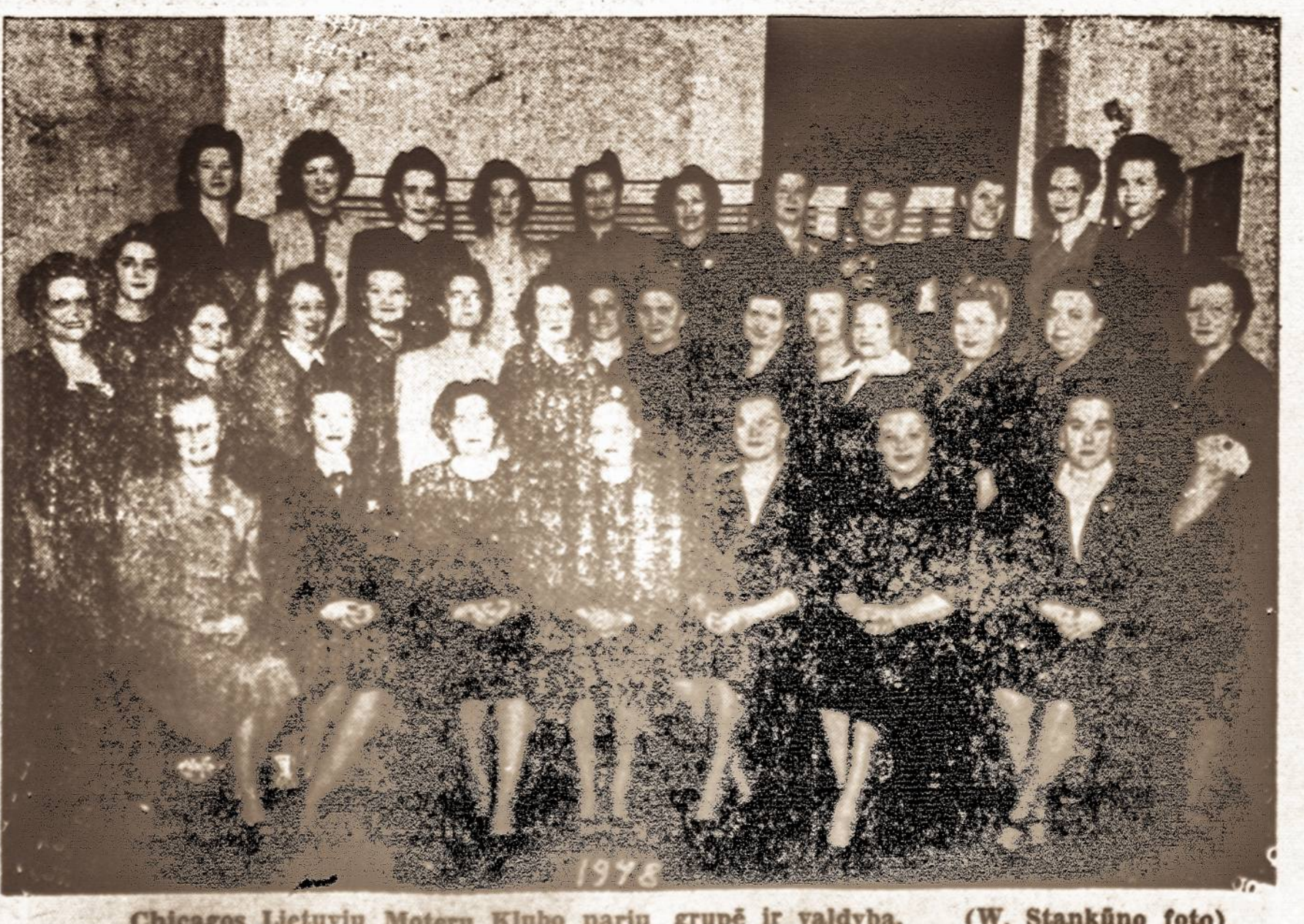
Chicago Lietuvių Moterų Klubo narių grupė ir valdyba.