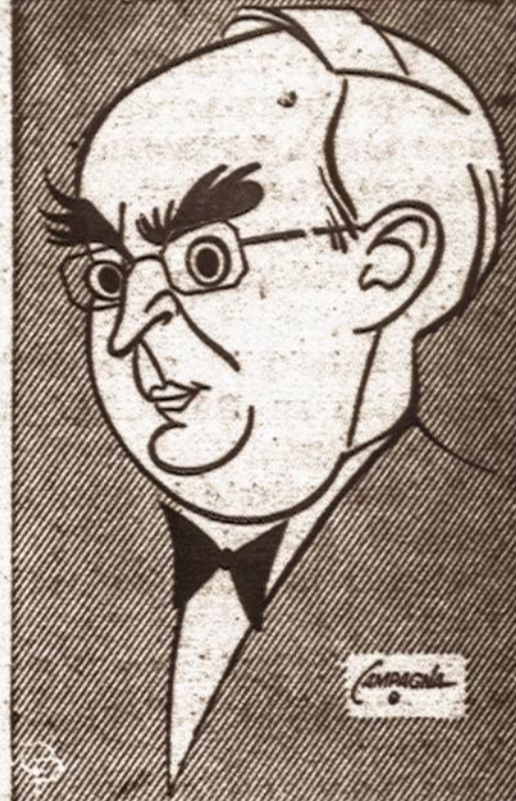
SEN. ARTHUR H. VANDENBERG

vimą valstijoms, kuriose numatyta naujas būtų statybos planas ir valkатыnų naikinimas; padaryti reformas darbo įstatymuose, kad kiekvieno asmenines teises darbu ir pažangai garantuoti; skatinti ūkininkų kooperatyvus; pasižada įvesti tokius įstatymus, kurie apskuntų komunistų veiklą ir aplamai, pasmerkia tas politines grupes, kurios siekia panaikinti demokratiją ir įvesti totalitarinę santvarką.