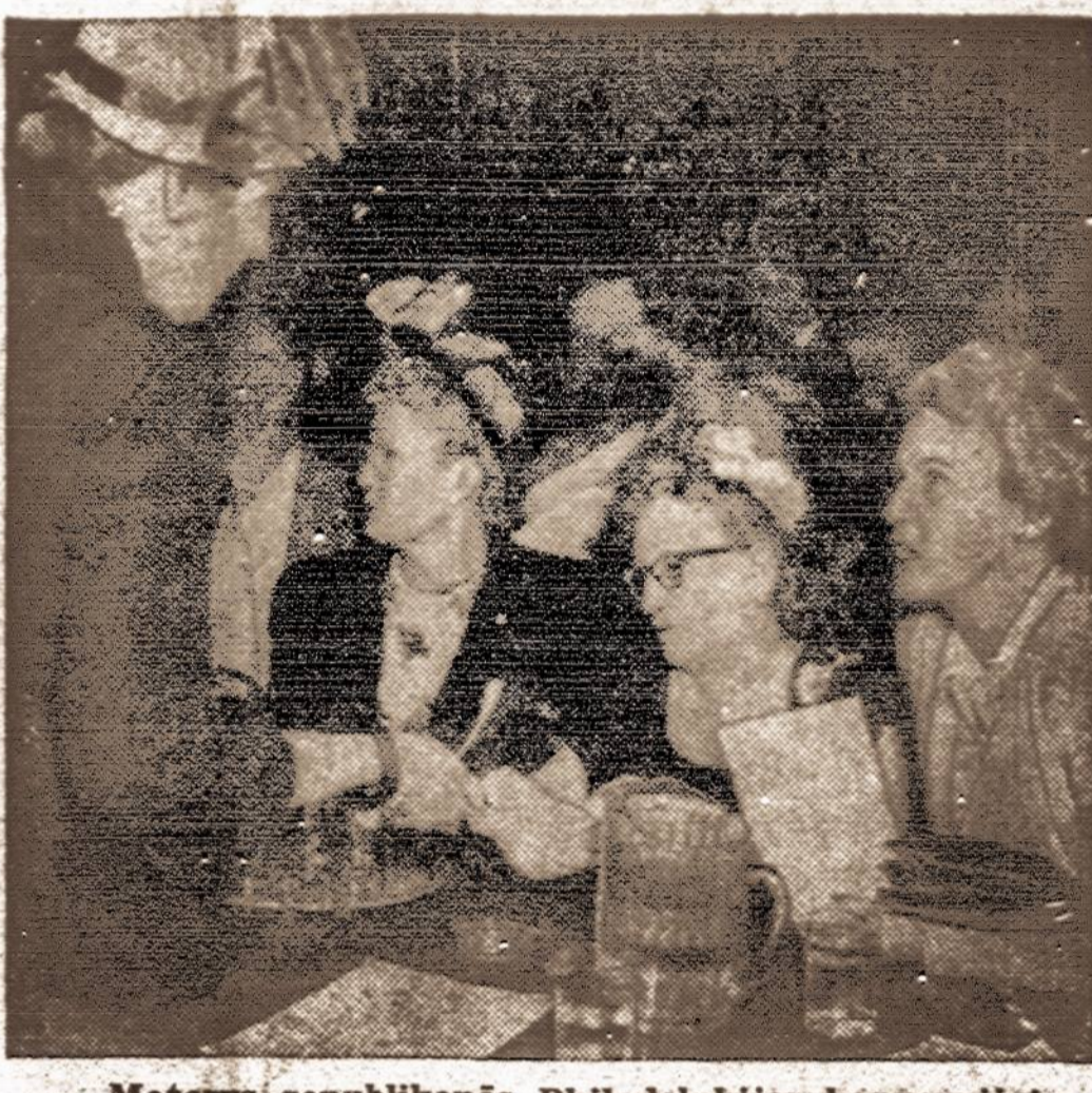
Moterys republikonės Philadelphia konvencijoje

Privalomos karo tarnybos įstatymas: Šis įstatymas reikalauja, kad visi vyrai nuo 18 iki 25 metų amžiaus registruotų naujokų registracijos biuruose, kurie atnaujinami. Privalomos karo tarnybos laikotarpis — 21 mėnesis. Saugumas ir karo tarnyba prasidės 90 dienų po įstatymo išgaliojimo, 18 m. amžiaus vyrai bus tik registruojami bet nešaukiami tarnybai; jie bus pašaukti, kaip tik sulauks 19 m. amžiaus. Visi to amžiaus vyrai, kurie dabar dar spės įstoti į National Guard nebus šaukiami privalomai karo tarnybai.