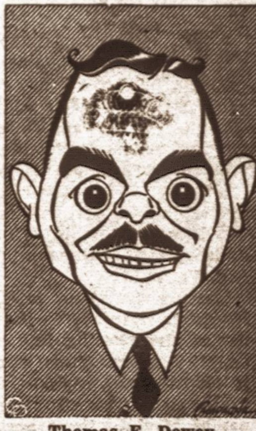
Thomas E. Dewey