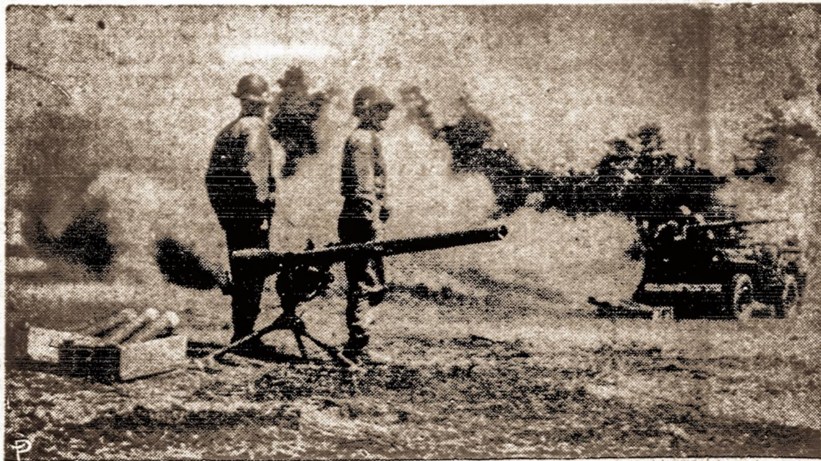
Berlyno krizės metu JAV kariai okupuotoje Vokietijoje išbando naujus karo pabūklus.

Kaip žinote, jau yra buvę dviejų, trijų, keturių ir net penkių "didžiųjų" konferencijų.