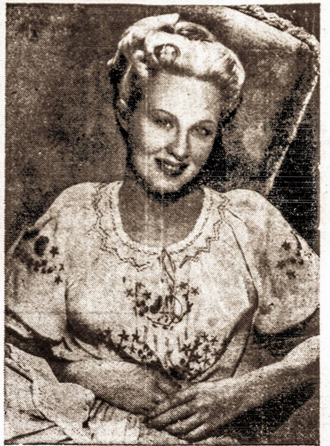
Artistė Virginia Mayo parodo rankų darbo bliuskutę.