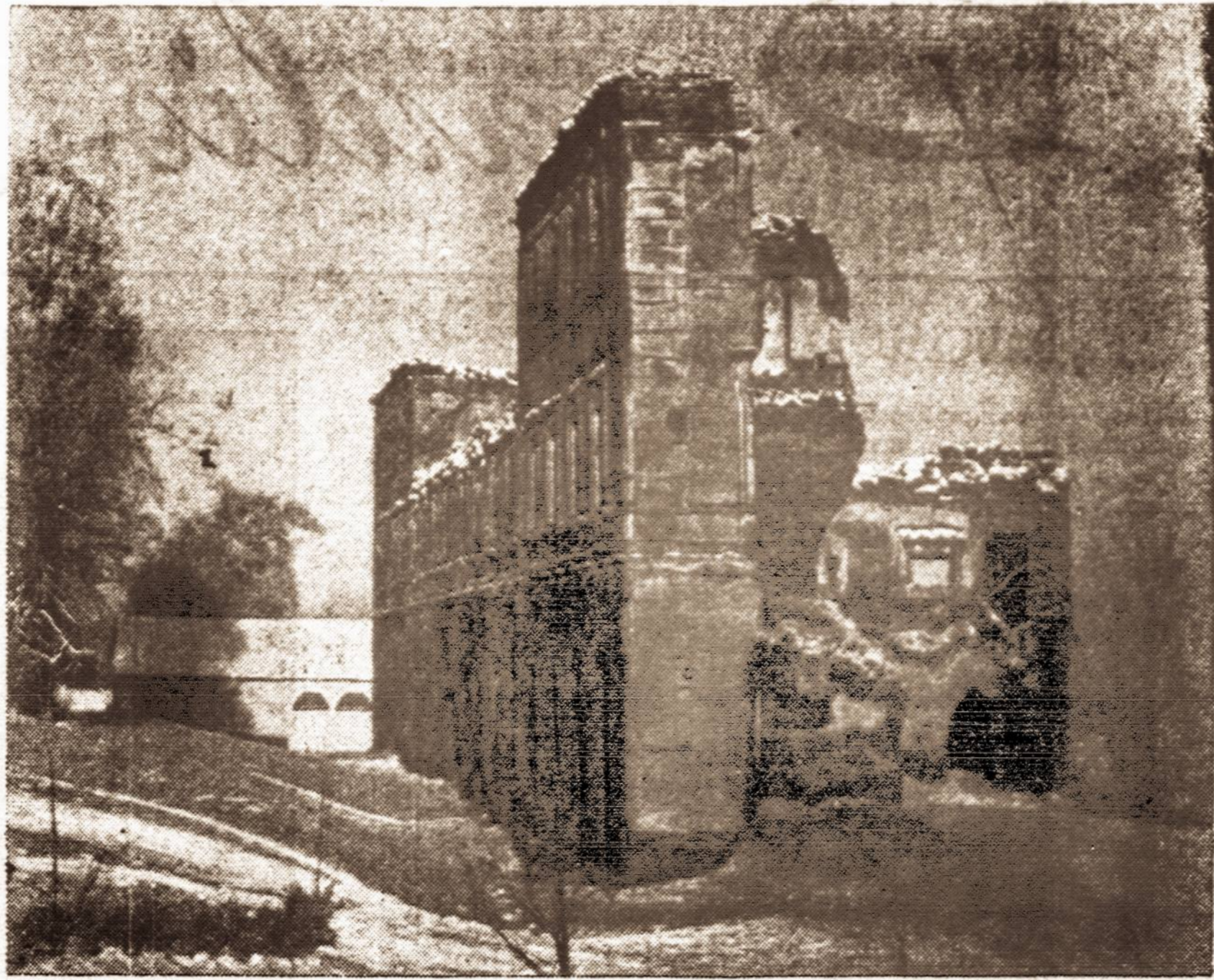
BIRŽŲ PILIES GRUVĖSIAI

Repatrijavo per pirmąjį pusmetį: 254 latvai, 26 estai, ir 2,579 lenkai.