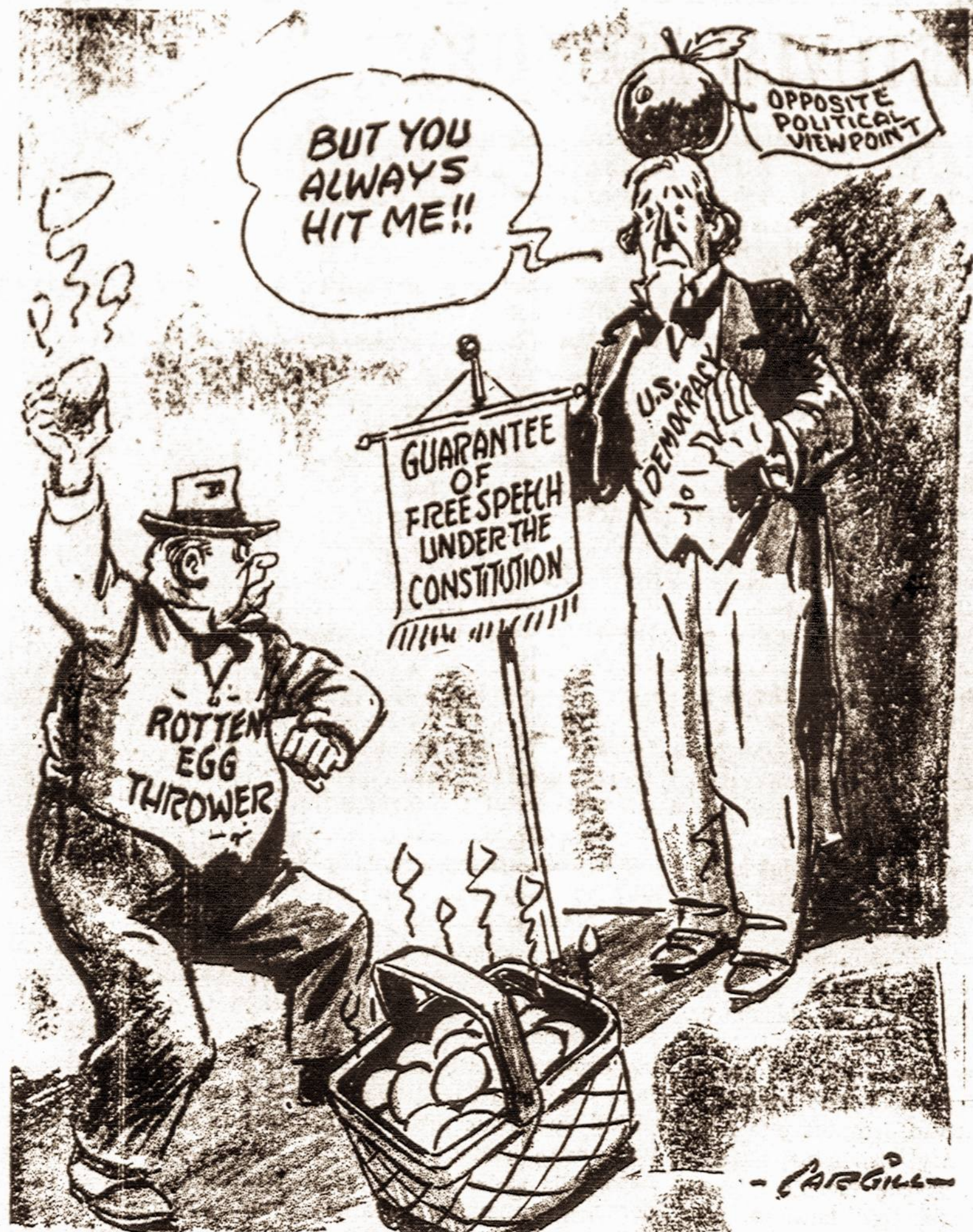
Metė į Wallace, bet... pataikė Dėdei Samui...

Aplikacijos tam tikslui galima gauti iš Imigracijos ir Naturalizacijos skyriaus. Reikia jas išrašyti dviejose kopijose ir persiųsti Imigracijos ir Naturalizacijos komisijonierui Washingtone. Jokių kitų dokumentų su aplikacija siųsti nereikia. Vėliau, pagal numerį, aplikantui bus pranešta, kur asmeniškai prisistatyti tyrinėjimui, kurio metu jis turės įteikti ir kitus reikalingus dokumentus.