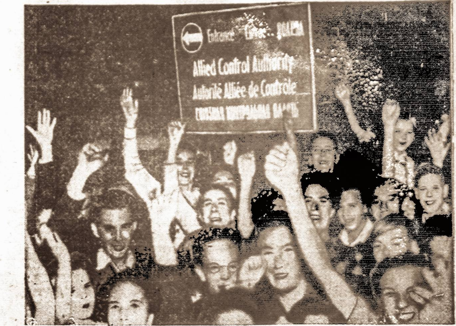
Berlyno gyventojai britų zonoje demonstruoja prieš komunistus. Vienas išsitraukęs anti-komunistas šių demonstracijų metu nuplėšė sovietiską vėliavą prie Brandenburgo vartų.

Prieš 1939 metus lietuvių Austrijoje beveik nebuvo. Gyveno čia tik paskiri asmenys, daugumoje studentai, studijuojantieji Vienos ir Grazo universitetuose. 1941-1944 metais lietuvių skaičius Austrijoje padidėjo, vokiečiams pradėjus jėga vežti Lietuvos jaunimą į darbus Vokietijon. 1944 metų vasarą, prasidėjus bėgimui iš Lietuvos, lietuvių skaičius Austrijoje staiga pakilo. Visuose didesniuose Austrijos miestuose susidarė nemažos lietuvių kolonijos, daugiausia gi — apie 3000 — susispietę Vienos mieste, kur visi turėjo dirbti vokiečių karo pramonėje. Frontui artėjant prie Austrijos ribų, visi lietuvių tremtiniai, gyvenę Vienoje ir rytinėje Austrijoje, buvo vėl priversti apeisti gyvenamą vietą ir keliauti toliau į vakarus. Tuo metu, t. y. karo pabaigoje, didžioji Austrijos lietuvių dalis persikėlė į vakarų Vokietiją, gi pačioje Austrijoje liko apie 2500 tautiečių. Karui pasibaigus, lietuvių toliau stengėsi persikelti į Vokietiją, kur DP gyvenimo sąlygos buvo šiek tiek palankesnės. Tuo būdu iki 1946 metų pabaigos