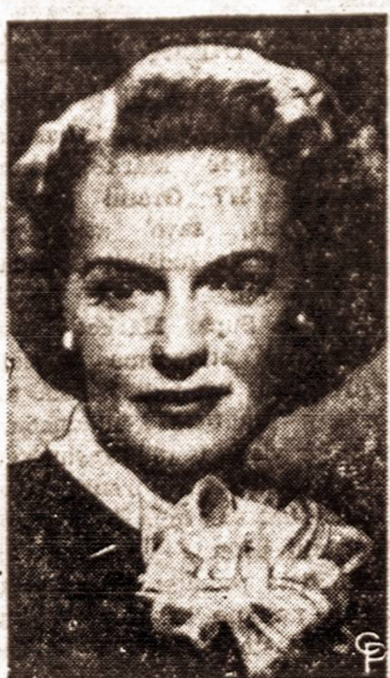
Los Angeles policija negali išaiškinti, kokiu būdu susižeidė kino artistė Rita Johnson, kuri buvo atgabenta į ligoninę be sąmonės. Artistei buvo padaryta smegenų operacija, bet žada jį dar neatgavo.