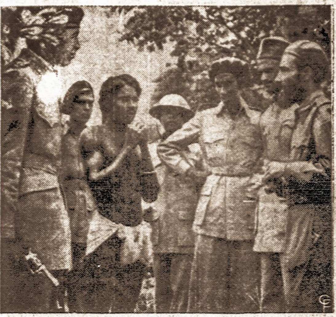
Hyderabadą kunigaikštystės kariuomenės vadas Kazim Razvi (su barzda) klausinėja į nelaisvę paimtą indusų šnipą. Kaip žinoma, Indijos kariuomenei įsiveršus į Hyderabadą, tarp tų dviejų valstybių prasidėjo atviras karas.

Rugsėjo 14 d. Indijos kariuomenė, lėktuvai ir mechanizuoti daliniai pradėjo veržtis į nepriklausomą Hyderabadą kunigaikštystę. Indijos kariuomenė, kuri invaziją pradėjo iš penkių pusių, sakoma, sutinkanti stipraus pasipriešinimo. Nežiūrint to, invazija einanti pagal iš anksto nustatytą planą. Hyderabadas yra viena iš kelių šimtų nepriklausomų kunigaikštystių Indijoje. Šią 15 milijonų gyventojų kunigaikštystę valdo turtingiausias pasaulyje žmogus, kurį vietos gyventojai vadina Nizam — valdovu. Kunigaikštystės gyventojų didžiūma, apie 80 nuosimčių, yra hindusai, bet kraštą valdo musulmonai. Kadangi Hyderabadas yra iš visų pusių Indijos teritorijos apsuptas, todėl abejojama, ar Nizam kariuomenei pavyks atsisipirti.