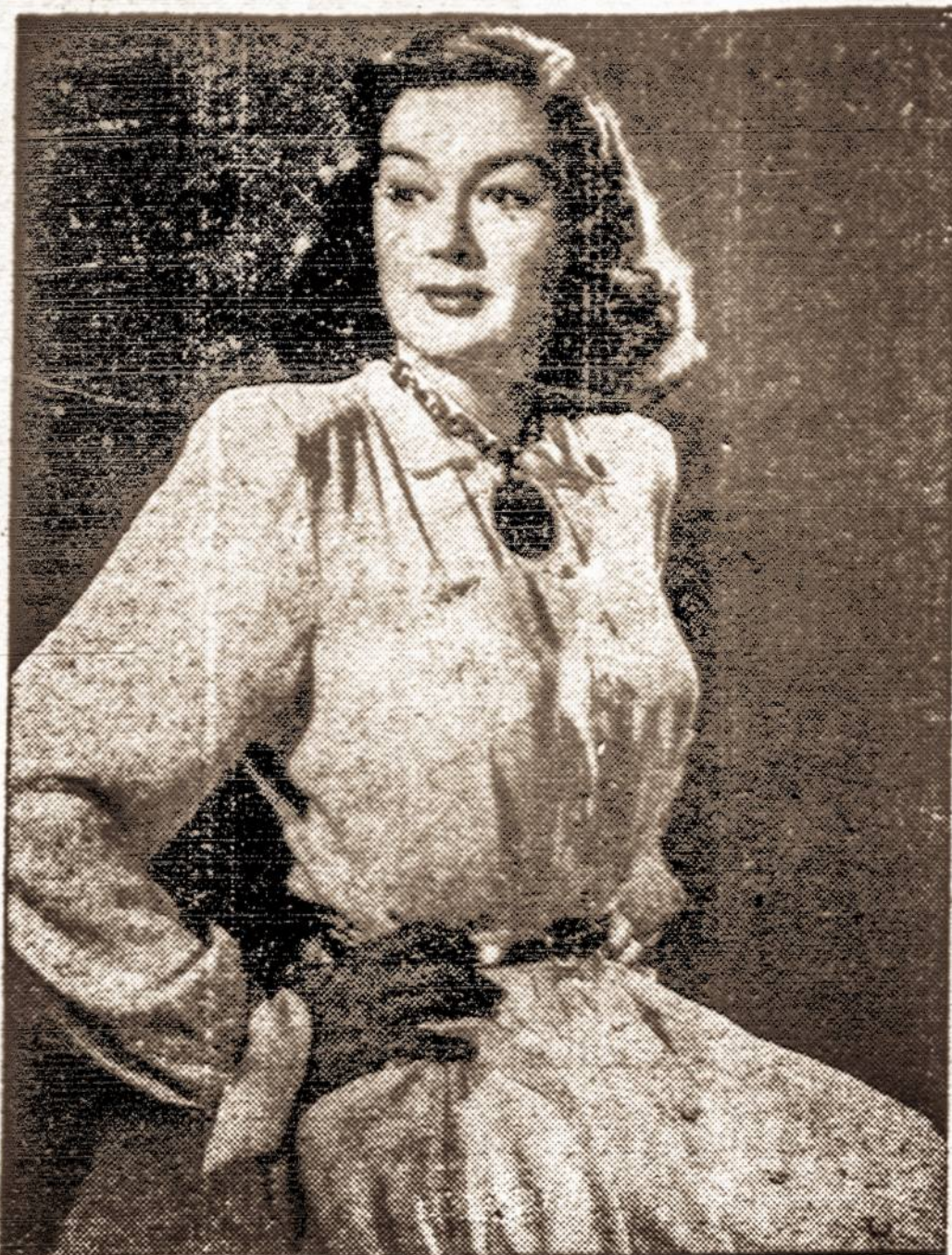
Kino artistė Rosalind Russell čia parodo pastovią sportiškos suknelės madą.

— Mano brolai, nežinau, kaip mes susikalbėsime; nors mano širdis dega — aš netu-riau drąsos. Ne žodžius turėčiau sėti jums, turėčiau atvažiuoti su vežimais duonos, ir pilni ratai turėtų pinigų, kurie nu-galėtų skurdą, ir nuvesti reik-tų jus į laukus, parodyti dir-vas ir miškus ir pasakyti: im-kite ir gyvenkite! Ir gal būt, turėčiau ateiti ir skelbti ne-apykanta, ir jūs geriau su-prastumėte mane, kad pasa-kyčiau išgaląskite savo peilius ir apskelbkit atsimokėjimo dieną. Bet aš kalbu dabar var-dan mūsų žemės, kurią Die-vas davė mums saugoti, ir jūs čia turite didesnę dalį, negu kuris iš didžiųjų: jeigu juod-varniai užuos kraują, išlietą tarp savųjų — jie sudraskys viską. Mano žodžiai yra liūdni, bet aš skelbiu viltį: yra šven-ta knyga, kurioje pasakyta a-pie tai, kad bus pareikalauta daugiau iš tų, kuriems duota daugiau. Ir štai, vadinu jus tais, kuriems daugiau teko, nes jūs turite kantrybę, išba-lusius veidus, tvirtas rankas ir stiprias širdis. Aš jūs pra-šau, brolai, išlaikykite jas gy-vas ir degančias, kol ateis