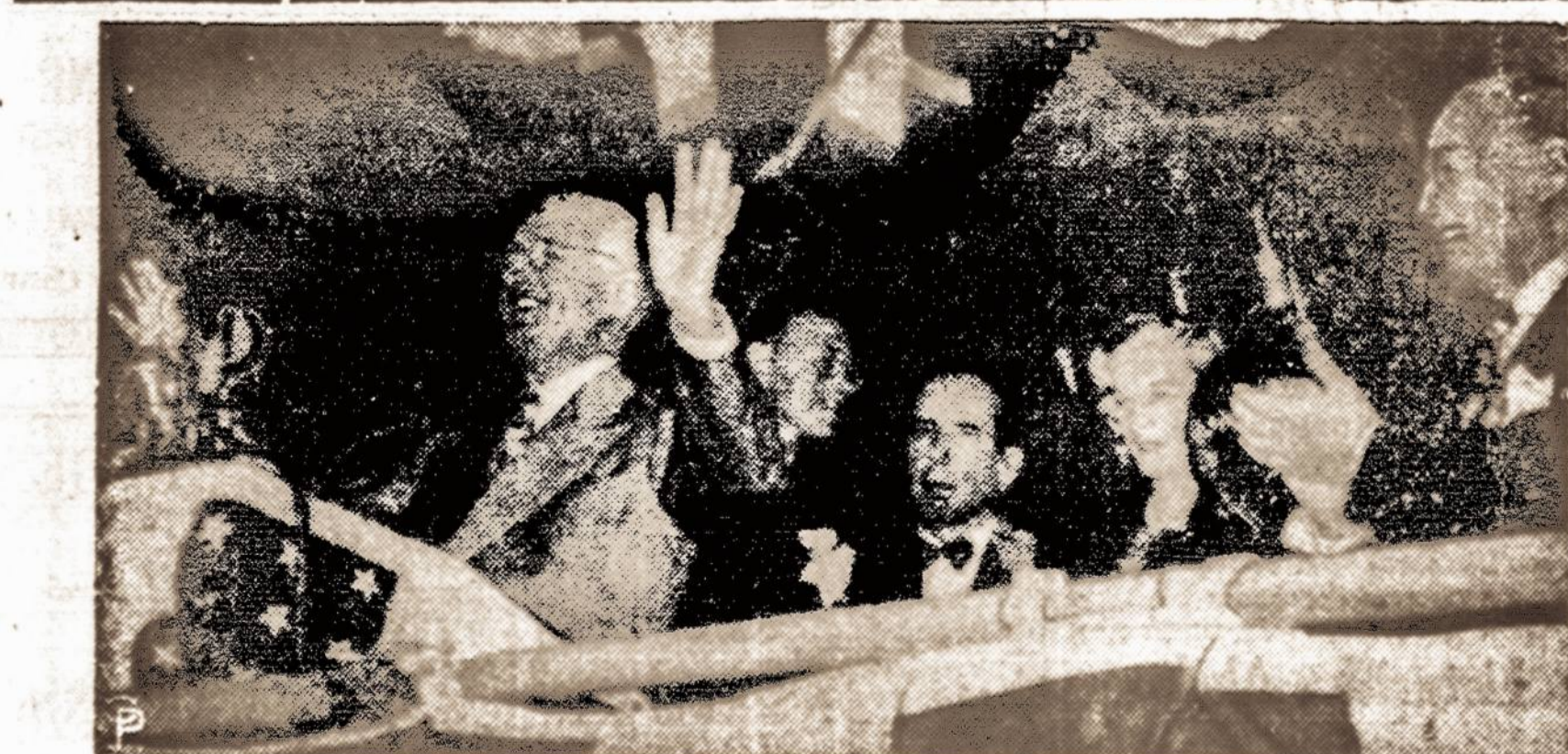
Prezidentas Trumanas, apsuptas politika nų ir filmų artistų, kalba Gilmore Stadione, Los Angeles, kur jis buvo entuziastiškai su tiktas.

piltos piliavos nesti racionaliai suvartojamos. Mariampolės sandėliuose supliti javai suža- lavo. Kai apžiūrėjo, mėgino juos iškeisti su ūkininkais į sveikus, už sveikų grūdų cent- nerį duodami 7 cent. sužalava- vusių. Ūkis negali būti našus ir dėl to, kad nėra darbo jėgos. Daug vyrų yra išvežta, dalis buvo pasitraukę į tokius dar- bus, kurie atpalaidavo nuo ka- ro tarnybos. Dalis bijodami išvežimo pasitraukė iš namų. O samdytis iš šalies galima tik teoretškai. Šalia sardinio aigos reikėjo už jį mokėti dar ir valstybei iki 200 črv. (2000 rb.). Tokių mokesčių ūkis ne- pakelia, ir nuo sardinio ten- ka atsiskaityti. Tokios ūkinės akcijos re- zultatas ūkinu atžvilgiu yra žiaurus. 1947 m. neapdirbtos žemės ploto buvo 40 nuosimėtu. Gy- ventyvių maitinimas net kaimė sumenkėjęs. Idėjusiai tai yra bolševizmo doktrina! laimėj- mas, nes ūkio sunaikinimas ir žmonių maršimas turi vesti į tokią naują pavidalą — kole- ktyvinį. Kuliamos mašinos naciona- lizuotos. Ūkininkam skiriama dar ir kita viešoji prievoelė: iškirsti ir parvežti turi 30 erd. miško kas turi 2 arklus. Kas turi 3, — turi parvežti iki 60 erd. Pažymėtina, kad miško kirsti varo ne į artimiausią mišką, bet į tolimesnį, o į artimajį mišką atvaro ūkininkus iš to- liau. Miškai kertami ir gabunami į... Don-baso sritį.