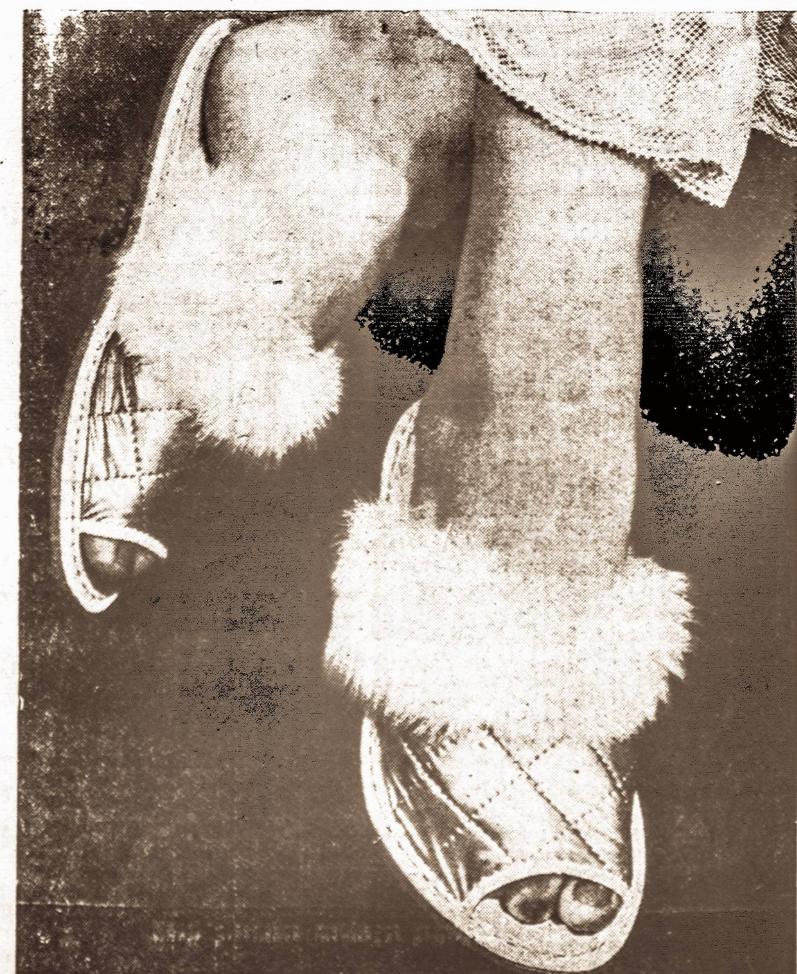
Nauji plastiškos medžiagos pantaplai.

Sviestą sutrinti, paskui įplakti po vieną trynį iki visi 12 bus sunaudoti. Pridėti migdolų, miltų ir cukraus. Labai gerai viską sutrinti ir išmaišyti. Skauradą reikia ištepsti riebalais, iškioti vaksiniu popieriu, kurį taip pat reikia riebalais ištepsti. Sudėti tešlą į skauradą. Galima apibarstyti suplaustais migdolais. Lūkuoti paprastu citrininiu lūku-