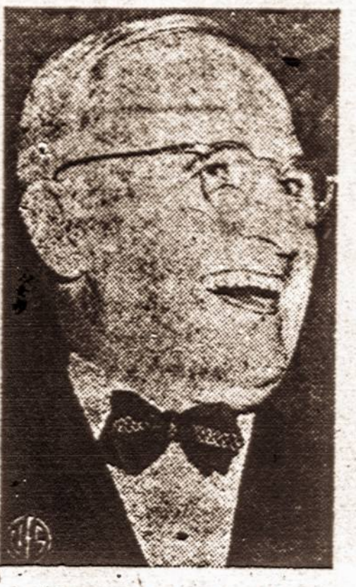
HARRY S. TRUMAN

kiegi pasisakė ūkio produktų aukštų kainų palaikymo klausimu. Visi šie faktai bent dalinai išaiškina šiu "keisčiausių" Amerikos istorijoje rinkimų rezultatus.