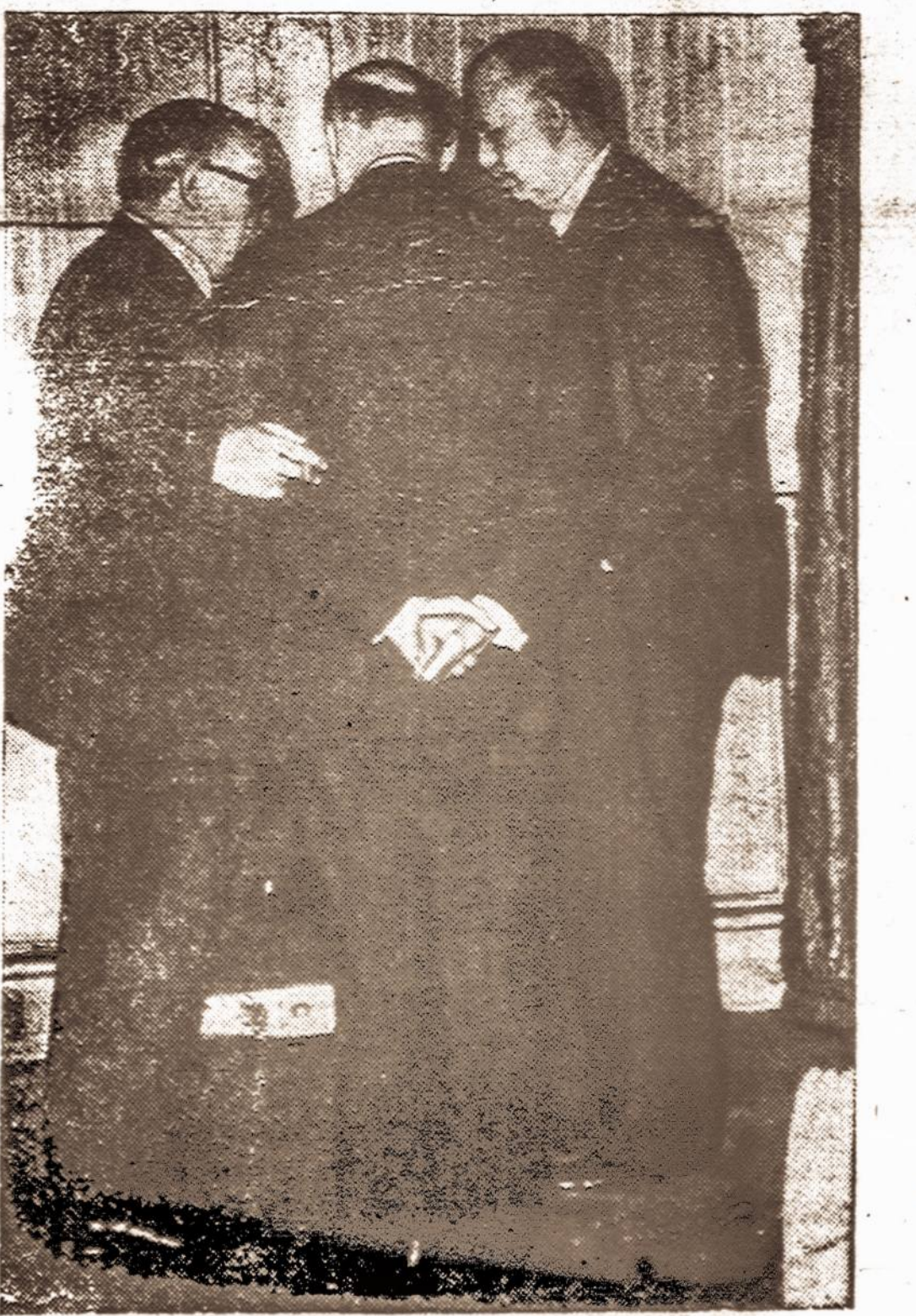
Kai sovietai, paskelbdami veto, atmetė Jungt. Tautų Saugumo Tarybos kompromisinį pasiūlymą, liečiantį Berlyno blokados nuėmimą, Trys Didieji, Bevinas, Schumannas ir Marshallas, sukėlė nosis, praėjo kusdėtis. Čia jie matomi Paryžiaus konferencijos metu.