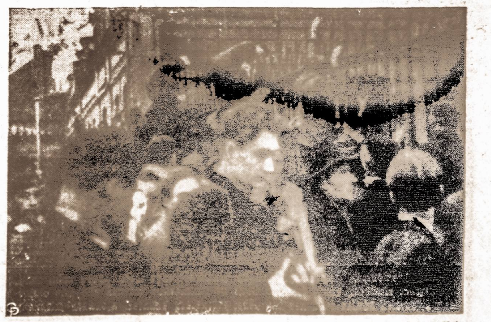
Šiuo metu Prancūzijoje vyksta audringi anglikasių streikai. Kariuomenė ir policija turėjo visą dieną kruvinių susirėmimų su streikininkais. Šiame paveiksle matyti, kaip anglikasai atakuoja Bėthune prefektūrą todėl, kad ten buvo suimta keletas jų streikininkų.