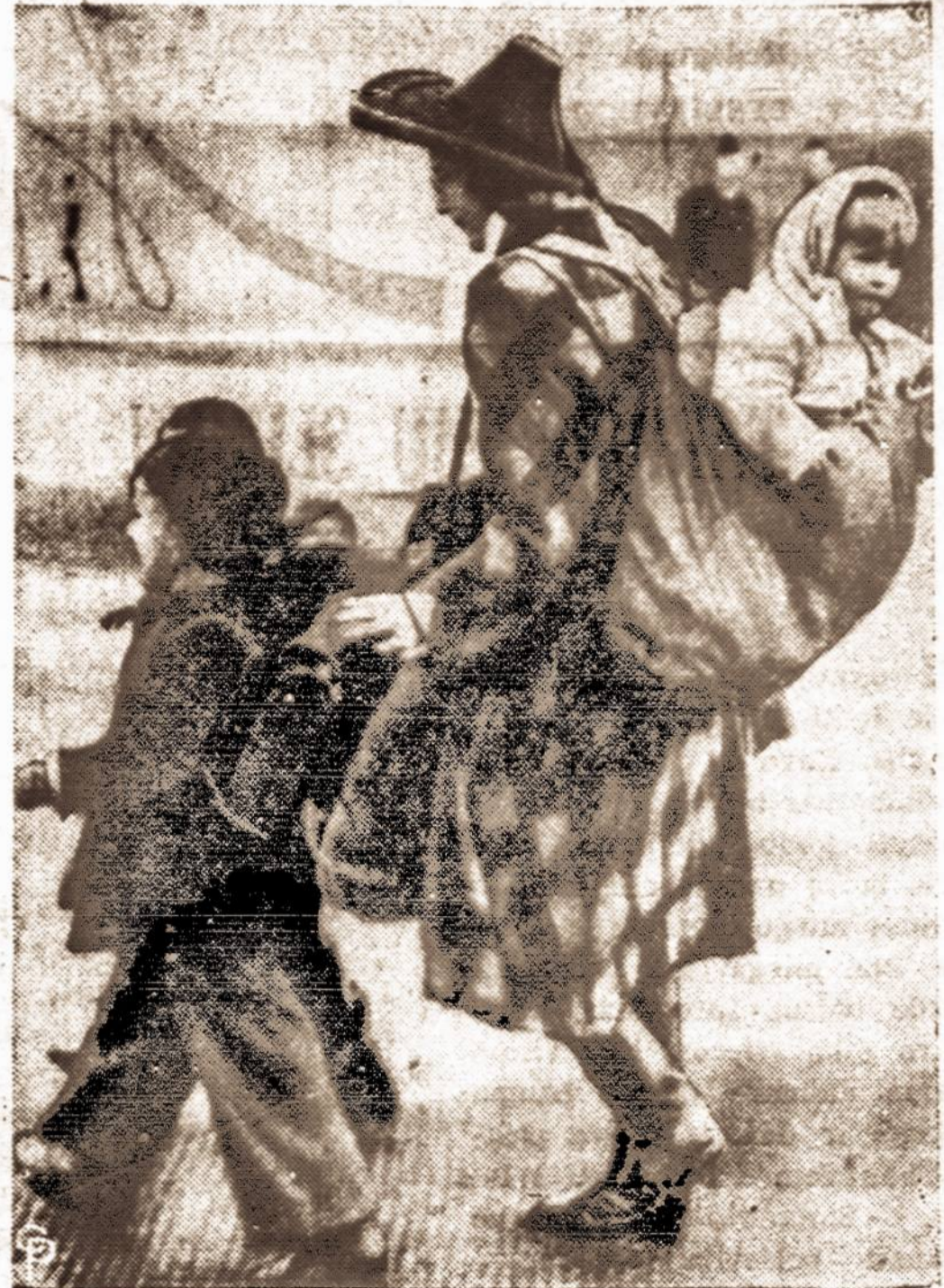
Indėnų pavyzdžiui, ši Berlyno moteris, ruošdamasi skristi pas savo vyrą Bremene, dukterį netesasi užnugary, o du didesnius sūnus varosi priešais save.

go staiga pabudintas. Kas dabar čia darosi su manim, kodėl tokios keistos mintys manė kankina? — klausia savęs Klyvis.