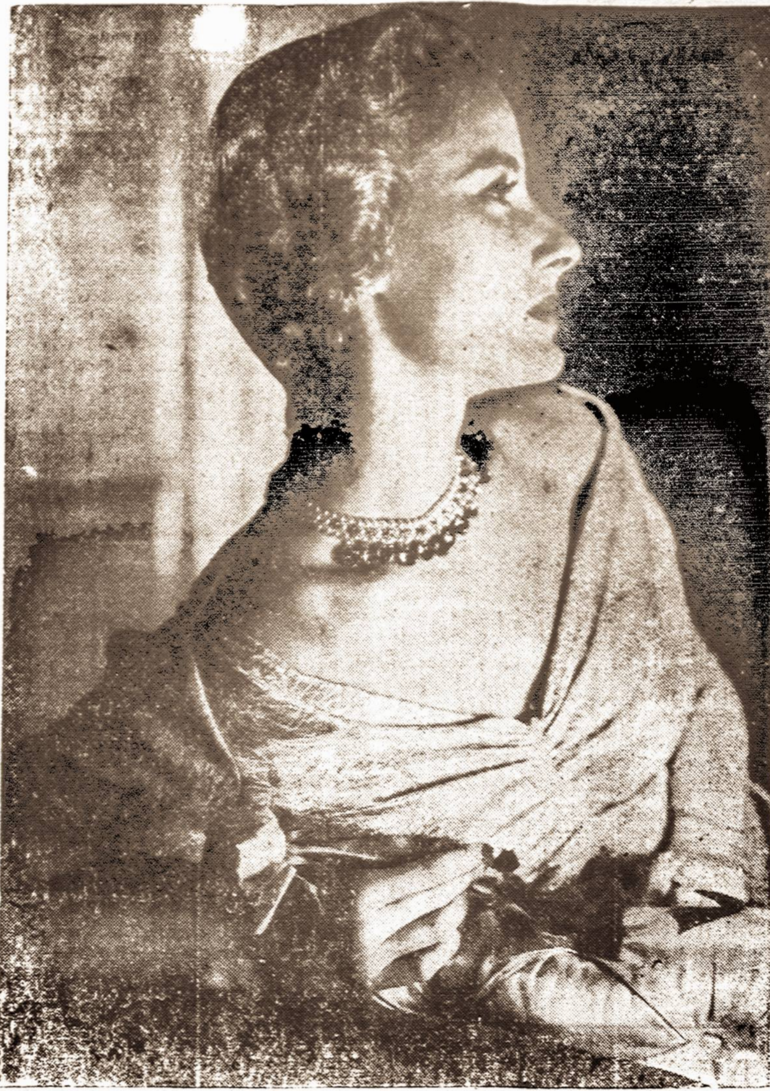
Moderni vakarinė moda