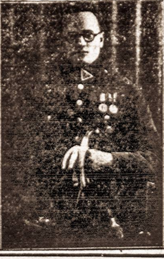
Tėvynės, bet dvasia niekad neužmirš ir atsikėrys už juodošįską Lietuvos pabučiavimą ir nukryžiavimą!