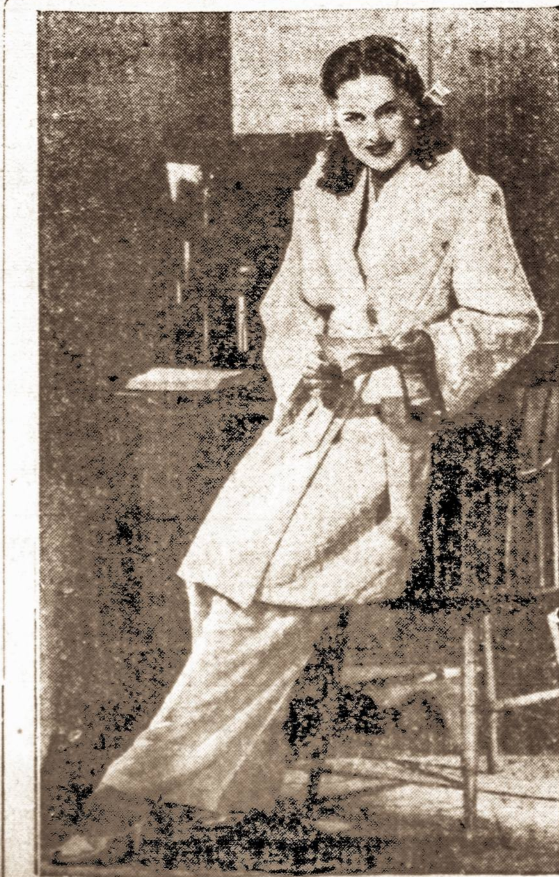
Ir einant gulti, galima gražiai atrodyti.

Po kelių vargingų kelionės parų pastekėme Panevėžį ir