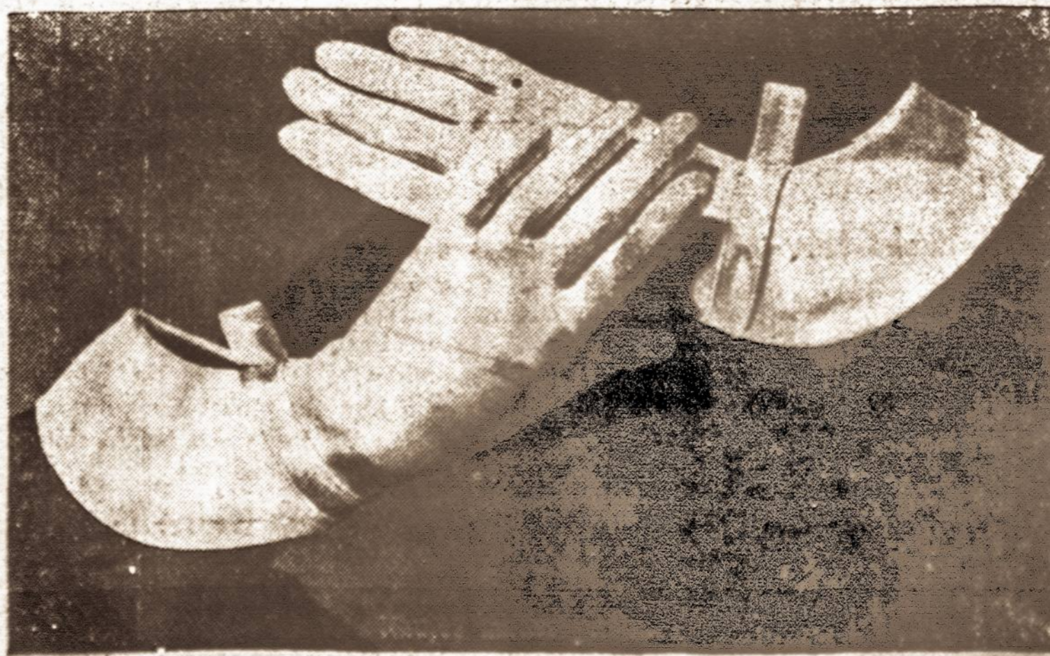
Naujos mados pirštinės