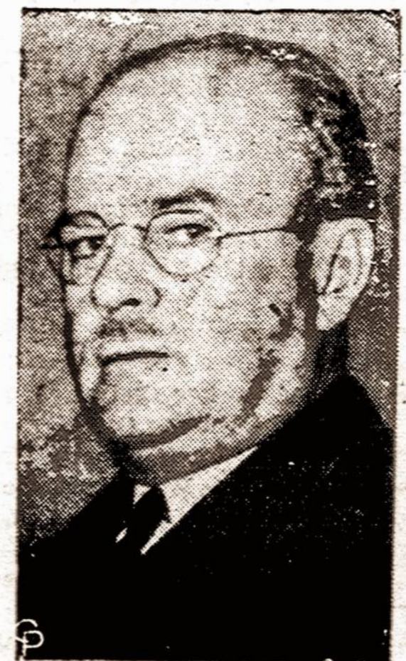
Naujas Laivyno sekretorius, Francis Patrick Matthews

JEI NE 10, TAI BENT 5 PROCENTUS, — reikalauja sumažinti valstybės išlaidas daugelis senatorių ir kongresmanų. Bet mažinti visose be išimties srityse išlaidas negalima ir netikslinga, todėl demokratai ir republikonai linkę susitarti, kad ateinančių metų biudžetas būtinau turėtų būti sumažintas bent trimis milijonais dolerių, taupant ten, kur galima ir reikia.