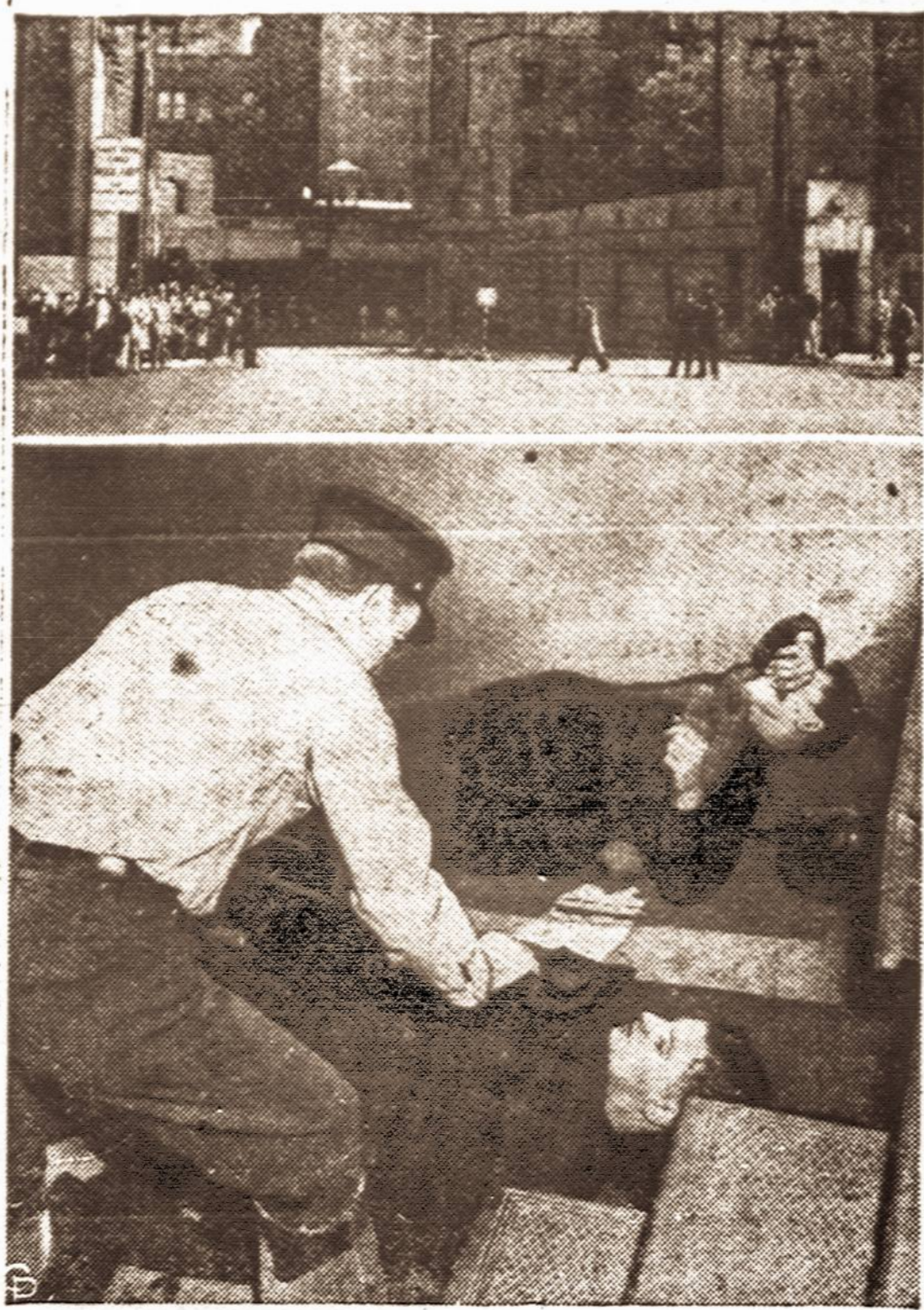
Pereitą penktadienį Holland tunelyje, jungiančiame New Yorką su New Jersey miestais, nuo perkrauto chemikalais sunkvežimio įvyko sprogdimas ir gaisras, per kurį buvo sužeista kelios dešimtys asmenų. Dabar tunelis naktimis uždarytas susisiekimui, kol bus atlikti remonto darbai.