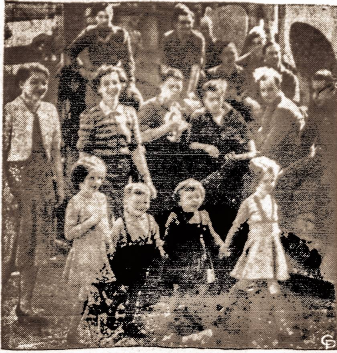
Nežūrint tebetrunkančio karo Kinijoje, britų jūrininkų žmonos su vaikais vyksta į Hong Kongą pas savo vyrus ir tėvus.