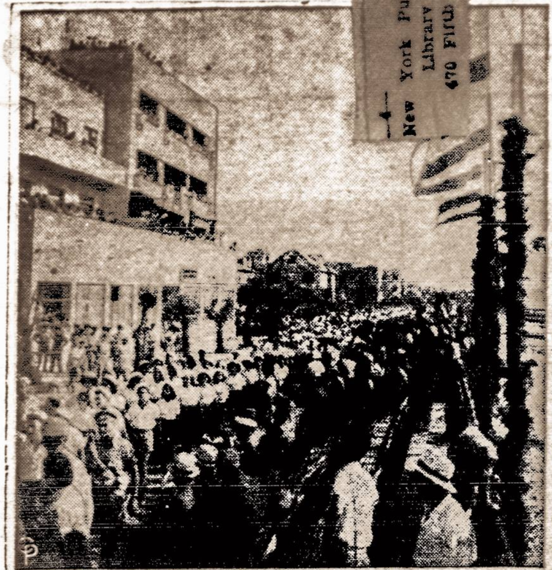
Israėlio valstybės laikinoje sostinėje, Tel Avive, šydai džiaugsmingai manifestuoja "jūros dienos" šventėje.