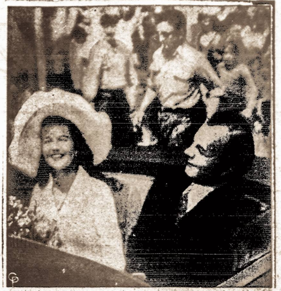
Rita Hayworth, Amerikos filmų žvaigždė, ištiekėjo už princą A. J. Khan, turtingo Indijos musulmano.

Ištoks komentaras gali pa- aiškinti, kodėl imta daugiau kalbėti apie vykstantį pasi- priešinimą sovietų okupuoe- se kraštuose. O palankus susi- domėjimas neseniai susikūru- sia "Sąjunga rusų tautai iš- laisvinti" (ja, sudarė 25 rusų emigrantai, tarp jų buvęs 1917 m. laikinosios vyriausybės pirmininkas A. Kerenskis, 1918 m., Lenino išvaikyto parla- mento pirmininkas Černovas ir kt.) paaiškina Vakarų norą ypatingo dėmesio kreipti į pačius rusus, pabrėžti jų tarpe kylantį sovietiniam režimui pasipriešinimą, kartais net su moraline skriauda kitiem kraštams.