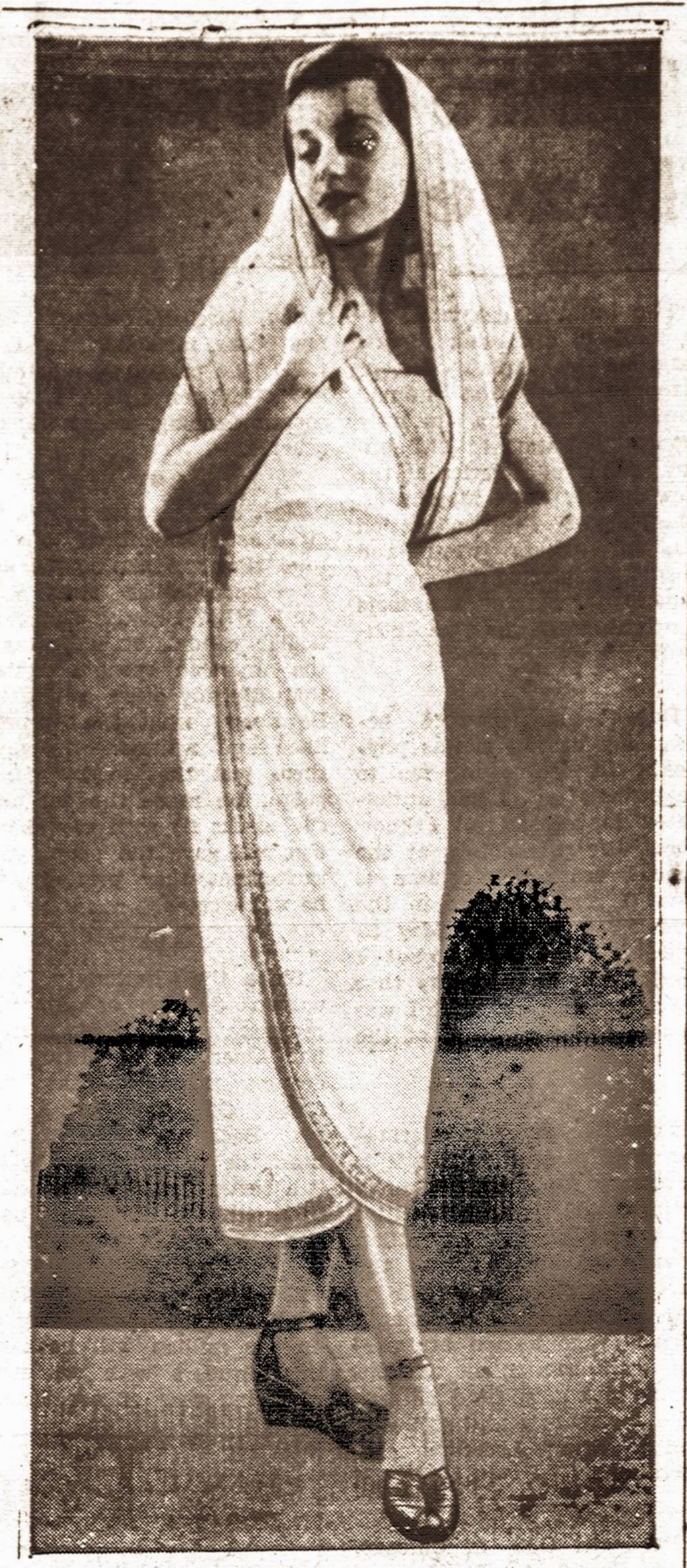
Indusų įtaka šių metų moterų madose

Nors ir nai vi buvo Aldona, bet dabar aiškiai suprato, kad ją apgavo suktas berlynetis. (Pabaiga)