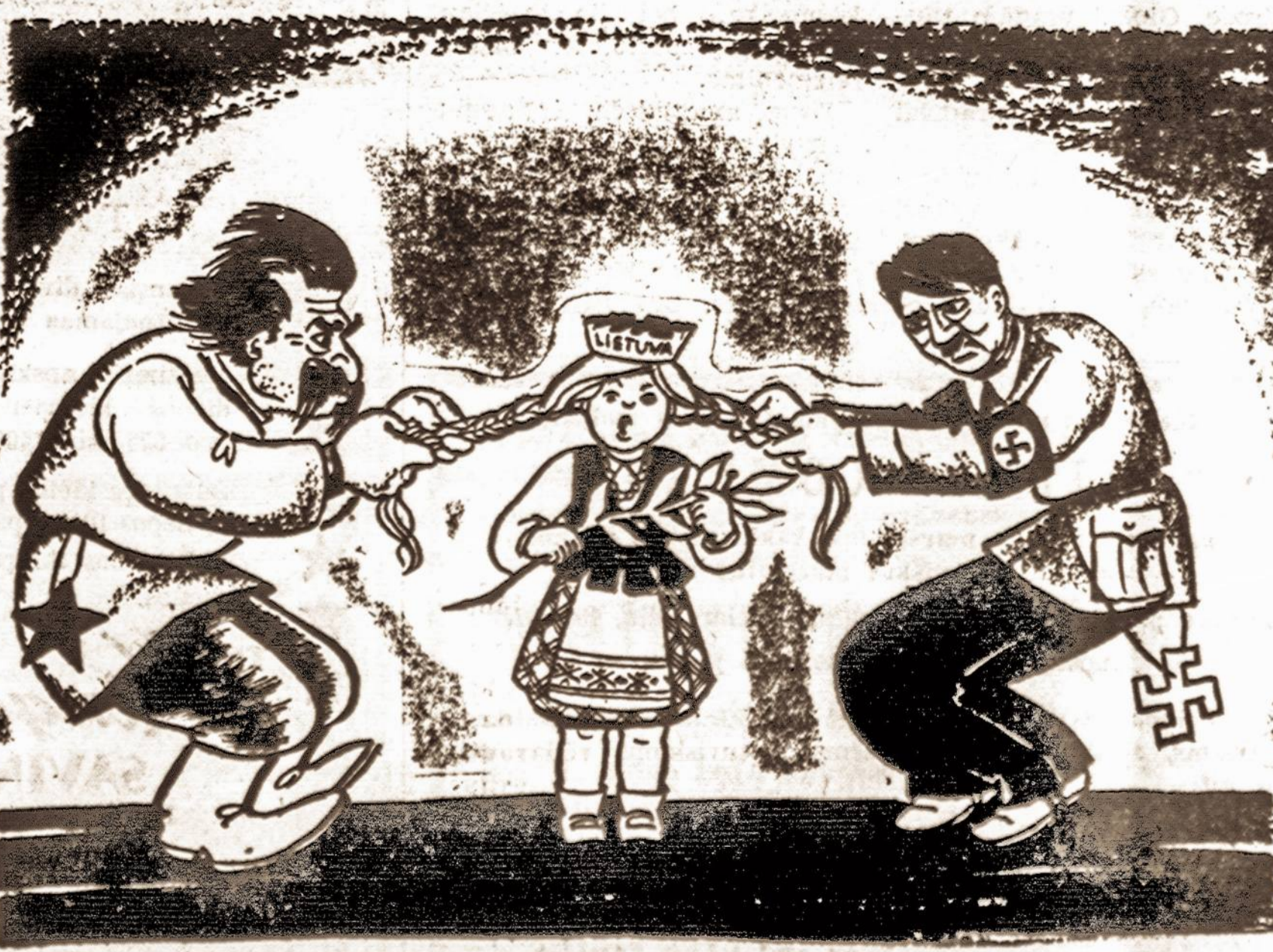
Du balvoni draskė Lietuvą, ir tūkstančiai jos vaikų dabar išblaškė Europoje. Per BALF kvieskime juos Amerikon. Siųskime jam darbo-buto garantijas.