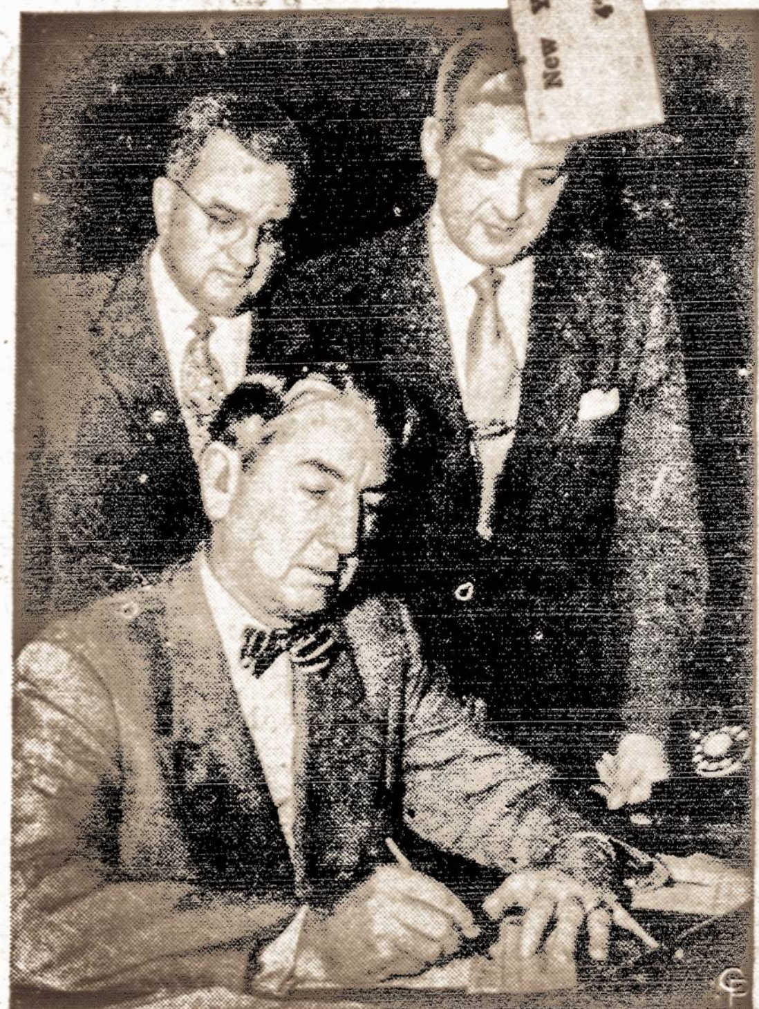
Vyriausias prokuroras Tom Clark pasirašo 25 milijonų dolerių čekį. Pinigai skirti Filipinų ir Ramiojo vandenyno salų gyventojams, nukentėjusiems nuo japonų imperialistų.

— Komunistų vado Eislerio, kuris slapta pabėgė iš Amerikos ir nedalyvauti minios susigrūdimuose ten, kur šis liga išsiplėtus.