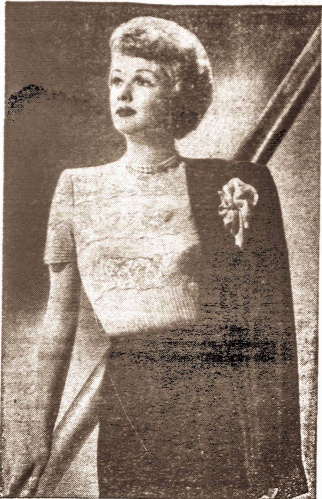
Kino aktorė Lucille Ball rodo elegantišką kostiumą, vilkėdama prie jo sijono palaidinę.