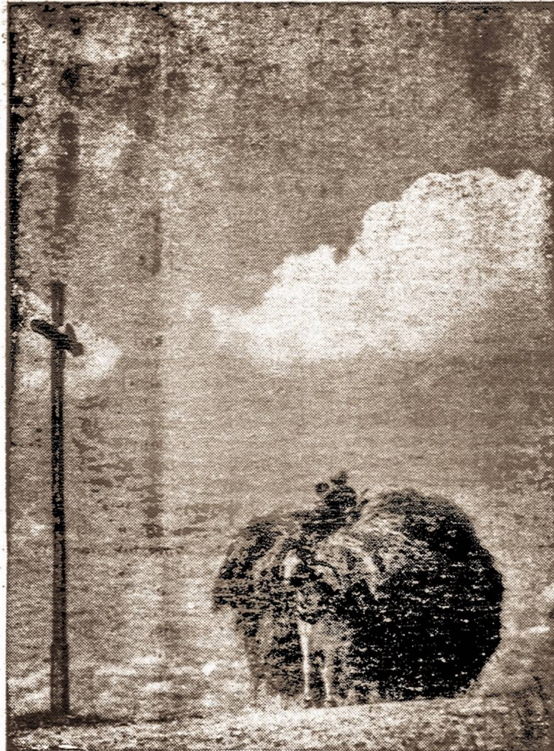
Tai buvo anais gerais laikais...