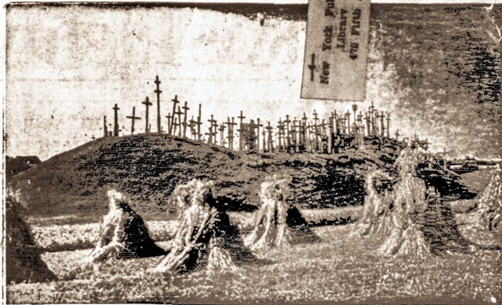
"Lietuva brangi, mano tėvyne, šalis didvyrių, kapuų kur guli..."