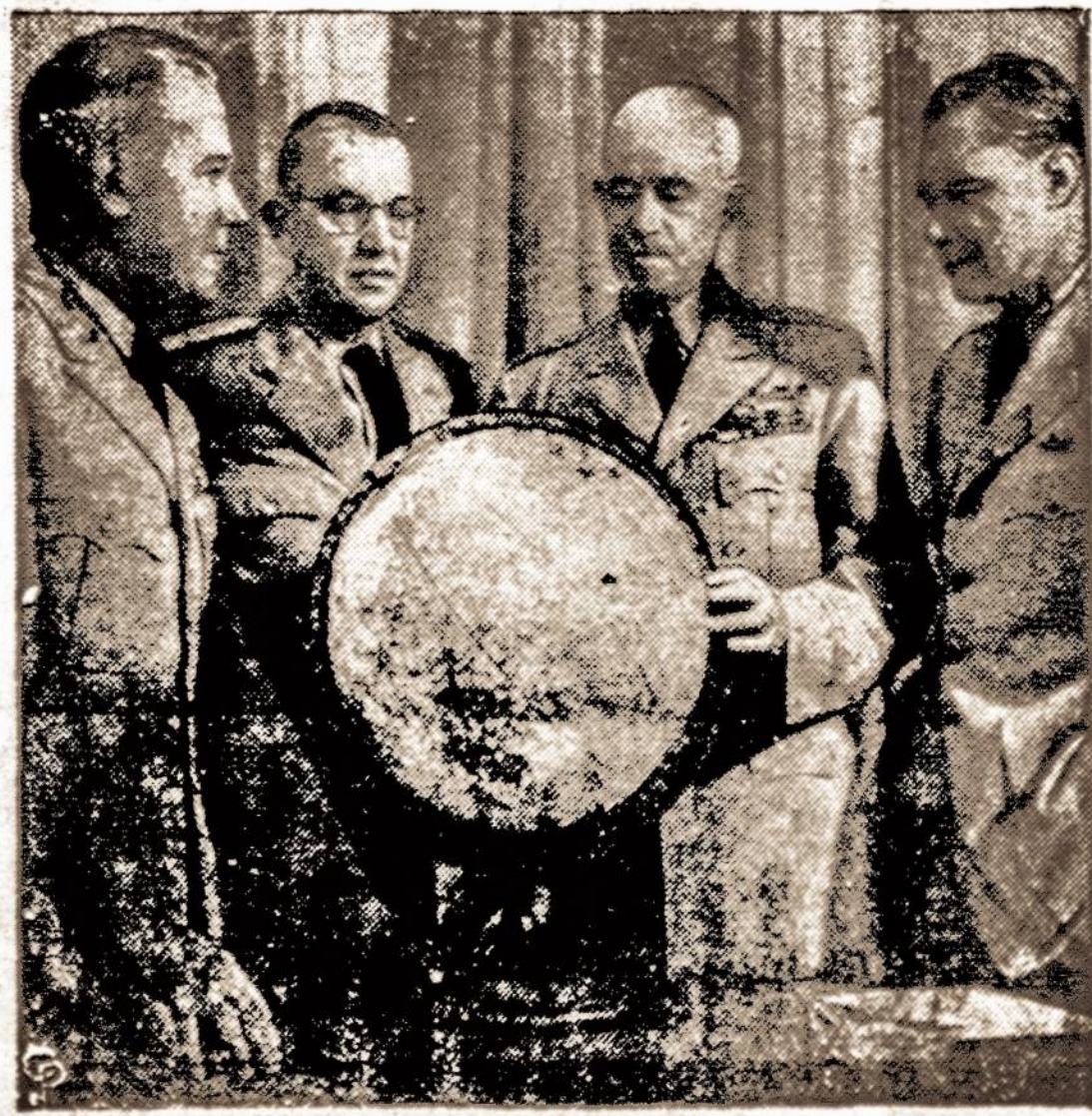
JAV generalinio štabo skyrių viršininkai aptaria svarbiuosius klausimus, pasirengdami rugsėjo 6 dienos kelionei į Alaską, kur norima susipažinti su strateginėmis gynybos sąlygomis.

Cekoslovakijos vyriausybė "ūkiniais sumetimais" perkėlė net šešias bažnyčias į sekmadienis. Tarp kitų ir didysis penktadienis perkeltas į sekmadienį.