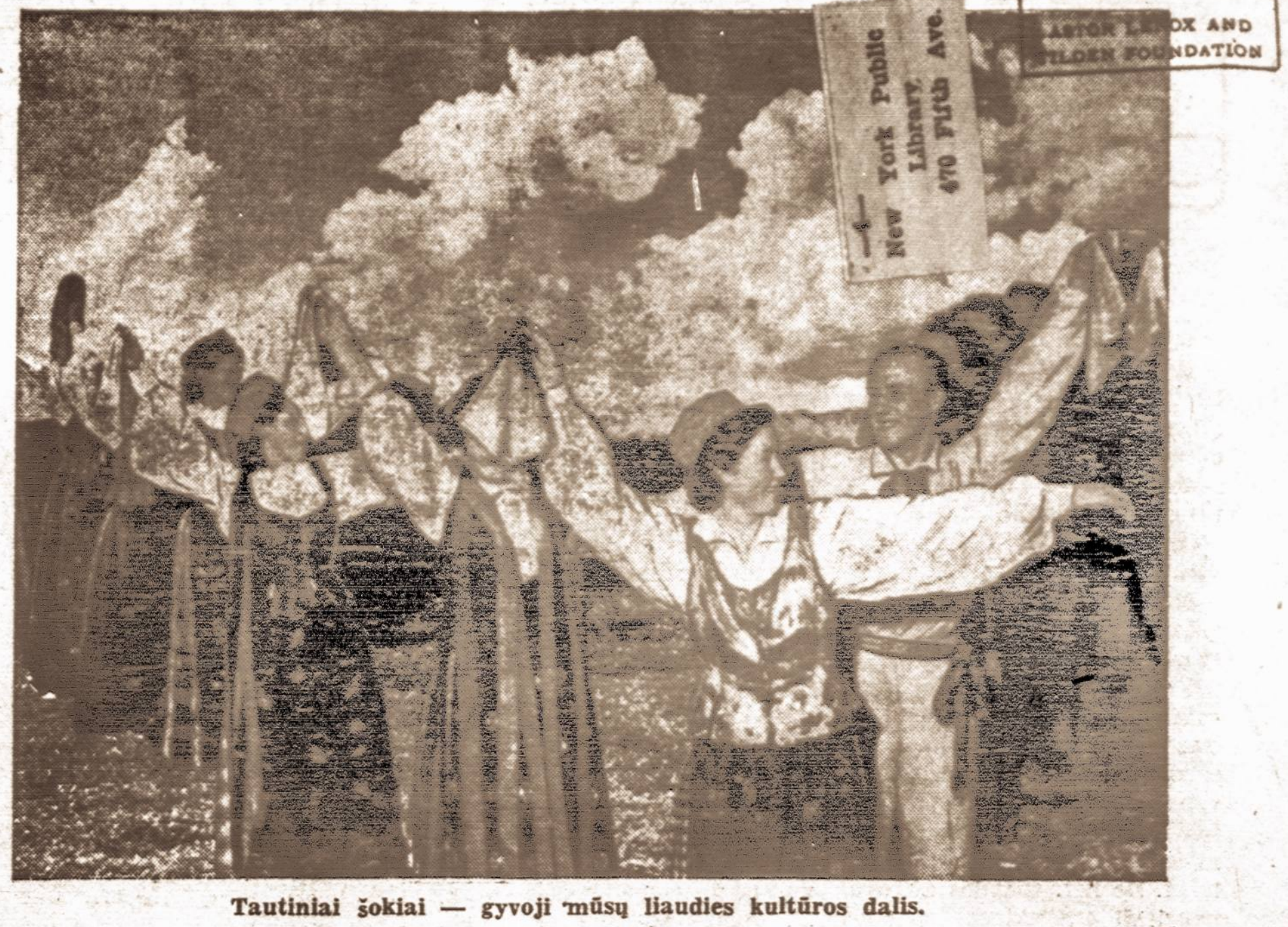
Tautiniai žokiai — gyvoji mūsų liaudies kultūros dalis.