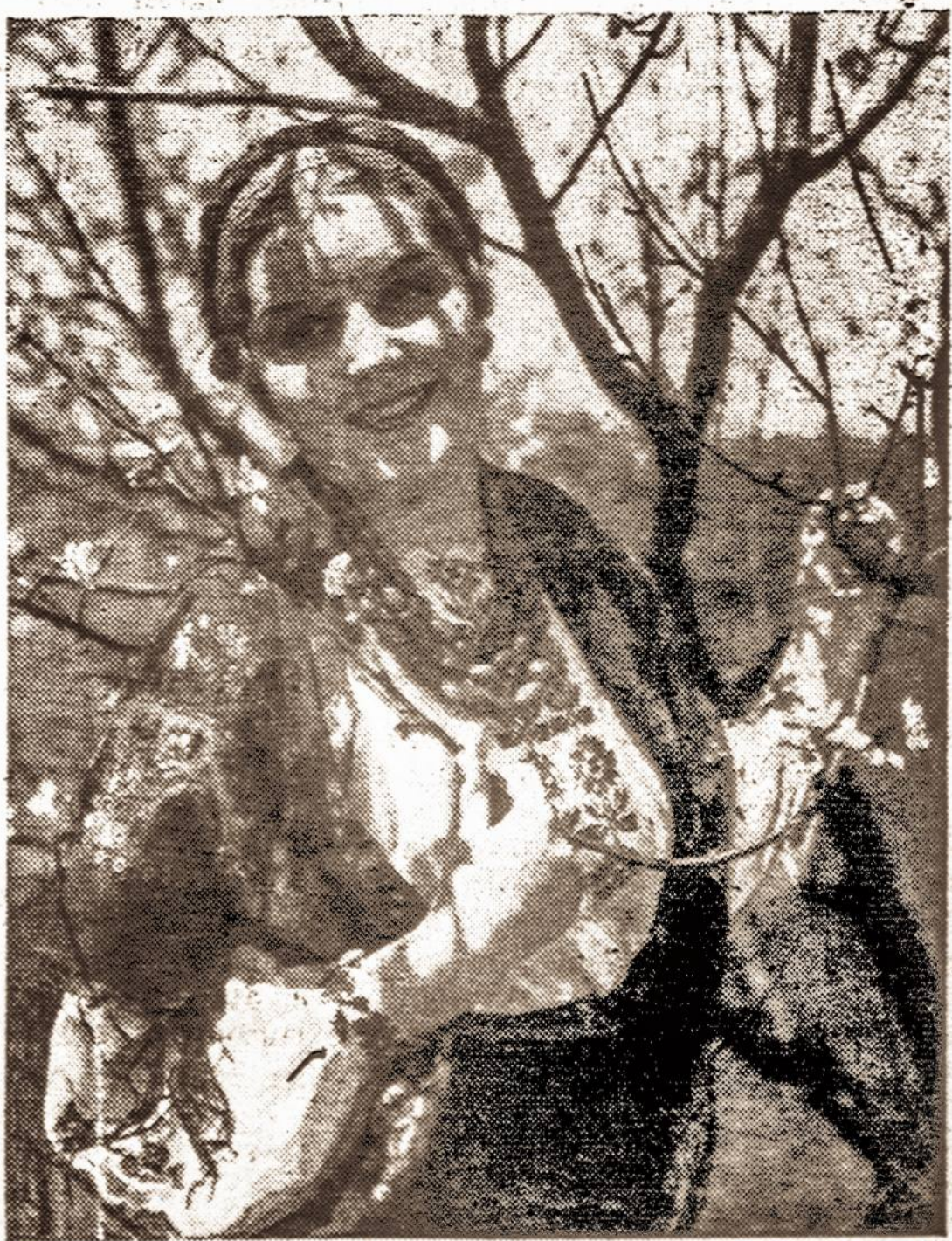
Ant balto kaklo gintarų šniūrelis...

Liaudis tiki, kad gintaras žmones apsaugo nuo įvairių ligų. Gintaro karoliaus nešiojančios moterys, esą, nesergančios Bazedovo liga. Gintariniai auskarai apsauga nuo įvairių akių ir ausų ligų ir pan. Nuomonė apie gintaro gydymo galia, atrodo, buvo labai plačiai paplitusi. Net graikų mitologijoje randamas padavimas, pagal kurį nežinomoj, pasakioskoj prūsų žemėje gyvena laimingieji Hyperborejai, kurie, būdami nepaprastai, nesutrikdomos sveikatos, savo tūkstantmetį gyvenimą praleisdavo nesibaigiančioj