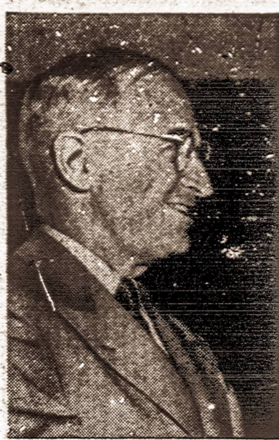
Harry S. Truman

Kongresą sveikino ministras P. Zadeikis, Lietuvos diplomatinis šefas ministras St. Lozoraitis, Lietuvos konsulai, buvęs Lietuvos prezidentas dr. K. Grinius, Lietuvos ir Latvijos pasiuntiniai, Vasario šešioliktosios Akto pasirašytojas prof. M. Biržiška ir šimtai ki-