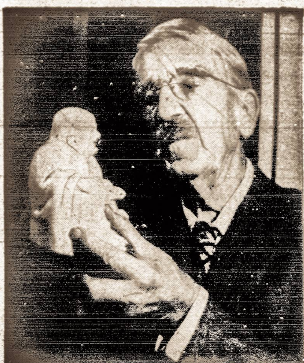
Žymusis filosofas dr. John Dewey savo 90 m. amžiaus sukakties proga gavo vertingą kinetiską statulėlę.