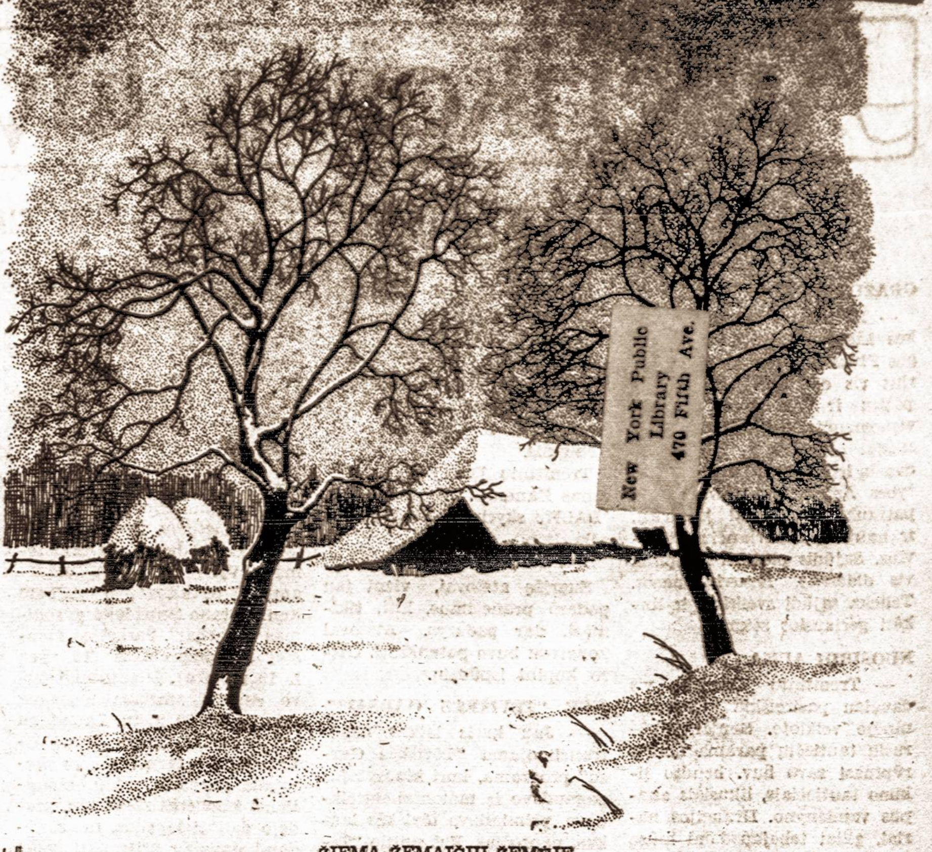
ŽIEMA ŽEMAIČIŲ ŽEMĖJE

Šis tarptautinės organizacijos vadovaus devyoniškos asmenų vykdomasis komitetas, kurį sudaro vienas Afrikos atstovas, trys — Azijos ir Vid. Rytų, po vieną atstovą Australijos ir N. Zelandijos, du — D. Britanijos, keturi — Europos, du — lotynų Amerikos, keturi — šiaurės Amerikos ir vienas — Vakarų Indijos. Devyoniškasis atstovas bus tos organizacijos generalinis sekretorius.