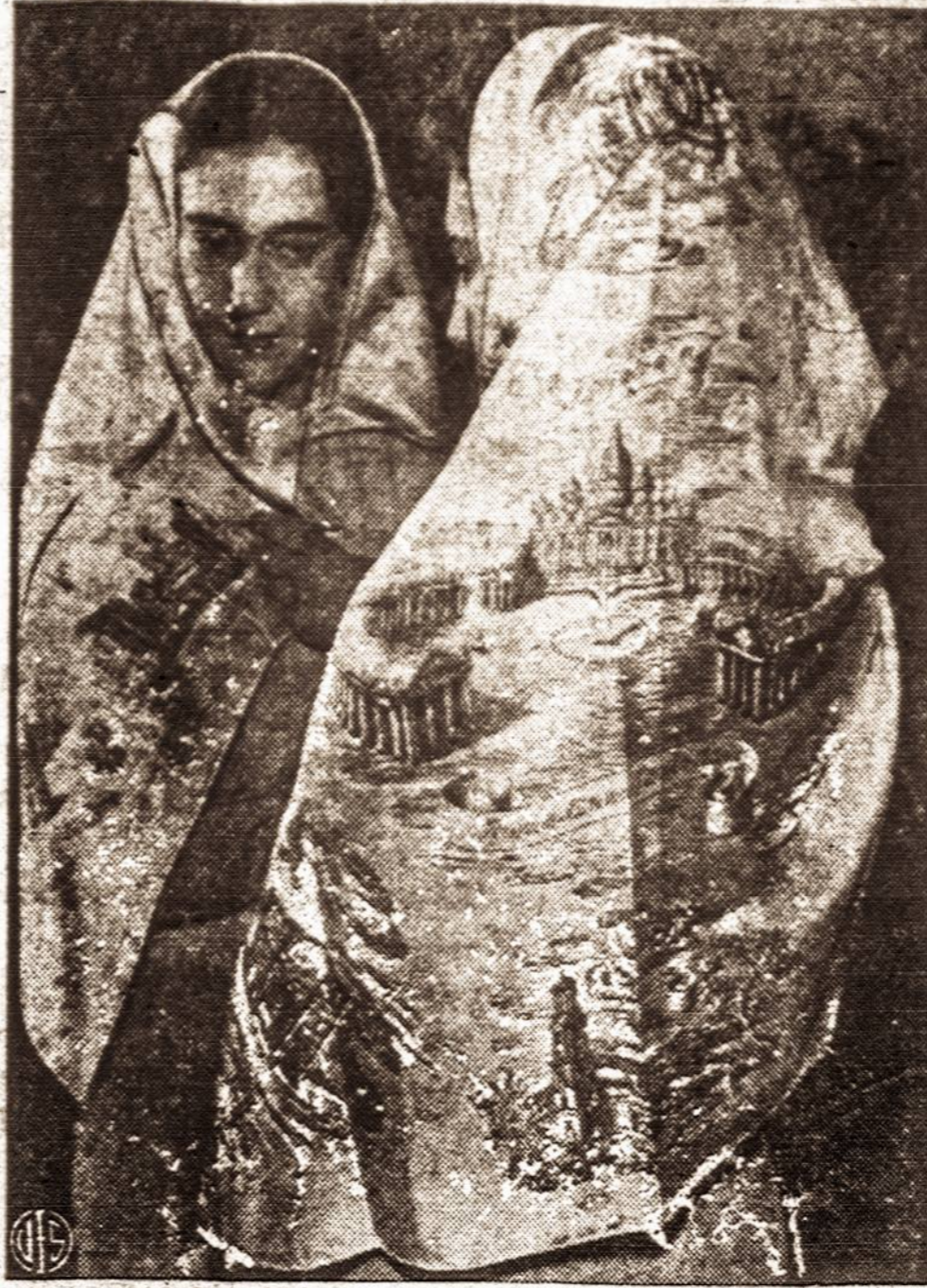
Šviesė, kurią turisai galės įsigyti Romoje sv. Metų proga.