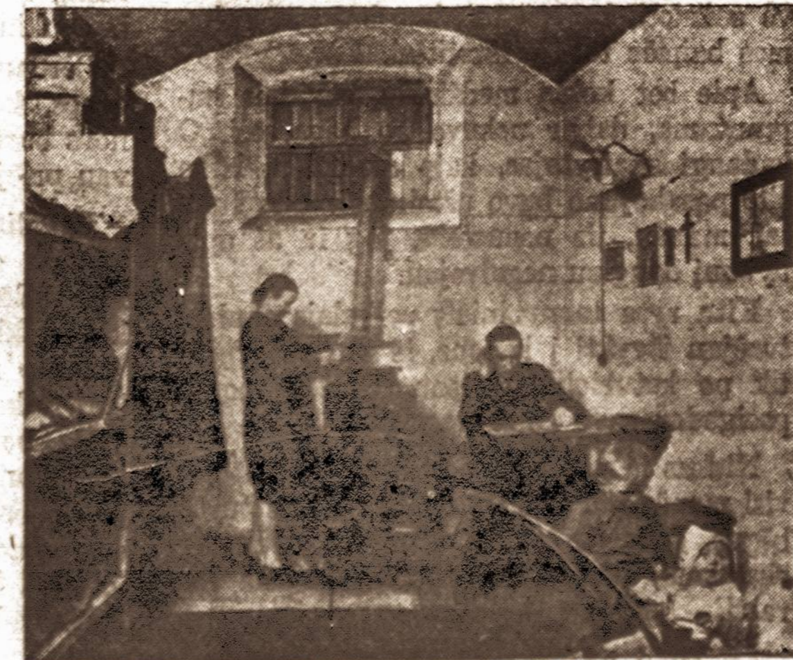
Jiems dar nesibaigė tremties vargas.

Jungtinių Valstybių Sveikatos Biuras pataria šeimnininkėms, kaip taupyti pinigų, vartojant kur galima pieno miltelius. Seimai, turintys daug vaikų, pieno pirkimas daug atsieina. Kiekvienam vaikui reikalinga trys keturi stiklai pieno per dieną, suaugusiui gi du ar trys stiklai, vadinasi, penkių asmenų šeima sunaudoja penkis kvortas pieno kasdien. Todėl patariama šeimnininkėms vartoti liesą sausą pieną, vadinamą "dry skim milk". Šiandien daugelis amerikiečių sausas pienas yra natūralus pienas, iš kurio pašalinti vanduo ir riebalai. Miltelių pavidale, ji galima vartoti įmaišant į miltus, arba kitą maistą, arba galima jį paversti skystu — trys ketvirtadaliai puoduoko pieno miltelių vienai kvortai vandens. Šitoks pienas neturi jokių riebalų, tačiau yra toks pat maistingas, kaip šviežus pienas. Jame yra proteino raumenims stiprinti, kaulams reikalingų mineralų, taipgi vitamino "B". Skysto pavidale šitą pieną reikia laikyti šaldytuve, o sausa bet kur, net kelias savaites. Viešosios Sveikatos ekspertai pataria jį vartoti, gaminant sriubą, miltinuius valgius, duoną, gerimus ir prievalgius. Išbandykite sausąjį pieną!