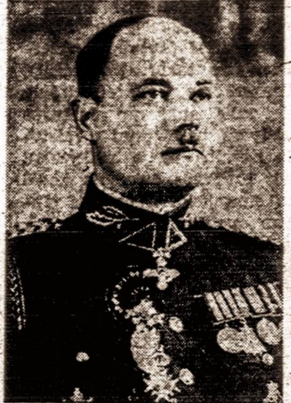
Gen. Jonas Černius, buvęs Lietuvos ministras pirmininkas ir kar. štabo viršininkas.