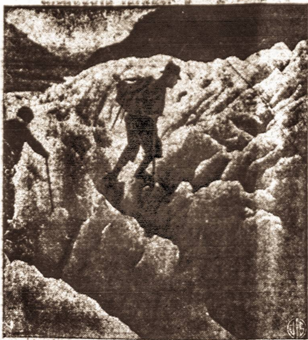
Žiemos sportas kalnuose.